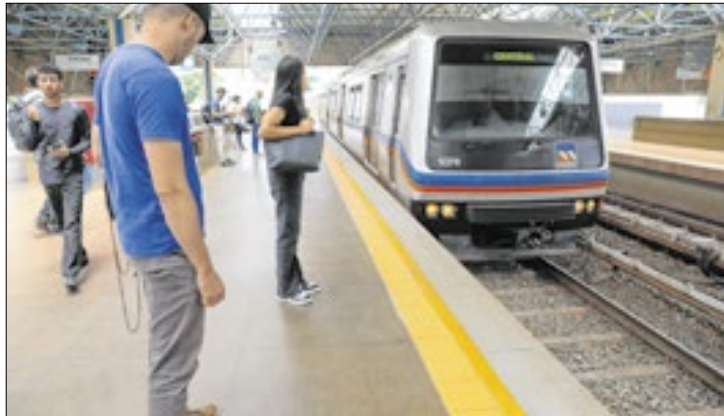
Financiamento aprovado visa ampliar rede e estações