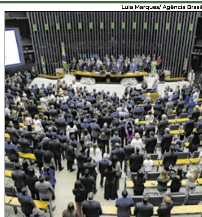
Brasil deveria discutir ter parlamentarismo