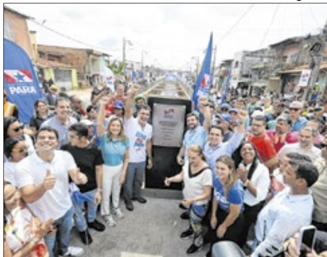
Canal moderniza drenagem e combate alagamentos