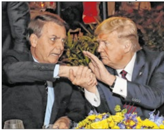
Bolsonaro e Trump: diferenças nos dois países