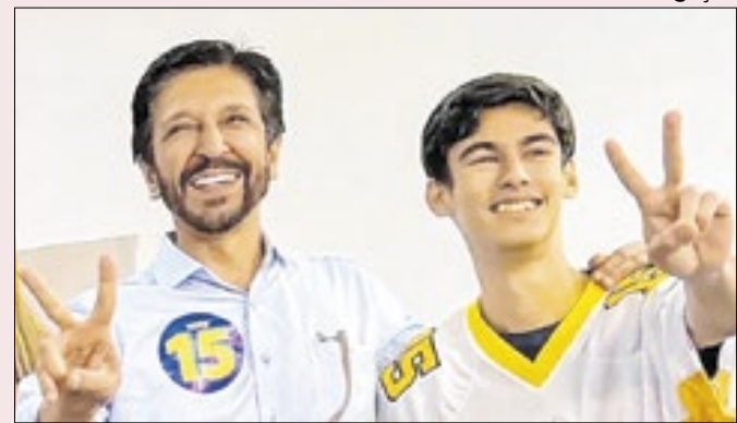
Prefeito quer recuperar espaço tomado pelo PSDB