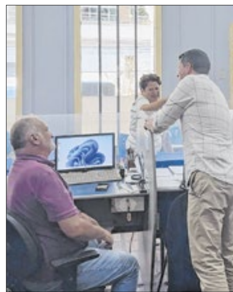
Visita técnica na Companhia Petropolitana de Trânsito e Transporte