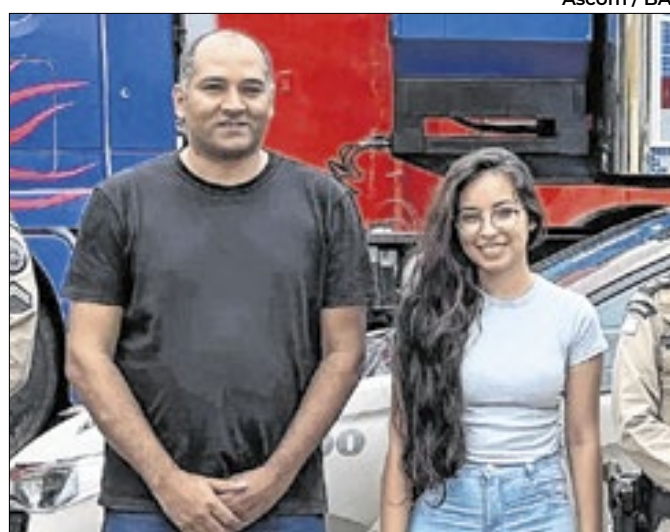
Ação foi abraçada pelo curso de Engenharia

A produção das mudas é realizada em três viveiros estaduais