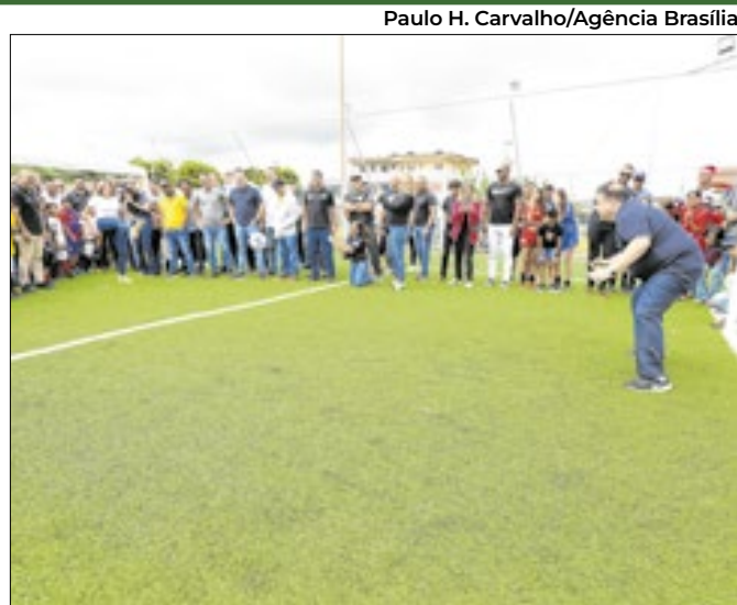
Vice-governadora Celina Leão (PP) inaugurou o campo

Equipe bilíngue atende demandas de embaixadas em Brasília