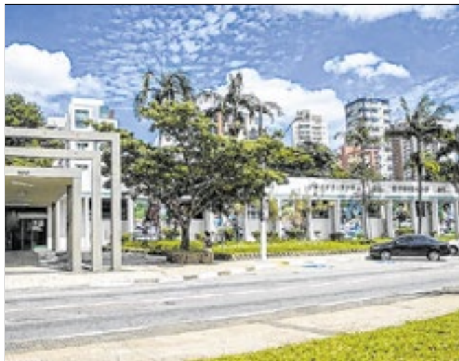
Cidade ficará três dias de luto pela morte do secretário