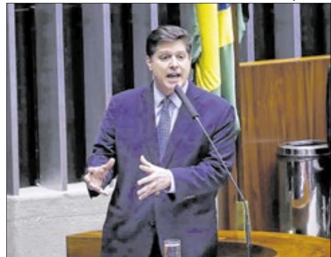
Presidente do partido quer protagonismo da sigla