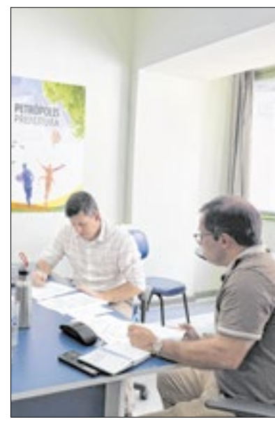
Diálogo com o secretário de Esporte, Leandro Kronemberger