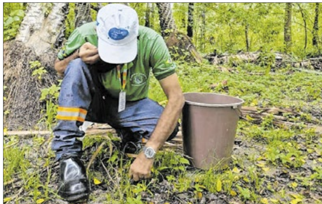
Produção das mudas é feita em três viveiros no estado

A Secretaria de Estado da Saúde (SES), por meio da Fundação Estadual da Saúde (Funesa) e da Escola de Saúde Pública de Sergipe (ESP-SE), encerrou o ano de 2024 com resultados positivos na qualificação dos profissionais do Sistema Único de Saúde (SUS).