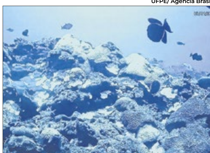
Maragogi, Natal e Salvador são os locais mais afetados

O balanço anual de 2024 do projeto Coral Vivo alerta para os efeitos da forte onda de calor associada ao fenômeno El Niño. O relatório revela que os recifes de corais no Brasil sofreram o segundo grande episódio de branqueamento, resultando em intensa mortalidade