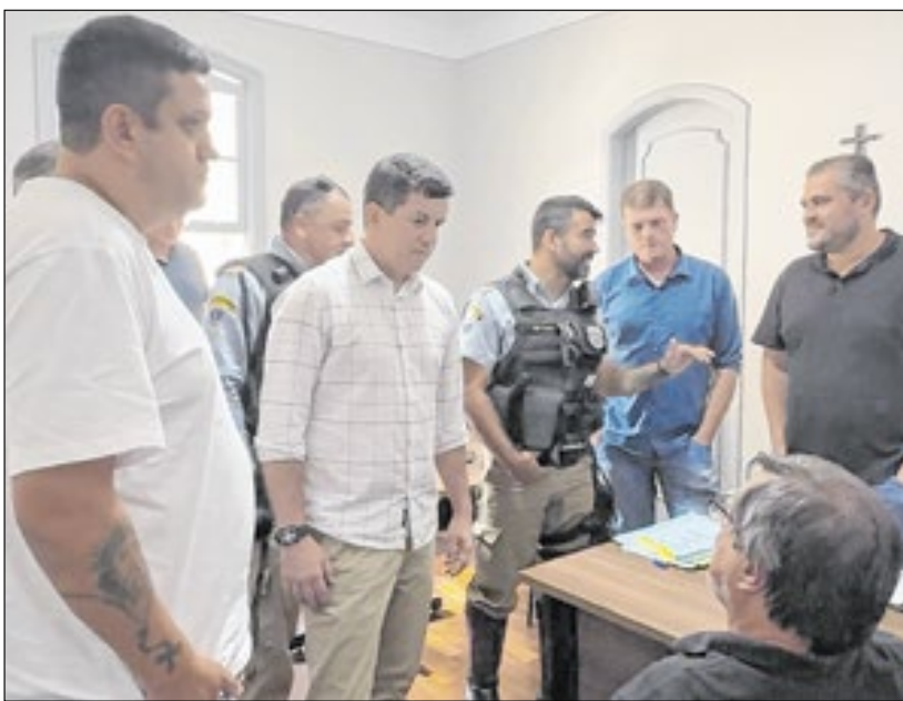
Na Companhia, foco foi conversar sobre desafios e melhorias no trânsito da cidade, tendo segurança como prioridades