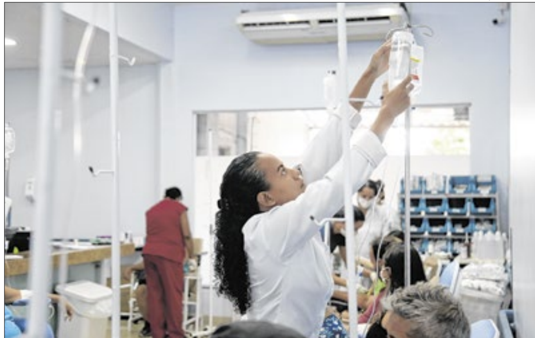
Saúde bate recorde com mais de 3 milhões de pessoas atendidas nas 27 UPAs em 2024

A Secretaria de Estado de Saúde bateu recorde de atendimentos nas 27 Unidades de Pronto Atendimento (UPAs) em 2024. Foram mais de 3 milhões de pessoas que receberam cuidados de saúde. O crescimento foi de 8% em comparação com 2023, quando foram registrados 2,8 milhões de pacientes. Na capital, os atendimentos ocorreram nas 16 unidades, que prestam serviço de