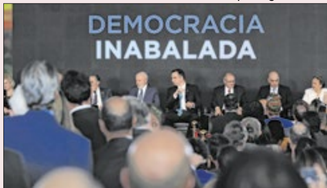
Instituições brasileiras se uniram pela democracia