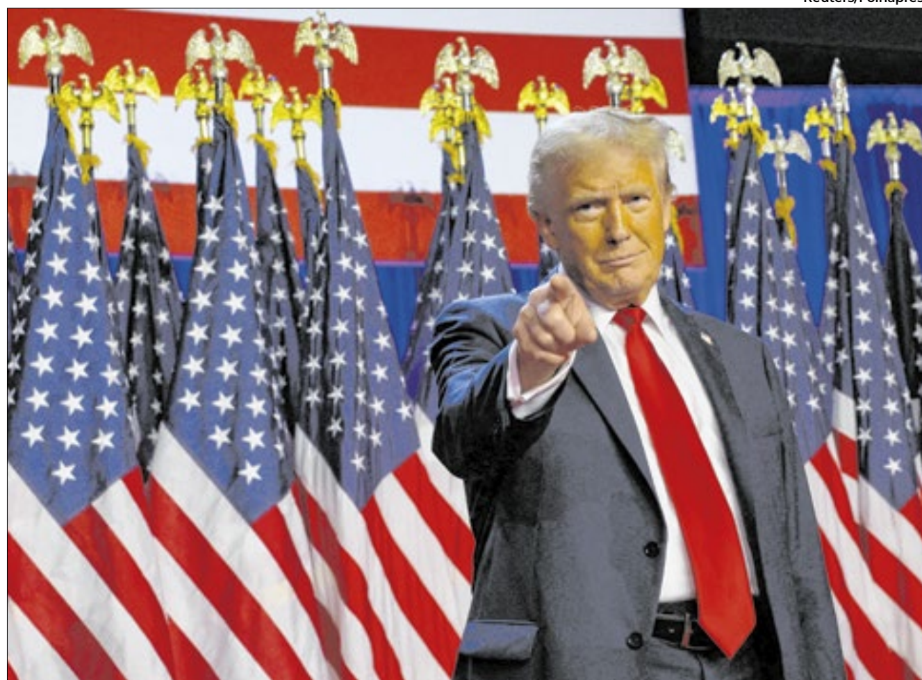
Posse de Trump acontece no próximo dia 20 de janeiro

enquanto os democratas fizeram barulho nos anúncios de triunfo da atual vice.