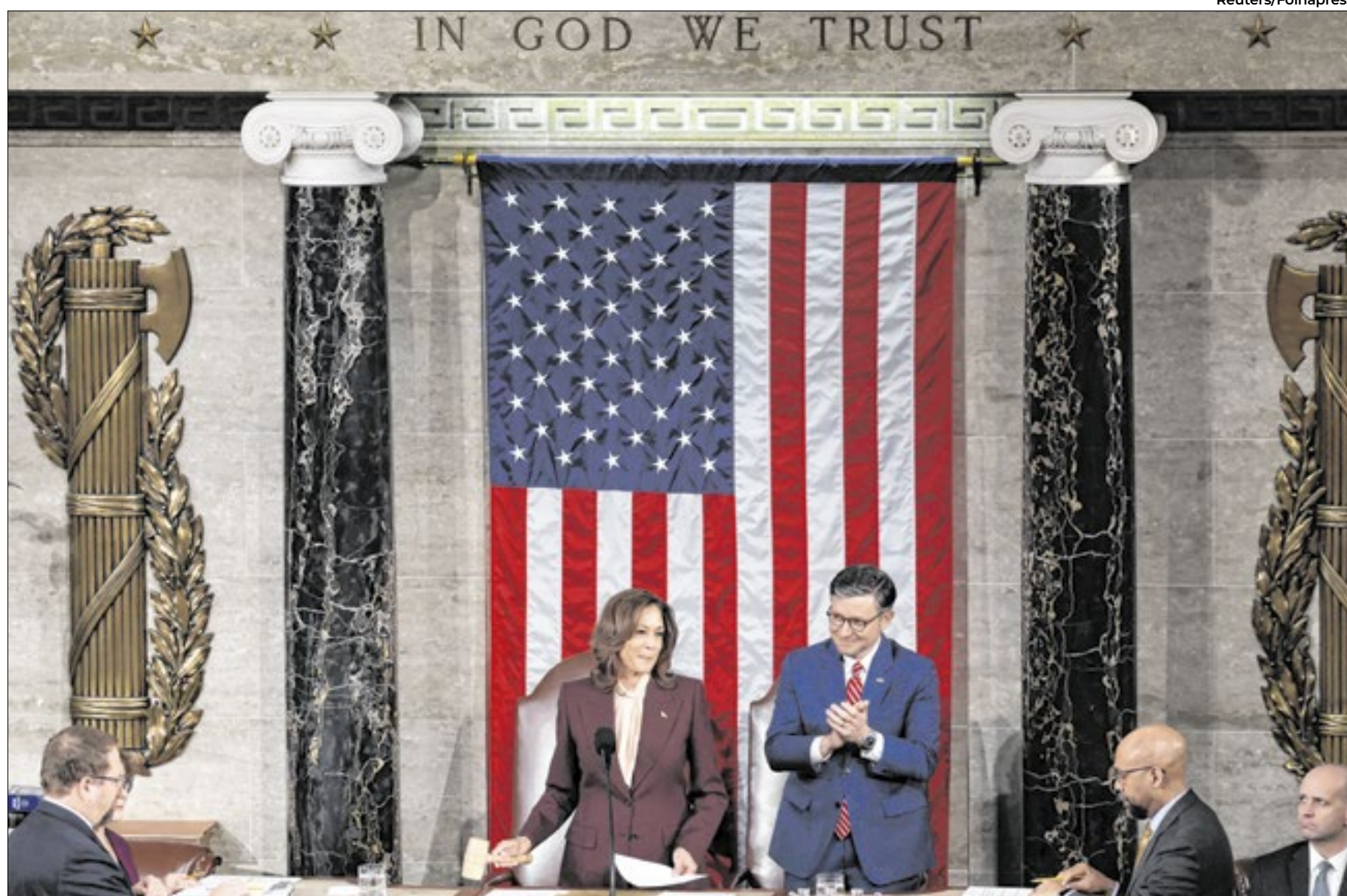
Sessão certificou vitória de Donald Trump como presidente dos Estados Unidos. Solenidade não conta com a presença do eleito

Na sessão, representantes do Congresso, a poucos metros de Kamala, anunciaram os votos dos delegados de cada estado. Um a um, eles disseram que o processo foi autêntico e sem qualquer irregularidade. Políticos republicanos aplaudiram os anúncios que declarava Trump vencedor,