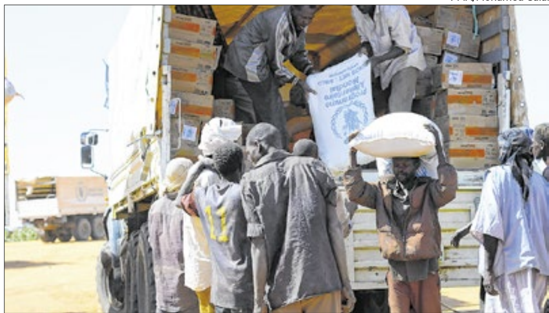
Ocha considera catastrófica a situação em El Fasher