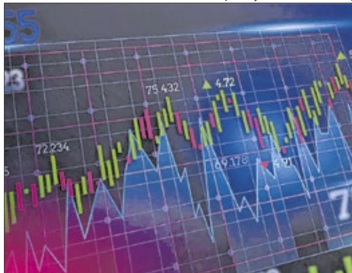
Recuos do dólar e de juros futuros acabam 'premiando' bolsa