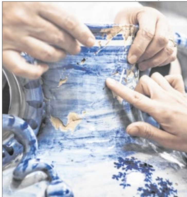
Peças destruídas estão sendo restauradas