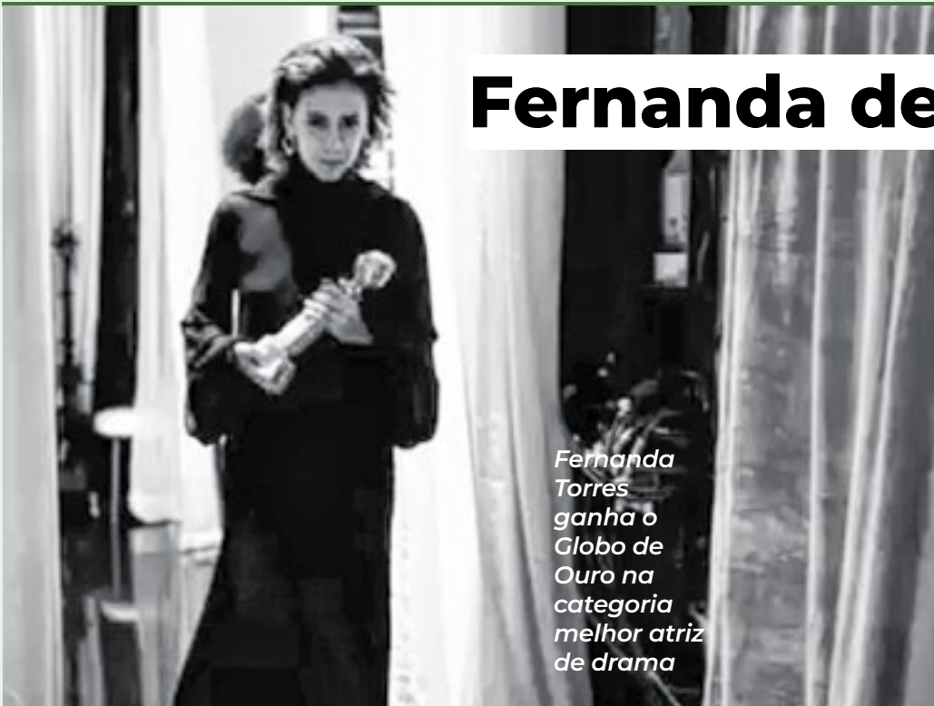
Fernanda Torres ganha o Globo de Ouro na categoria melhor atriz de drama

'Ainda Estou Aqui' consolida sua caminhada em direção ao Oscar. O longa de Walter Salles não levou o Globo de Ouro de Melhor Filme Estrangeiro, mas sua protagonista, Fernanda Torres, desbancou estrelas de Hollywood ao conquistar o prêmio de Melhor Atriz, encantando o Brasil e o mundo com uma atuação impressionante