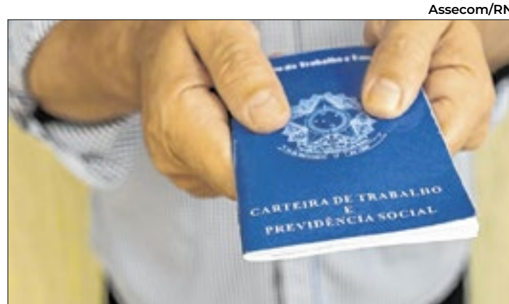
O saldo da geração de empregos foi positivo

O programa tem sido uma ferramenta valiosa para estimular a consciência ambiental e fortalecer a relação da sociedade com o meio ambiente. As mudas são distribuídas gratuitamente em feiras e eventos organizados pela Sema, além de serem entregues diretamente para projetos de restauração ambiental em áreas prioritárias.