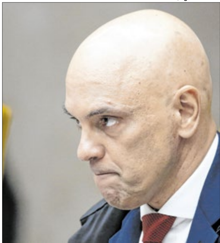
Alexandre de Moraes conduz inquérito dos atos antidemocráticos