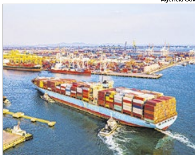
Saldo da balança comercial é o segundo maior da série