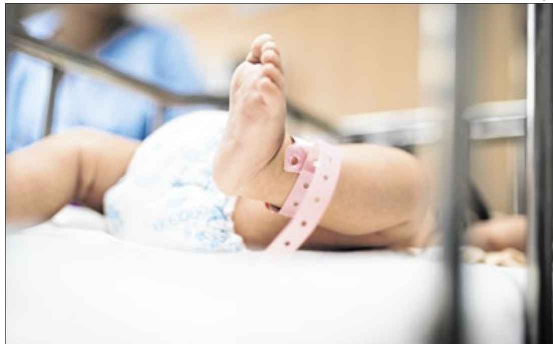
em 2023, quase 12% dos nascimentos no Brasil aconteceram antes do tempo ideal