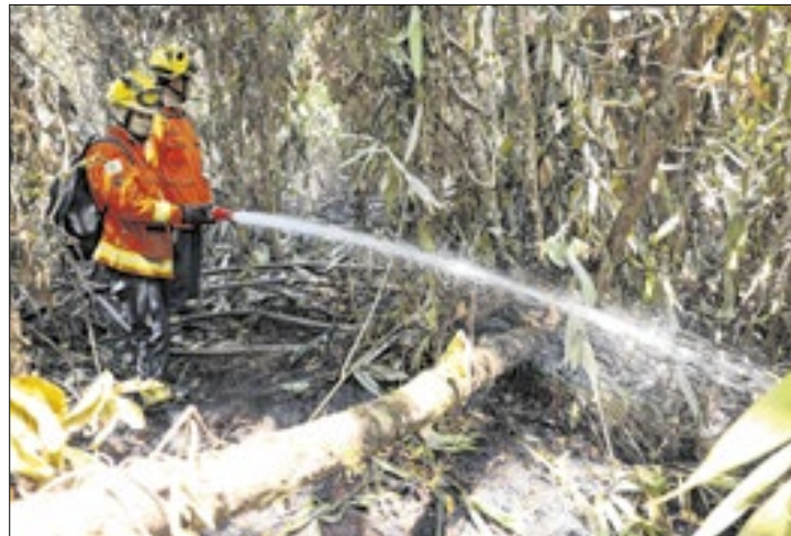
Ano com maior número de registros foi o de 2024

Dados da plataforma Terra-brasilis, do Instituto Nacional de Pesquisas Espaciais (Inpe), que concentra informações de satélite sobre cobertura vegetal, desmatamento e queimadas, indicam que o país teve 1 milhão de focos de queimada entre os anos de 2020 e 2024. Nesse intervalo, o ano com maior quantidade de registros foi justamente o de 2024, o que ocorreu, segundo o Ministério do Meio Ambiente e da Mudança do Clima (MMA), em razão de seca excepcional – segundo a pasta a pior nos últimos 74 anos.