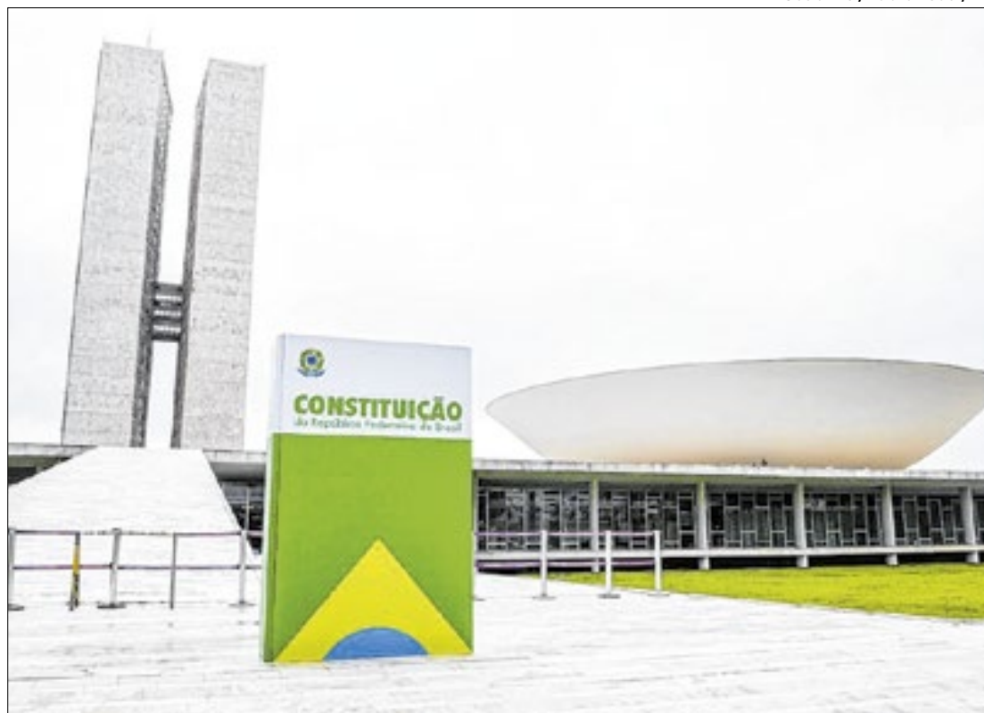
Réplica da Constituição Brasileira no Congresso Nacional

Lula também teria solicitado a presença de todos os ministros de governo e líderes partidários do Congresso na cerimônia, além do presidente da Câmara dos Deputados, Arthur Lira (PP-AL) e do presidente do Senado Federal Rodrigo Pacheco. Em uma tentativa de