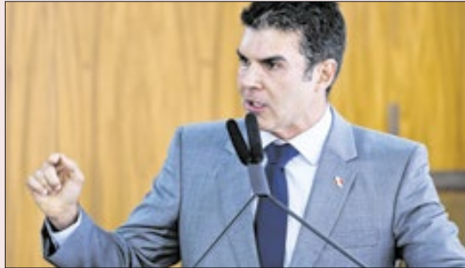
MDB ensaia exigir Helder como vice de Lula