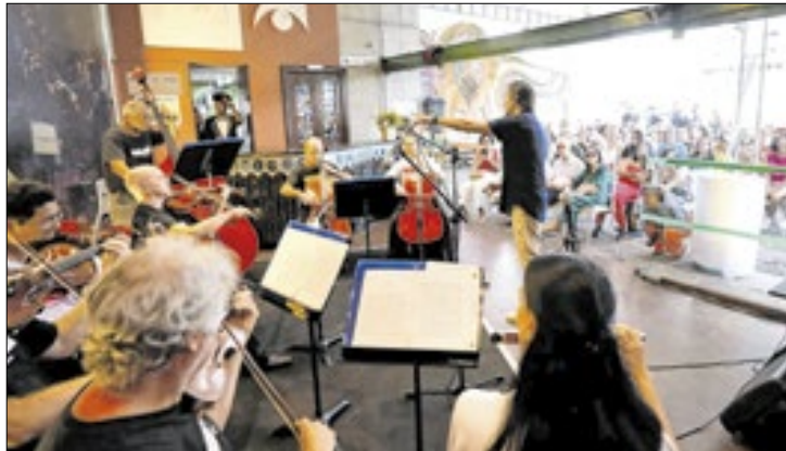
As apresentações acontecem todas as terças-feiras