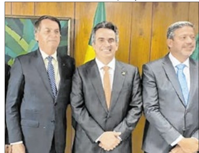
Aliados: Bolsonaro, Ciro Nogueira e Arthur Lira