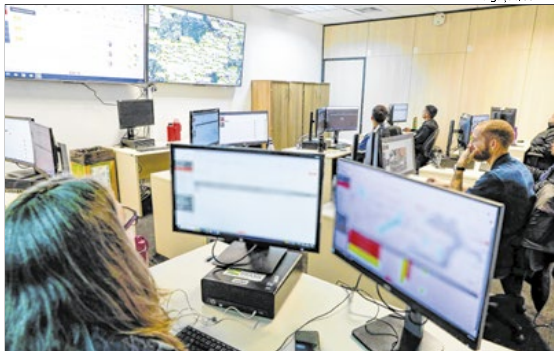
Servidores da SSPDF monitoram, simultaneamente, vítimas e agressores 24h por dia

Em 2024, o Dispositivo Móvel de Proteção à Pessoa (DMPP) emitiu mais de 13 mil alertas no Distrito Federal, auxiliando na segurança de mulheres protegidas por Medida Protetiva de Urgência (MPU). Segundo a Secretaria de Segurança Pública distrital (SSP-DF), a medida é ativada por decisão judicial, com monitoramento simultâneo de vítimas e também de agressores.