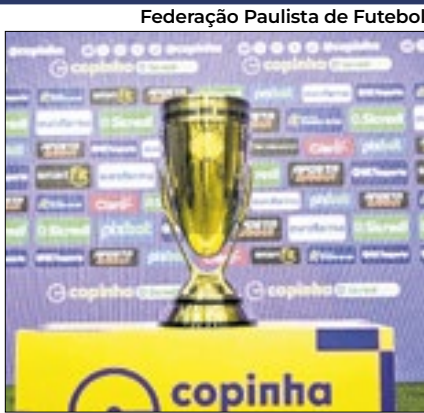
Campeonato tem estreantes

O futebol brasileiro começa, de fato, nesta quinta-feira (2). O dia será marcado por seis jogos da 1ª rodada da fase de grupos da Copinha -o maior torneio de futebol júnior do país. O campeonato tem estreantes, novo sistema de ingressos e um veto do governo. O torneio manteve o formato dos últimos anos: os 128 participantes foram divididos em 32 grupos com quatro clubes cada.