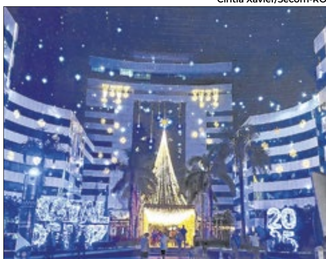
Palácio conta com túnel de LED e árvore gigante