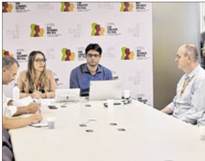
Representantes do governo detalham números