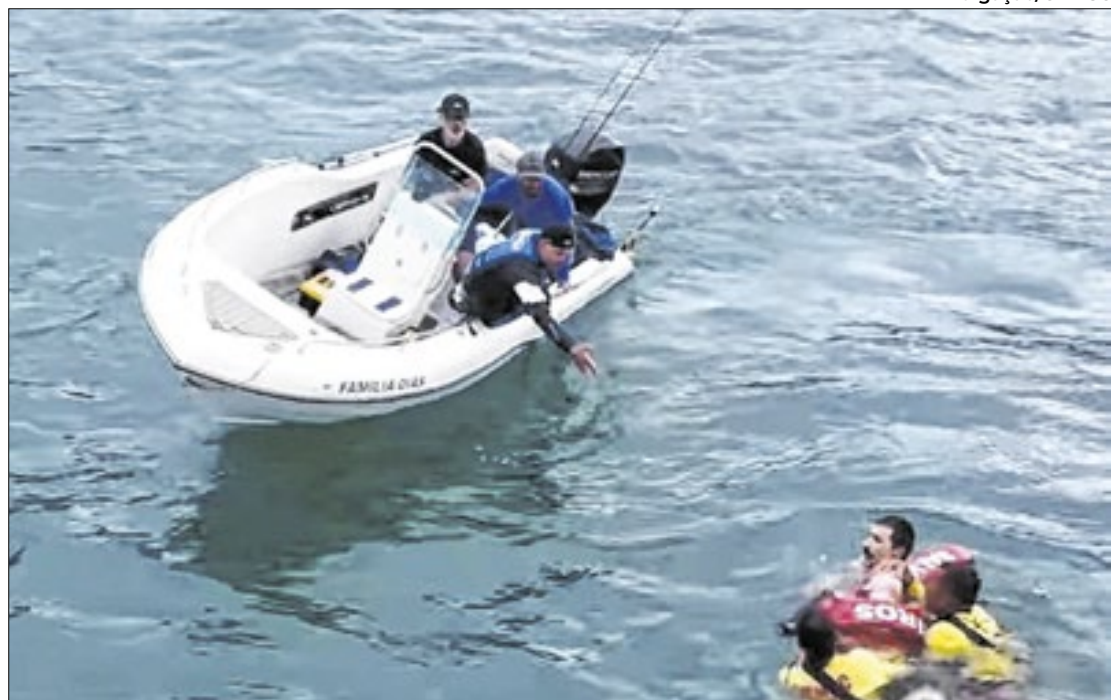
Aumento no número de salvamentos está em conformidade com o esperado

Atualmente, o CBMSC conta com um efetivo de quase 2 mil guarda-vidas distribuídos em 33 municípios, cobrindo 156 praias e balneários ao longo de 560 km de litoral. Diariamente, cerca de 470 bombeiros estão em ação no litoral catarinense, com o reforço de 96 bombeiros vindos do interior do estado. Além disso, ambulâncias auto-socorro de