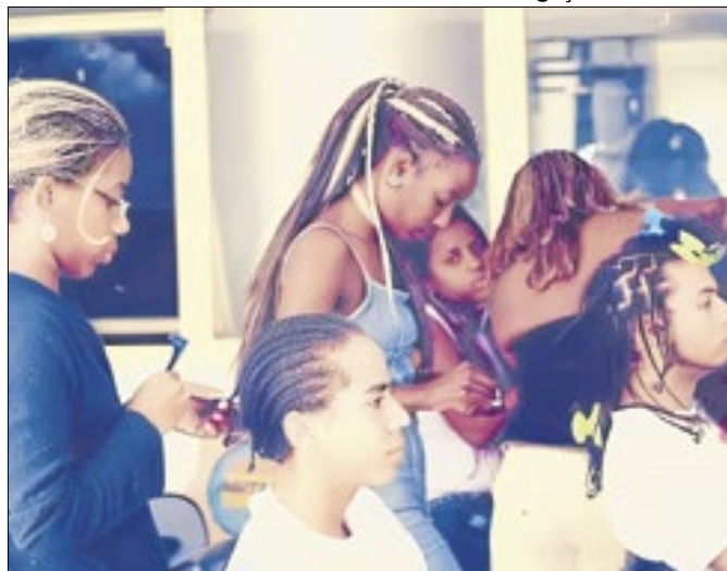
Projeto sobre a importância cultural das profissionais