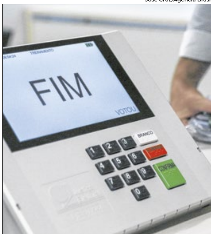
Medida vale para eleitores de 51 municípios

Além disso, a ausência injustificável do voto deixa o eleitor em débito com a Justiça Eleitoral. E com isso, o cidadão fica impedido de, por exemplo, emitir documentos (carteira de identidade ou passaporte); renovar matrícula em estabelecimento de ensino oficial ou fiscalizado pelo governo; ins-