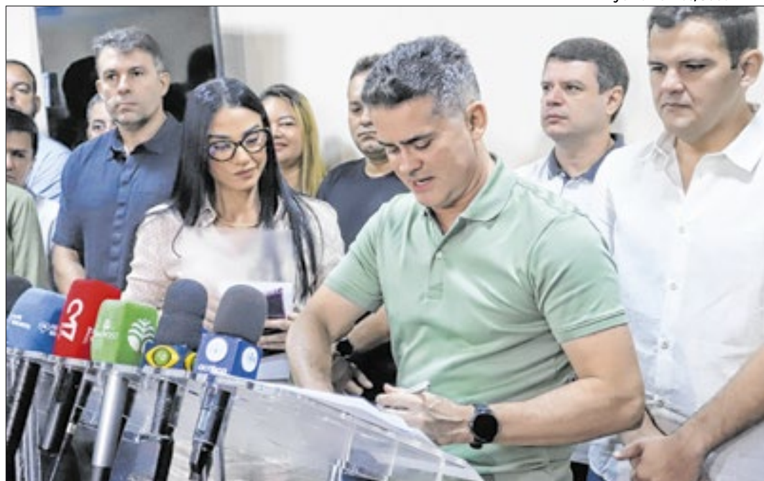
Em 2024, Manaus notificou 10.600 casos de dengue, com 2.636 confirmações e dois óbitos.

Segundo o LIRAA, Manaus possui um índice de infestação predial de 1,8%, classificado como médio risco, mas concentra áreas de alta vulnerabilidade, como Tarumã e Redenção.