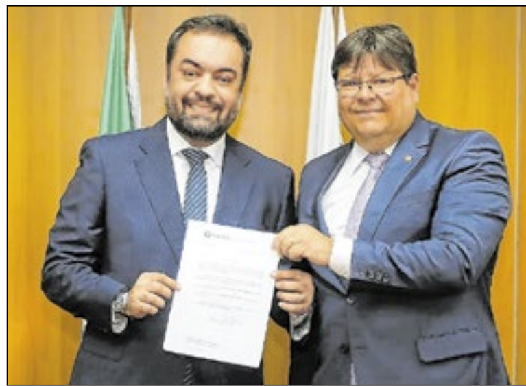
A escolha do nome aconteceu logo após o atual procurador-geral de Justiça, Luciano Mattos (d), entregar a lista tríplice ao governador Cláudio Castro (e)