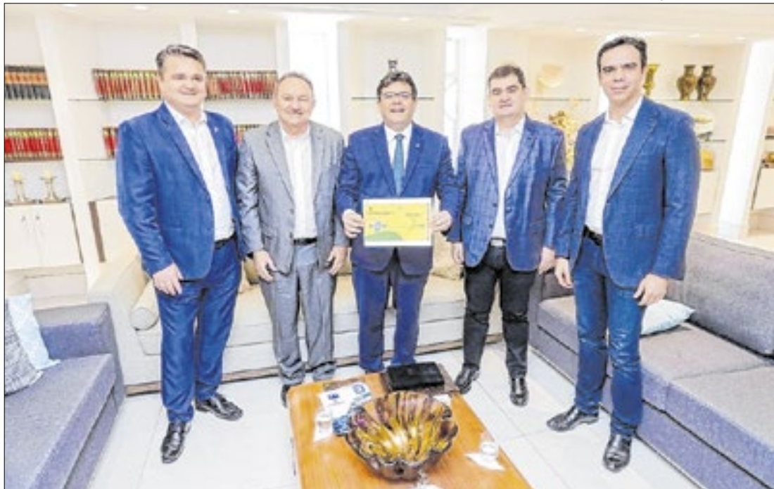
Parceria permitiu que o estado liderasse número de inscrições no Startup Nordeste 2024

O governo do Piauí e o Sebrae investiram R$ 3,9 milhões no Programa Startup Nordeste, uma iniciativa destinada a fomentar projetos inovadores com alto potencial de impacto social e econômico. As informações foram publicadas ontem (2) no portal do estado.