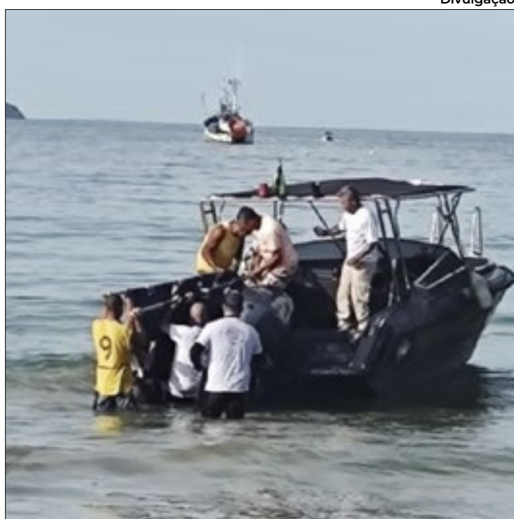
Golfinhos costumam aparecer na região de Ilha Grande, em Angra dos Reis, e são resgatados

À época, a infraestrutura era bastante limitada, mas ganhou força ao longo dos anos com a crescente demanda de brasileiros e estrangeiros. Isso fica bem visível na charmosa Vila do Abraão, o maior bairro da ilha, situado em seu lado leste. Principal ponto de chegada, a região concentra boa parte dos serviços disponíveis para turistas e moradores -há pousadas, restaurantes, lojas, agências, mas também escola e unidade de saúde.