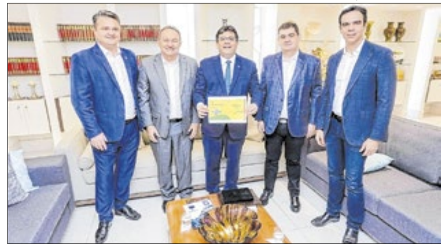
Parceria entre governo estadual e Sebrae promoveu inovação