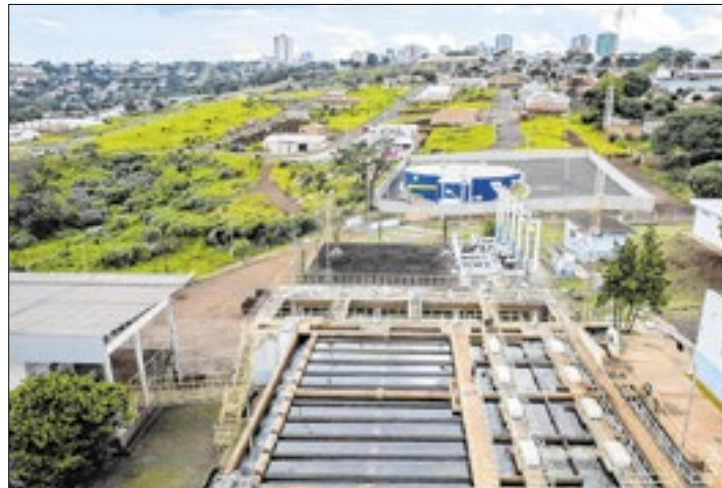
Região tem 61 empreendimentos de água e esgoto

A Companhia de Saneamento do Paraná (Sanepar) começa 2025 com números muito positivos na região Norte do Estado: 31 empreendimentos em andamento e 30 com licitação programada. Os investimentos somam cerca de R$ 730 milhões para projetos e obras de ampliações e melhorias nos sistemas de abastecimento de água e de esgotamento sanitário, além de implantações de sistemas de coleta e tratamento de esgoto completos e modernos em pequenas localidades.