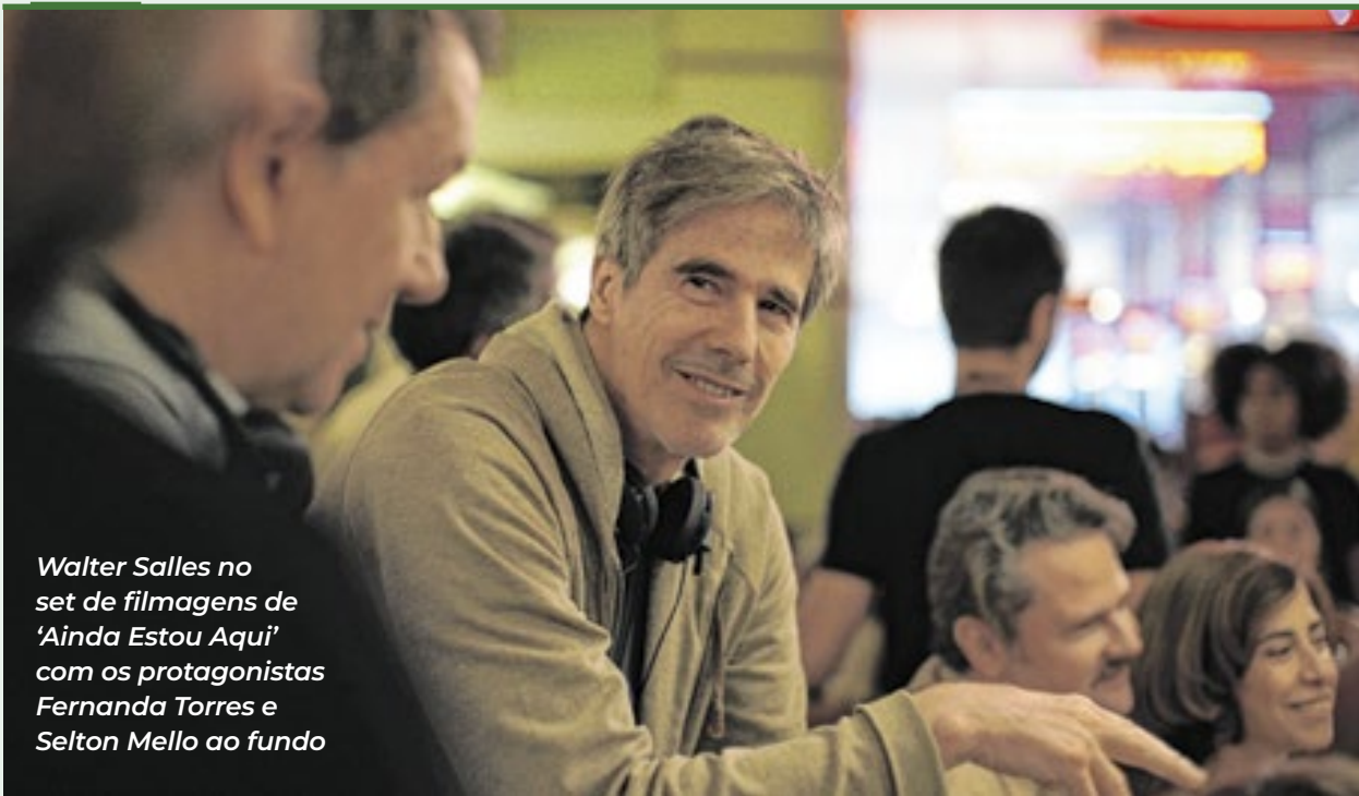
Walter Salles no set de filmagens de 'Ainda Estou Aqui' com os protagonistas Fernanda Torres e Selton Mello ao fundo