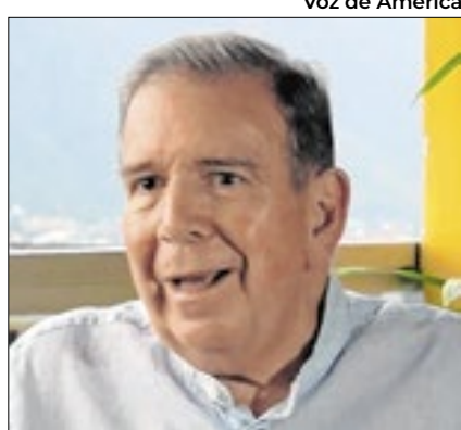
González em solo Argentino

A apenas uma semana da nova posse de Nicolás Maduro na Venezuela, o opositor Edmundo González, considerado o verdadeiro eleito, irá à Argentina. A viagem deve ocorrer entre essa sexta-feira (3) e esse sábado (4). Outros países da América do Sul também são cogitados para uma espécie de giro. O Brasil não está a princípio na lista do diplomata exilado em Madri.