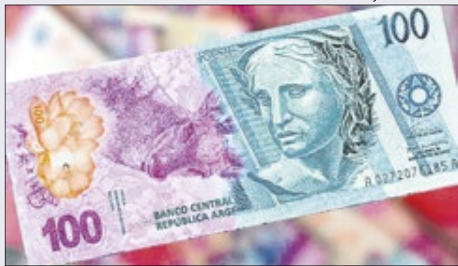
Ilustração site br104

Medidas ‘corajosas’ da Argentina ‘defenderam’ peso