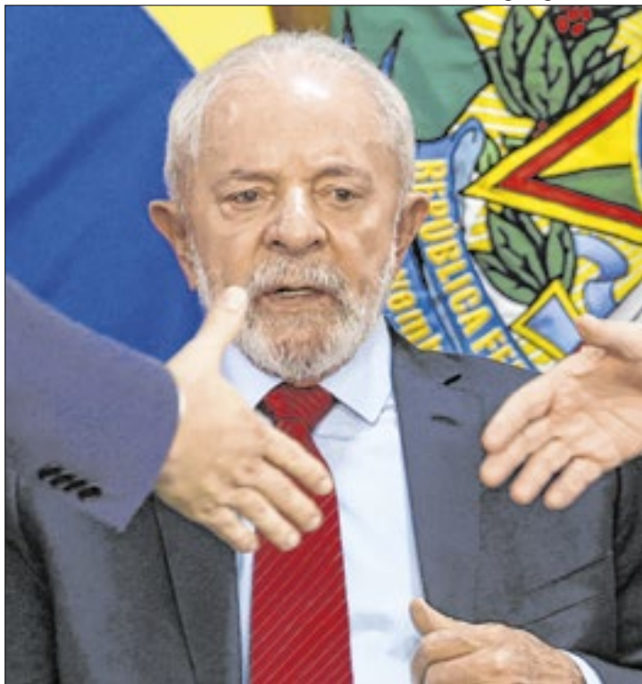
Mirando em eleições, Lula foca em reforma ministerial