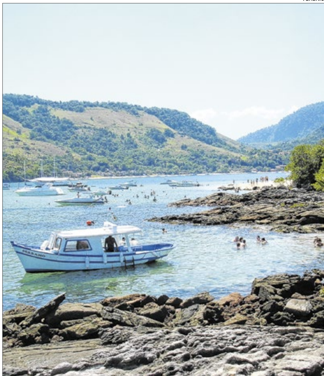
A ilha detém paisagens exuberantes e diversas opções de lazer

Perto do Abraão está a praia de Lopes Mendes, talvez a maior representante da beleza do local. Eleita como uma das melhores do Brasil por diversos rankings e lotada de boas avaliações em sites de turismo, é perfeita: extensa, com faixa de uma areia fina e clara, água cristalina e quente, mar agitado, mas raso por um bom trecho, possibilitando bons banhos. Chegar a ela, no entanto, exige caminhada por trilha ou transporte marítimo -como ocorre com muitas das atrações por ali.