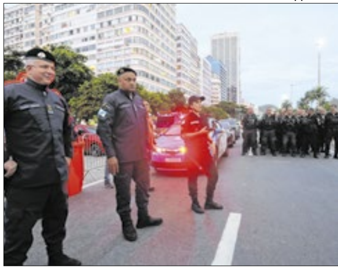
Réveillon carioca teve a segurança elogiada pelo Brasil