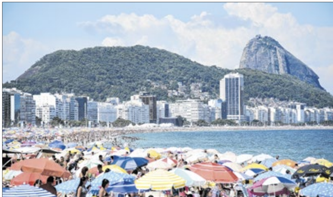
Brasil alcança marca de 6.621.376 visitantes estrangeiros

O Brasil bateu o recorde de turistas internacionais visitando o país. Ao todo, foram mais de 6,621 milhões de viajantes que escolheram destinos brasileiros para as viagens de lazer ou de negócios. Esse número supera o marco histórico de 2018, quando 6.621.376 estrangeiros estiveram por aqui. Com esse avanço, o Brasil se aproxima das metas do Plano Nacional de Turismo (PNT) que prevê atingir 8,1 milhões de turistas internacionais nos próximos três anos.