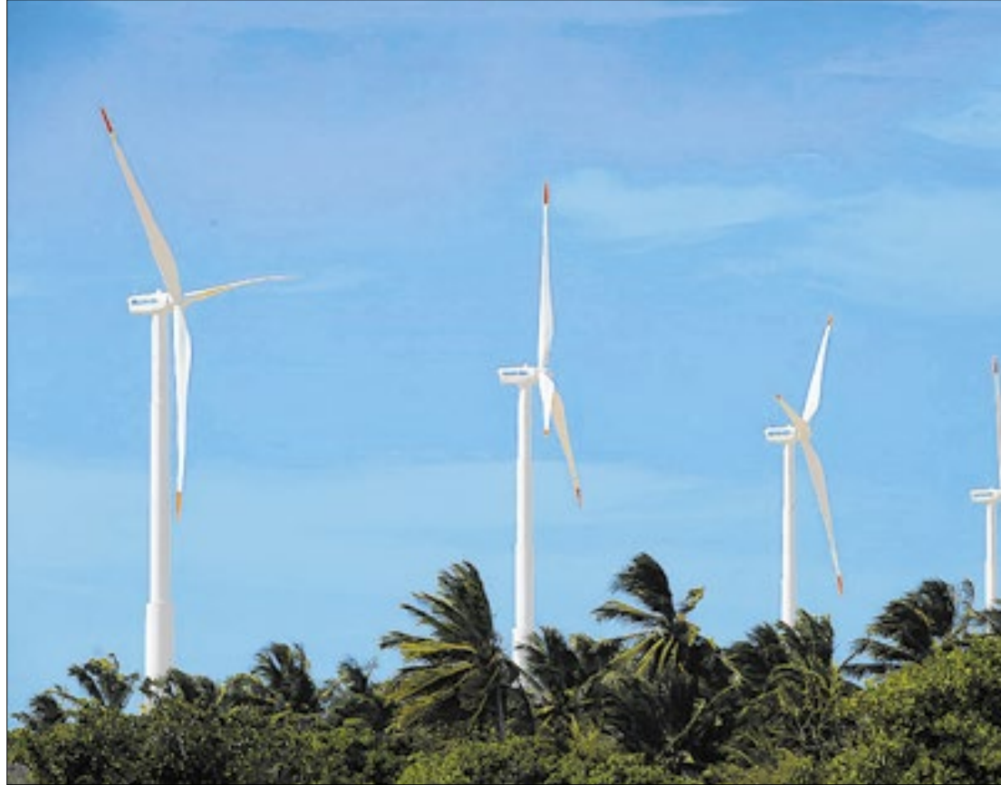
Estudo analisa o impacto dos projetos em cidades nordestinas apoiadas pelo FNDE

A pesquisa investigou os efeitos da construção de parques eólicos financiados pelo Fundo de Desenvolvimento do Nordeste (FDNE) em indicadores como mercado de trabalho, PIB per capita e Va-