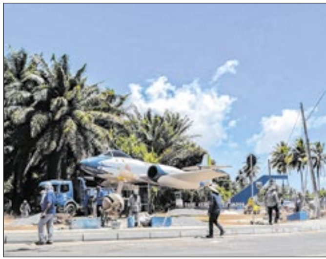
A praça está sendo construída ao redor do caça