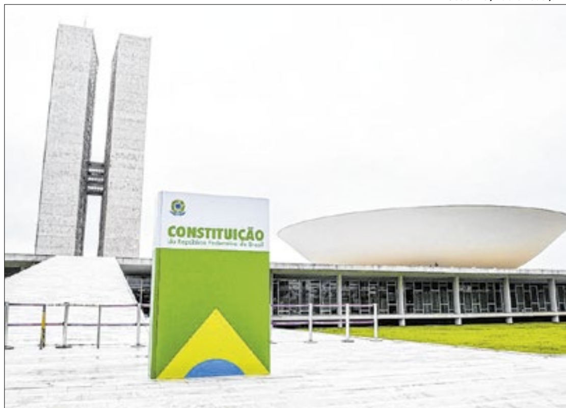
Réplica da Constituição Brasileira no Congresso Nacional

Lula também teria solicitado a presença de todos os ministros de governo e líderes partidários do Congresso na cerimônia, além do presidente da Câmara dos Deputados, Arthur Lira (PP-AL) e do presidente do Senado Federal Rodrigo Pacheco. Em uma tentativa de