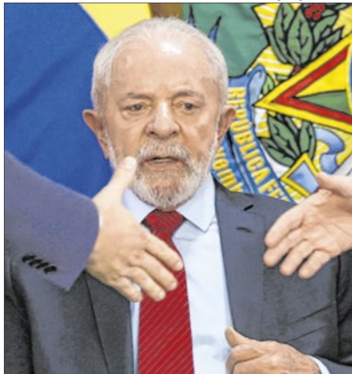
Mirando em eleições, Lula foca em reforma ministerial