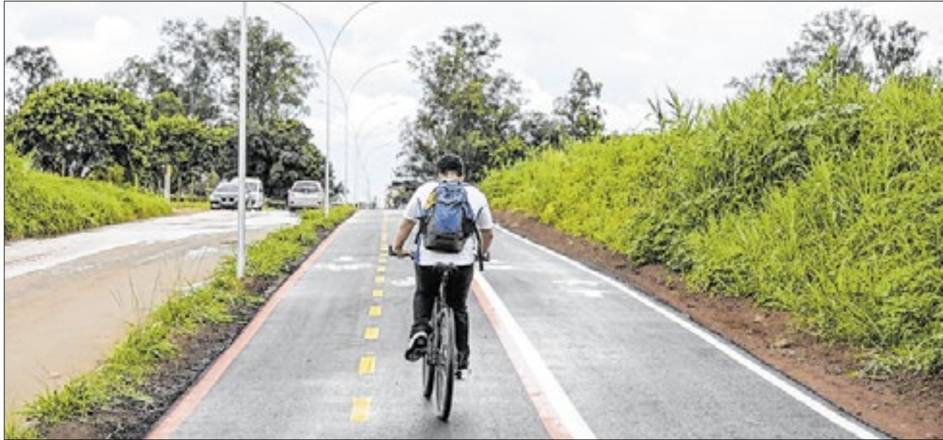
Uma das metas é alcançar mil quilômetros de ciclovias, somando as já existentes

O governo do Distrito Federal (GDF) pretende realizar obras em todas as 35 regiões administrativas em 2025, conforme anunciado na última quarta-feira (1º) pela Agência Brasília.