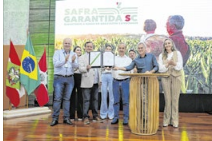
O ano foi marcado pelo Programa Leite Bom SC

O estado de Santa Catarina é campeão nacional na produção de carne suína, maçã, cebola, ostras, vieiras, mexilhões e pinhão. Neste ano bateu recorde na exportação de carne suína, com melhor resultado mensal de toda a série histórica, desde 1997. No acumulado de