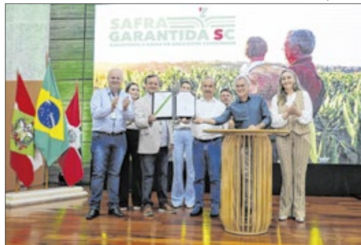
O ano foi marcado pelo Programa Leite Bom SC

O estado de Santa Catarina é campeão nacional na produção de carne suína, maçã, cebola, ostras, vieiras, mexilhões e pinhão. Neste ano bateu recorde na exportação de carne suína, com melhor resultado mensal de toda a série histórica, desde 1997. No acumulado de