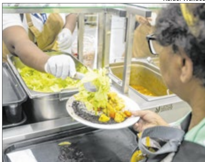
Rio de Janeiro oferece mais de 53 mil refeições diárias