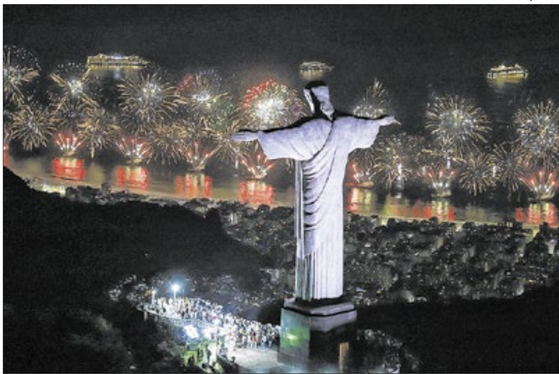
Réveillon 2024 na orla de Copacabana foi aproveitado do monumento do Cristo Redentor

O Réveillon 2025 deve movimentar R$ 3,2 bilhões na cidade do Rio, com a participação de cinco milhões de pessoas nos eventos espalhados pelo município. Somente em Copacabana, a estimativa é a de que 2,5 milhões de pessoas – entre cariocas e turistas – celebrem a virada do ano.