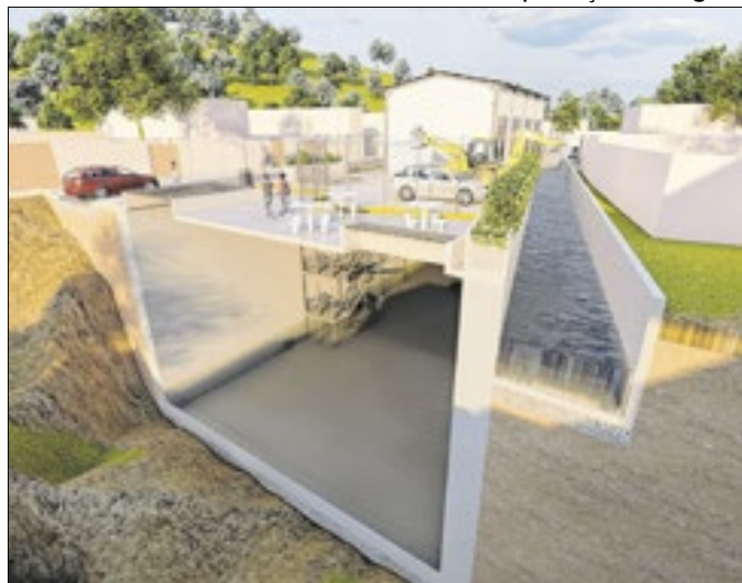
Projeto prevê construção de reservatório na Zona Oeste