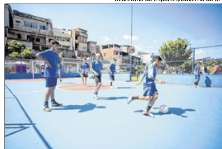
Lei Paulista dá melhores condições para praticar esportes

Um dos projetos que integram essa lista é a Escola de Goleiros Camisa 1, que recebe