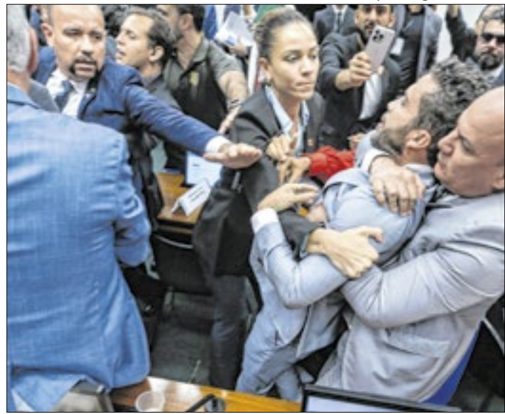
Um ano de confusões, brigas, cadeiradas. Em vários momentos, políticos partiram literalmente para a agressão física