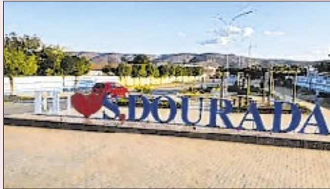
Serra Dourada: onde começou o escândalo há 34 anos