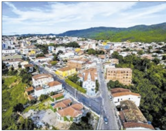
Campo Formoso: onde o asfalto se solta e derrete