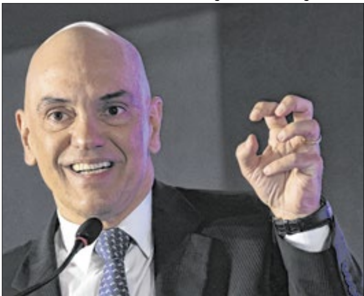
Responsável pelo inquérito dos atos antidemocráticos, Alexandre de Moraes endureceu: indiciou 40 por tentativa de golpe, incluindo Jair Bolsonaro, e prendeu Braga Netto