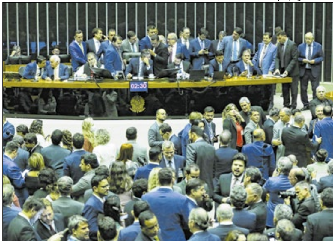
Projetos foram aprovados nos últimos dias antes do recesso

Foi vetado ainda o trecho que derrubava regras para reingressar no Bolsa Família. Segundo o governo, isso "contraria o interesse público, criando insegurança jurídica".