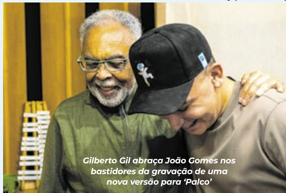
Gilberto Gil abraça João Gomes nos bastidores da gravação de uma nova versão para 'Palco'