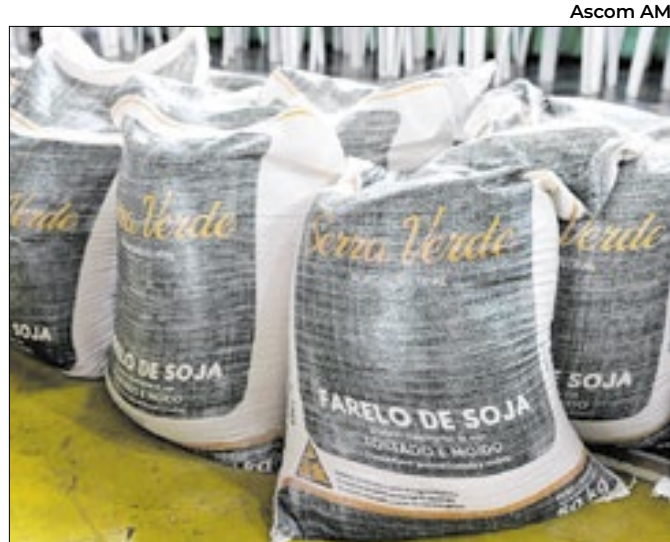
Ações são do Sistema Sepror e atendem produtores