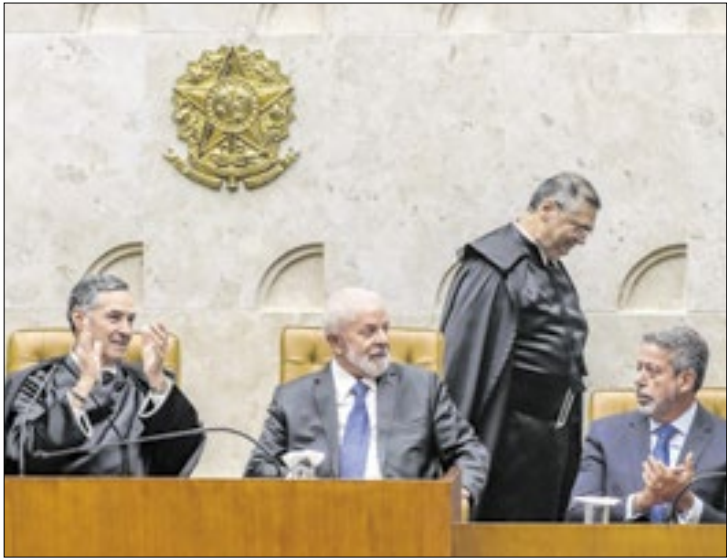
Crise entre os poderes termina com Dino como protagonista: bloqueio de R$ 4,2 bi em emendas