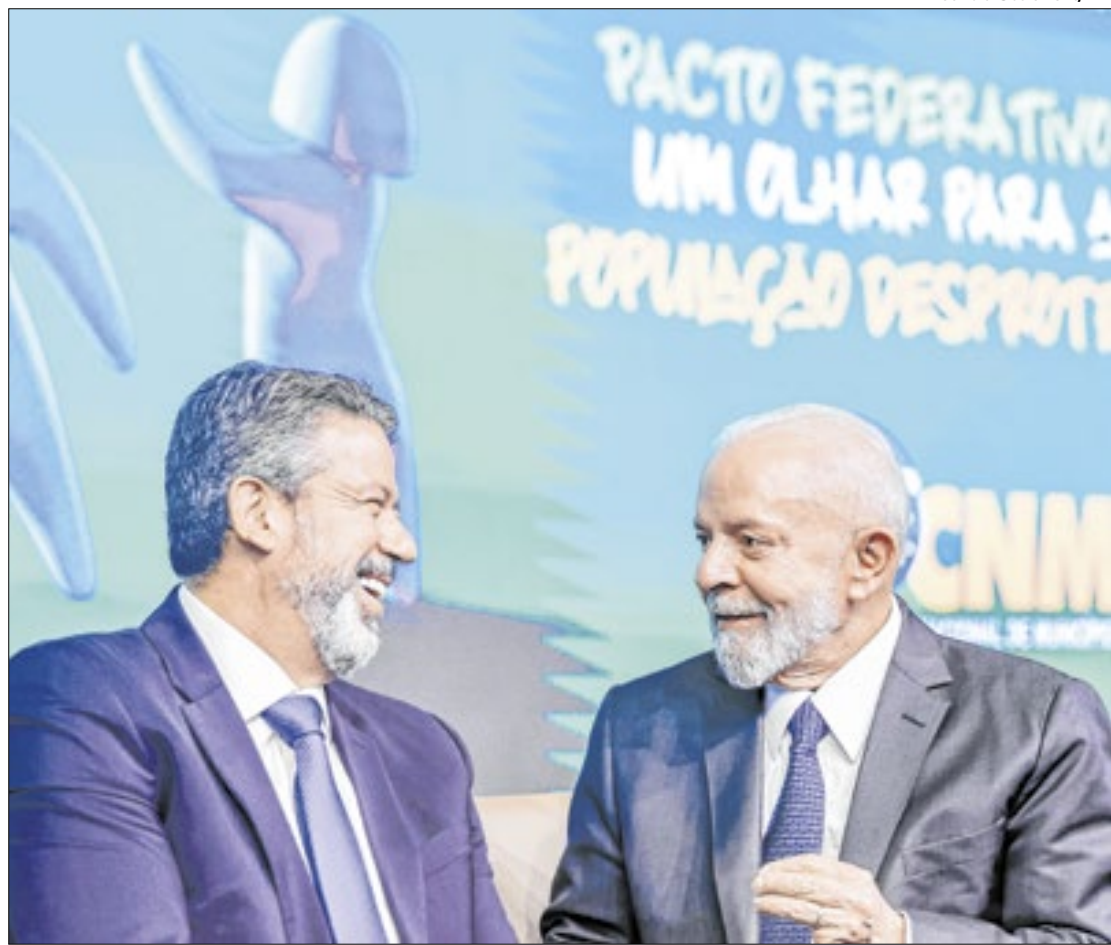
Lira: liberação das emendas teve aval do governo de Lula