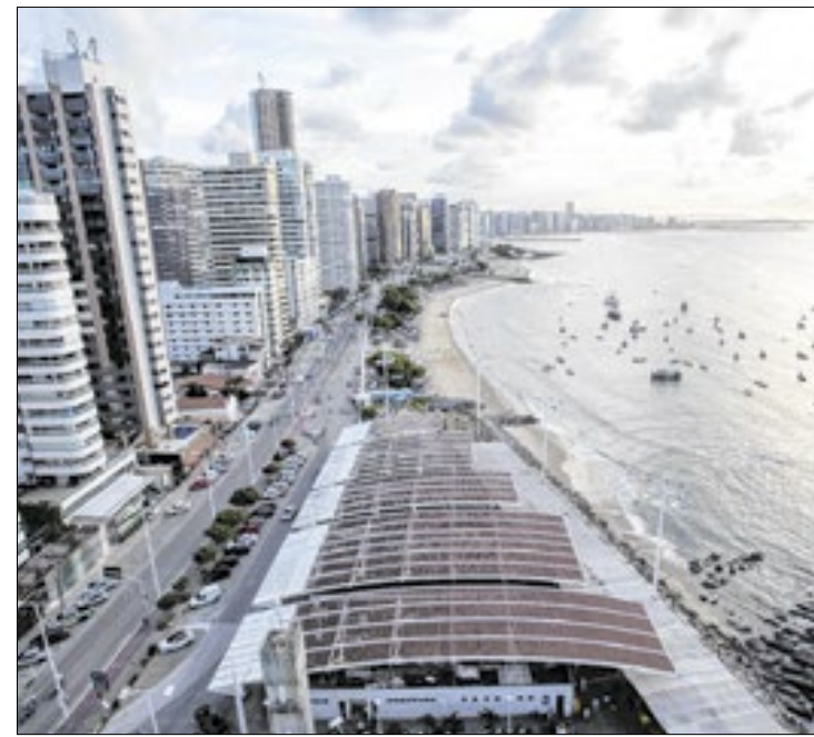
Fortaleza aparece à frente de Salvador no ranking