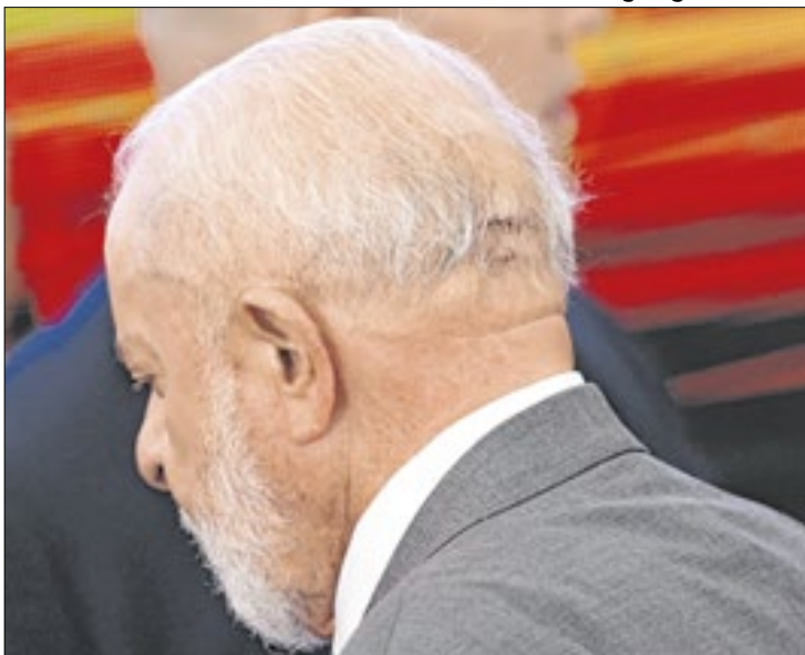
Lula teve que levar cinco pontos na parte de trás da cabeça após a queda que sofreu. Ele escorregou de um banquinho quando cortava as unhas