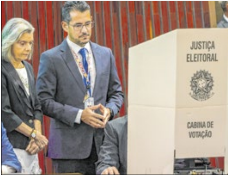
Cármen Lúcia presidiu TSE nas eleições municipais: 122 milhões de votos em 5,5 mil municípios