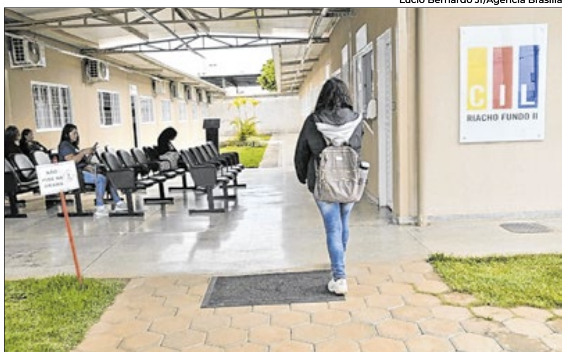
Centro oferece inglês, espanhol, francês e japonês

O candidato somente terá a matrícula efetivada mediante a entrega da documentação