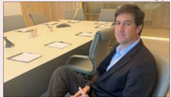
Giordano: pessoas decidiram aproveitar a vida