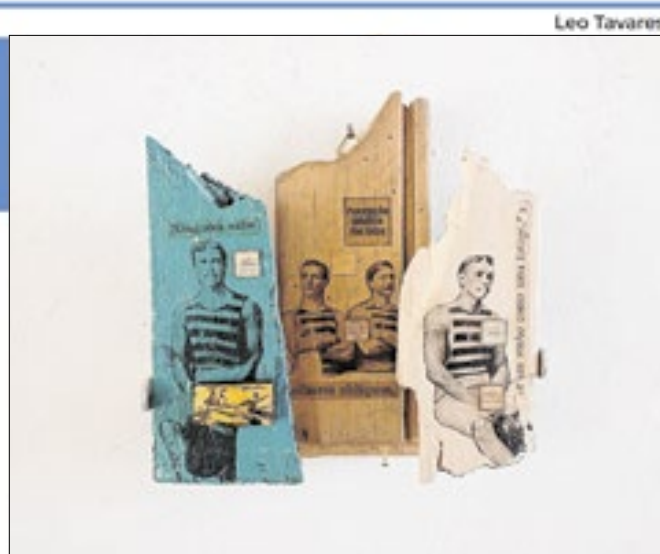
Obra: Uma história náutica - Assemblage - Tríptico

Além do corredor para o BRT, a Nova EPIG terá ciclovias, obras de drenagem, pavimentação, sinalização, paisagismo, calçadas e mobiliário urbano. Custo de toda a obra: R$ 160 milhões.