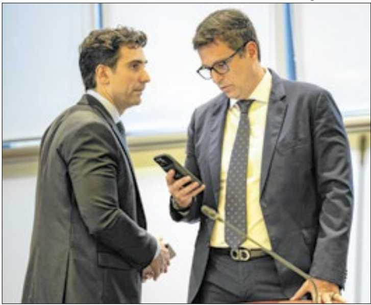
Sai Roberto Campos Neto e entra Gabriel Galipolo na presidência do Banco Central. Para conter a inflação, a taxa de juros terminou o ano fixada em 12,25%