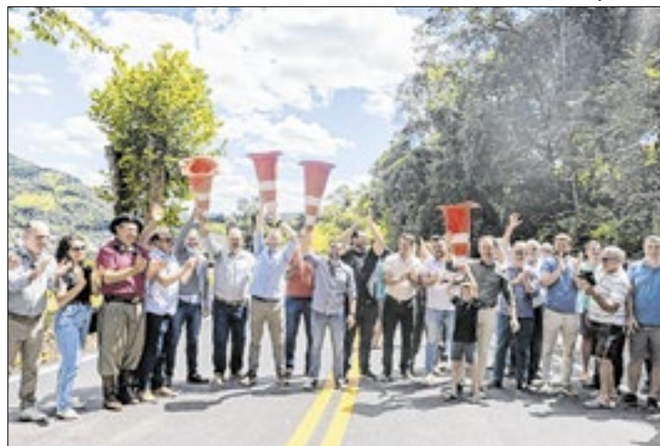
São mais de R$ 26 milhões em investimentos

Mais de R$ 26 milhões em obras viárias foram entregues nesta sexta-feira (27/12) pelo vice-governador Gabriel Souza. Os investimentos incluem a pavimentação de três ruas em Formigueiro e o recapeamento de cinco quilômetros da ERS-149 em Nova Palma, obra que consolida o acesso asfáltico a todos os municípios da região da Quarta Colônia.