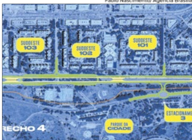
O trecho 4 prevê a construção de 2 viadutos e 4 passarelas, além da ligação com o Parque da Cidade