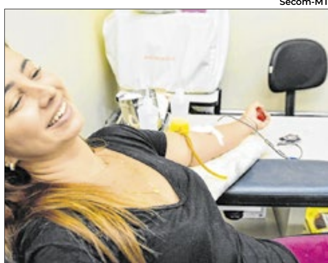
Unidade irá funcionar regularmente no fim do ano