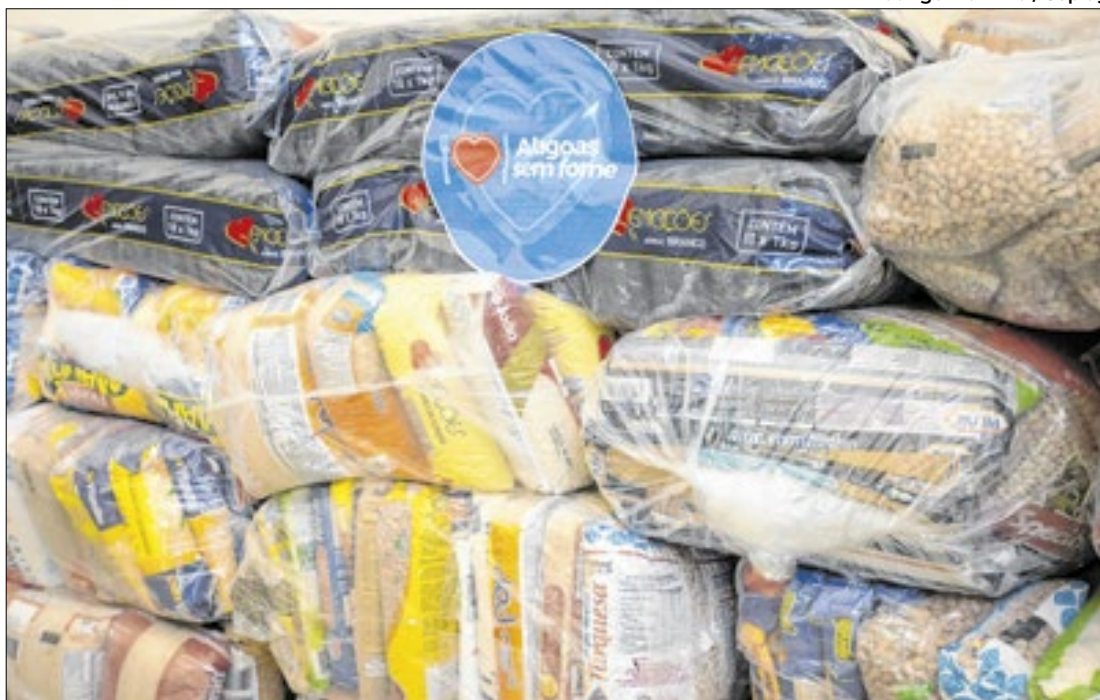
Rodrigo Marinho / Seplag

Iniciativa do governo une esforços de diversos setores da sociedade