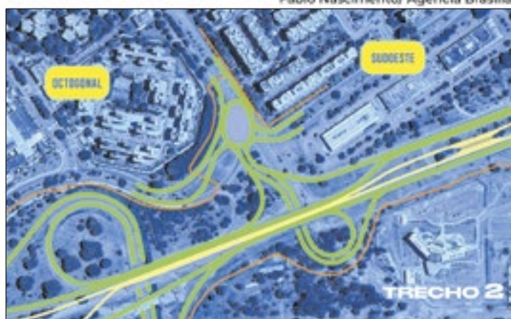
O trecho 2, que já conta com a rotatória e terá um viaduto liberado até o início do ano que vem