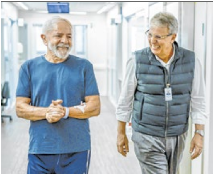
Lula deu um susto na nação. Depois de sofrer uma queda no Alvorada, o presidente teve de ser submetido a uma cirurgia de emergência para conter hemorragia craniana