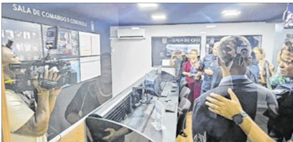
Nova sala de crise e monitoramento reforçará a segurança da orla entre o Leme e o Leblon, na Zona Sul da capital fluminense