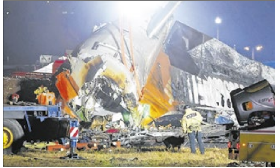
Avião da Jeju Air transportava 175 passageiros e seis tripulantes quando caiu na Coreia do Sul, gerando comoção no país inteiro

Em 1983, um caça soviético abateu um voo da Korean Air após ele ter se desviado para o espaço aéreo russo, matando todos