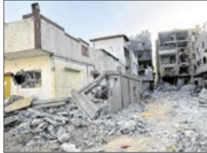
Gaza sem atendimento médico

O último grande centro de saúde em funcionamento no norte de Gaza, o Hospital Kamal Adwan, está fora de serviço, colocando em risco as vidas dos