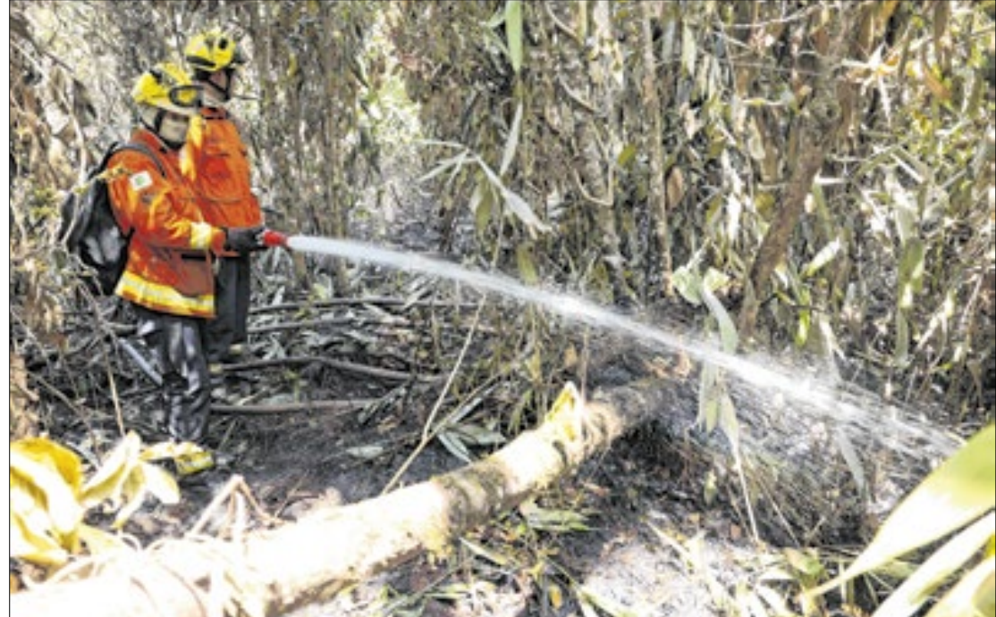
Segundo o levantamento, o Brasil teve 64.280 desastres climáticos desde 1990

Segundo os pesquisadores, para cada aumento de 0,1°C na temperatura média global do ar, ocorreram mais 360 desastres climáticos no Brasil. No oceano, para cada aumento de 0,1°C na temperatura média global da superfície oceânica,