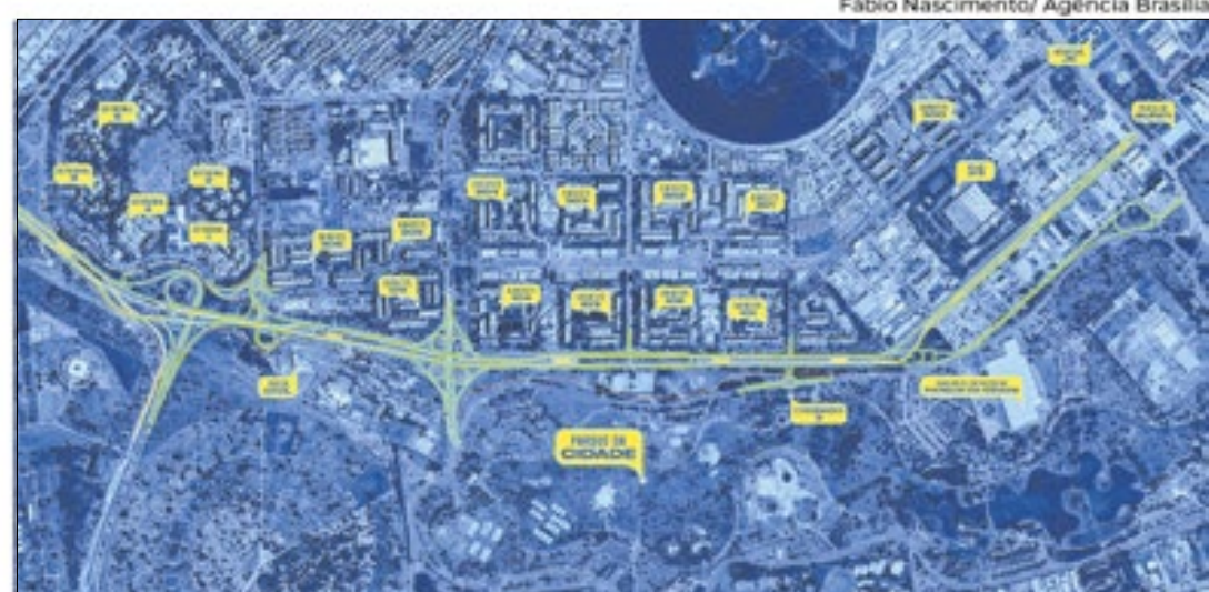
Toda a extensão da Nova EPIG, que vai do viaduto do SIA até o Eixo Monumental

No trecho 3 da nova EPIG, serão construídos mais 2 viadutos tipo trincheira, além de 4 passagens subterrâneas para pedestres