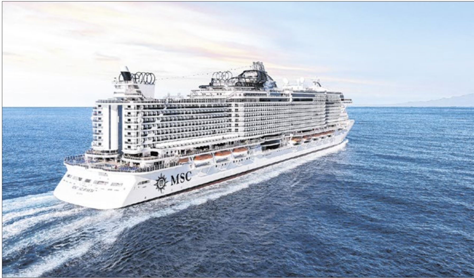
Entre os transatlânticos que compõem a temporada 2024/2025 no país, está o gigante e moderno MSC Seaview