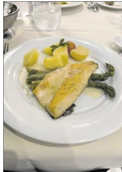
A boa gastronomia a bordo dos navios da MSC tem o padrão internacional das viagens da companhia