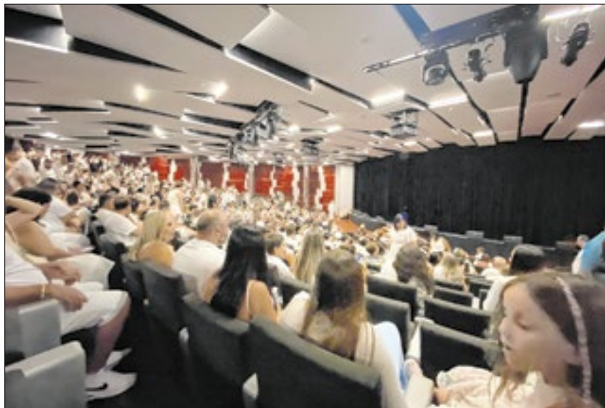
Entre os espaços públicos do navio, está o Teatro Metropolitan