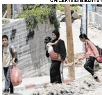
Situação humanitária deteriora

As Nações Unidas revelaram que as urgências humanitárias estão aumentando na Faixa de Gaza. A declaração é do subsecretário-geral dos Assuntos Humanitários, Tom Fletcher, que visitou a região. Segundo ele, mais de 100 pedidos de ajuda para Gaza teriam sido negados por Israel desde 6 de outubro. Fletcher contou que autoridades em Tel Aviv seguem emitindo ordens de evacuação.