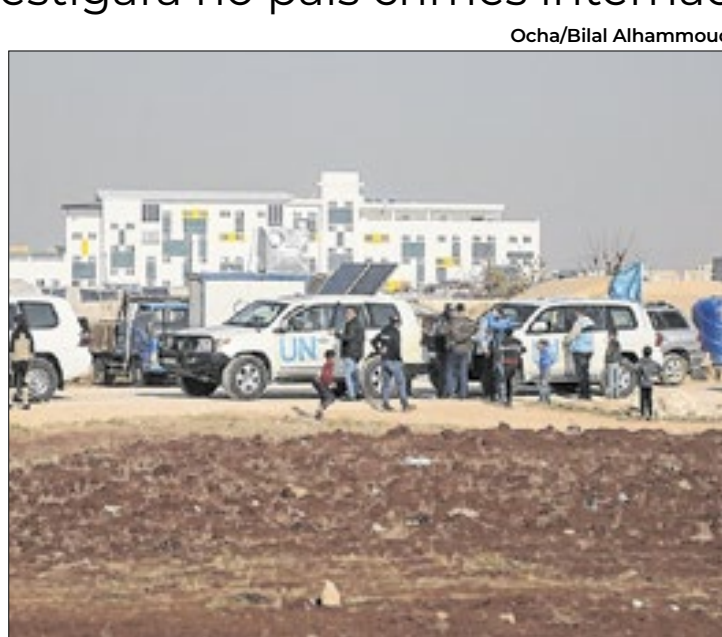
Veículos da ONU durante viagem por Aleppo, na Síria

Para o especialista, “a queda do regime do ex-presidente sírio, Bashar al-Assad representa uma oportunidade significativa” para o cumprimento do mandato do Iiim.