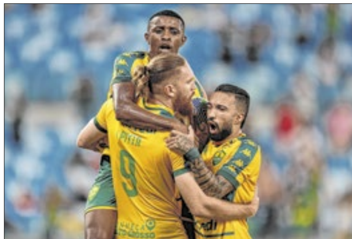
Clube disputará a série B do Brasileiro em 2025

Em 2003, o Dourado iniciou suas atividades profissionais e, em sua temporada de estreia, conquistou o Campeonato Mato-Grossense. O troféu seria o primeiro de 12 títulos do Estadual (2003, 2004, 2011, 2013, 2014, 2015, 2017, 2018, 2019, 2021, 2022 e 2023). Ainda nesse ano, a equipe partici-