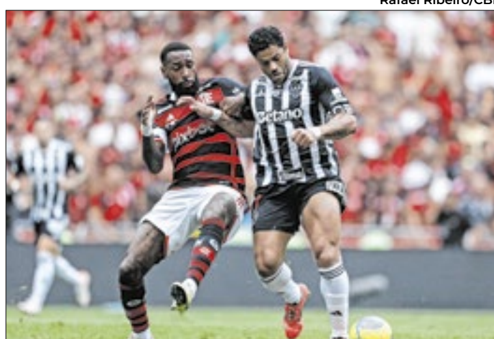
Fla está na liderança do ranking e Galo é o 5º

O Rubro-Negro carioca está à frente do São Paulo, com 14.832 pontos, e do Palmeiras, que tem 14.536 pontos. Estão atrás da dupla paulista o Corinthians, com 13.802 pontos e o Atlético-MG, que soma 13.713.