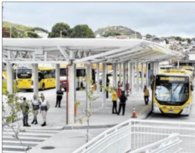
Terminal tem 18,3 mil m² e integra ônibus comuns e vans