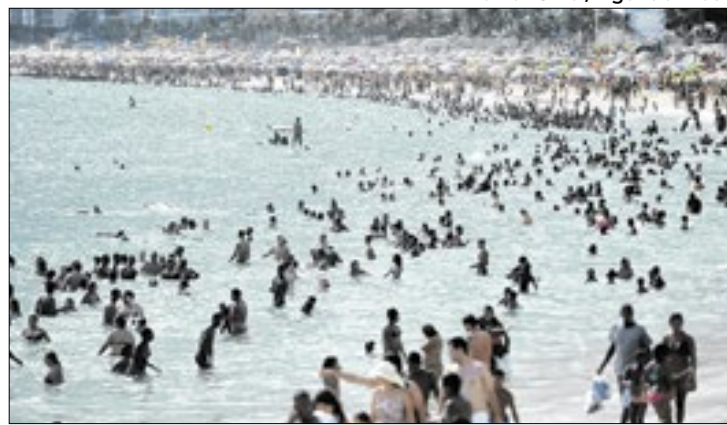
Previsões indicam chuvas abaixo da média nos estados