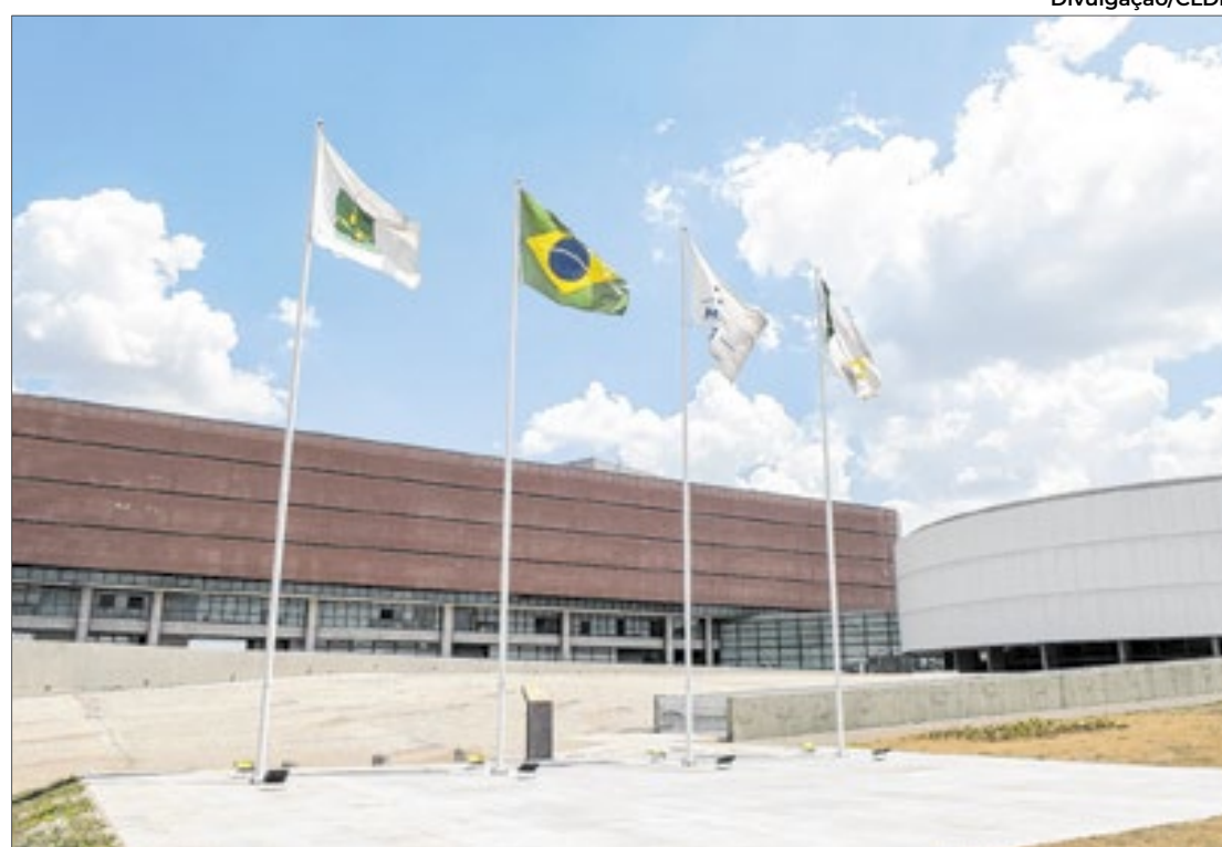
Câmara melhorou sua produtividade em 2024

“A Câmara foi escolhida, pelo terceiro ano consecutivo, o Legislativo mais transparente do país. Dessa vez, tivemos nota máxima, o que demonstra o compromisso dos nossos deputados”.