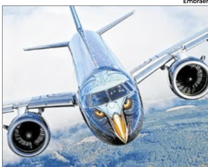
Orgulho da aeronáutica pátria, Embraer brilha na bolsa