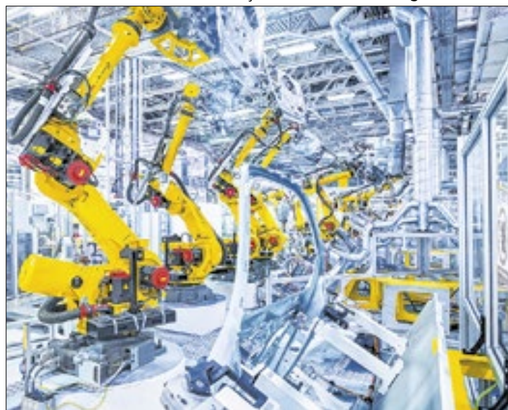
Produção de alta tecnologia superou a da indústria tradicional

No caso brasileiro, a divisão é composta por quatro