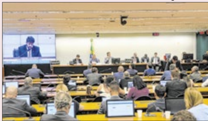
Comissão de Orçamento: R$ 50 bi em emendas