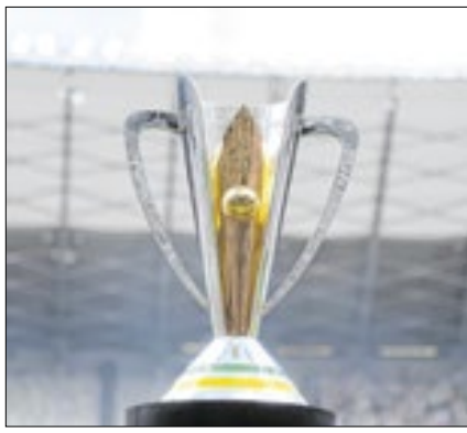
Competição acontecerá em Belém

A Globo assegurou a exclusividade dos direitos de transmissão da Supercopa Rei pelos próximos três anos, de 2025 a 2027, em todas as suas plataformas. O