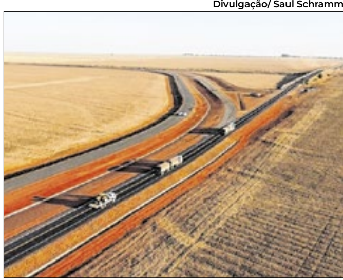
Contorno rodoviário feito em Chapadão do Sul