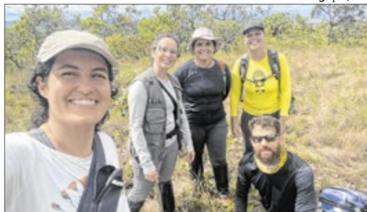
Equipes do JBB percorreram regiões de Goiás