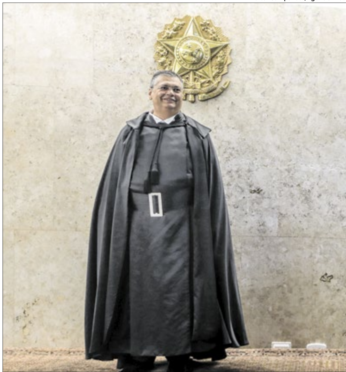
Dino: investigação pode chegar em Lira

Uma reação de Dino e do STF já era esperada desde que o governo cedeu e liberou as emendas no curso das negociações para aprovar o pacote de corte de gastos na semana passada. Era, porém, esperado, que