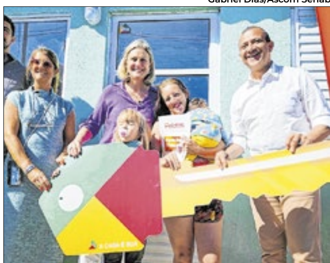
Programa prevê investimento de R$ 139,2 milhões