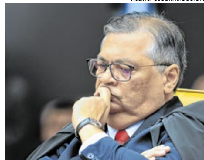
Ministro do STF suspendeu emendas e acionou PF