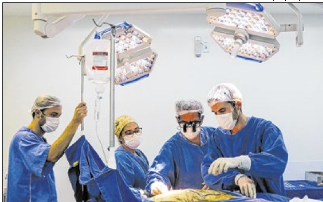
O Estado chegou a 150 unidades participantes do programa

O programa, lançado pelo Governo do Estado no final de 2023, atualizou parâmetros que permitiu a inclusão de novos hospitais e a ampliação de serviços. Com a alteração dos