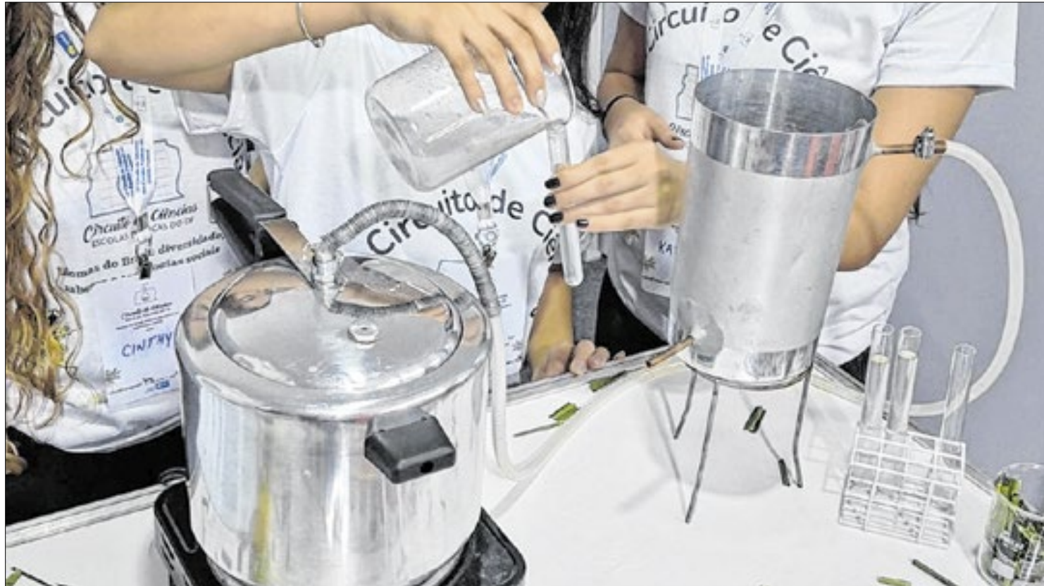
Panela de pressão e tubos: trabalho dos estudantes venceu prêmio entre as escolas do DF

“Foi um projeto que se iniciou a partir de ideias, que foram aperfeiçoadas e chegou no ponto de materializar as sugestões. Estou muito feliz com os resultados e reconhecimento que tivemos. Os meninos se comprometeram e abraçaram todo o processo, desde a pesquisa, plantio, colheita e preparação do material. Eu posso afirmar que nós ensinamos, mas