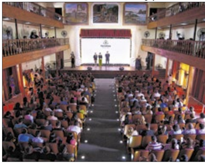
A iniciativa capacita profissionais e geração de emprego