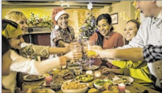
Atitude 'solidária' é opção para dividir custos da ceia