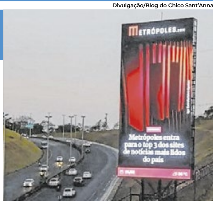
Painel de LED gigante, instalado na subida da Ponte JK, deveria ter sido desligado em 24 horas, segundo a Justiça

Também fica de fora, por exemplo, a sequência estrambólica de