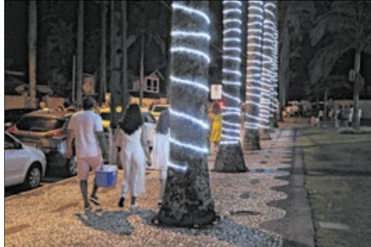
Eventos integram calendário da Secretaria do Turismo

Curitiba, Maringá, Londrina, Guarapuava, Foz do Iguaçu e Porto Rico são boas indicações de municípios para acom-