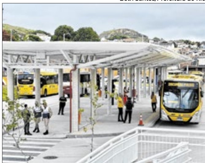
Terminal tem 18,3 mil m 2 e integra ônibus comuns e vans