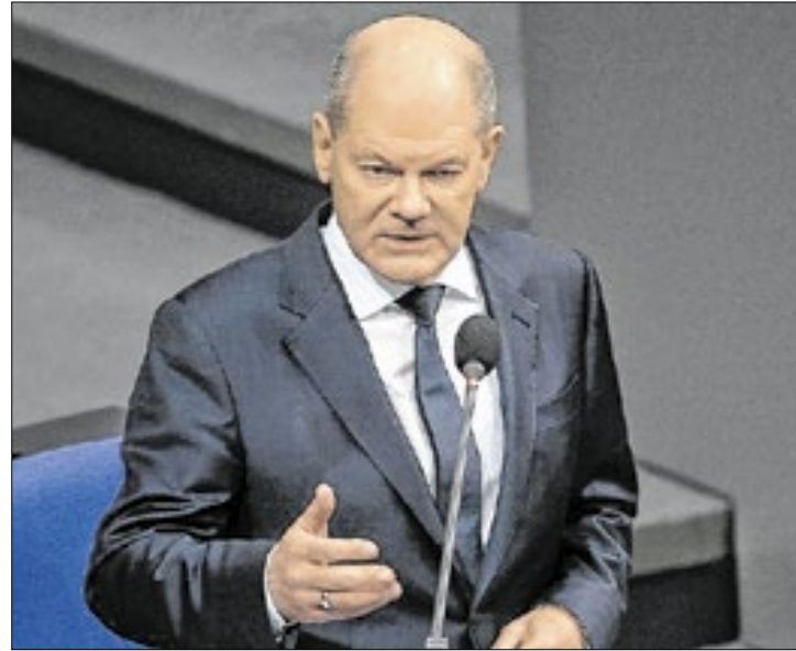
Governo Federal/Guido Bergmann

O ataque aconteceu na sexta-feira, dia 20, quando cinco pessoas morreram e mais de 200 ficaram feridas, sendo que 40 estão em estado grave. Entre as vítimas fatais, foram identificados como um menino de 9 anos e 4 mulheres de 52, 45, 75 e 67 anos. O mercado de Magdeburgo foi fechado e Berlim aumentou a presença policial