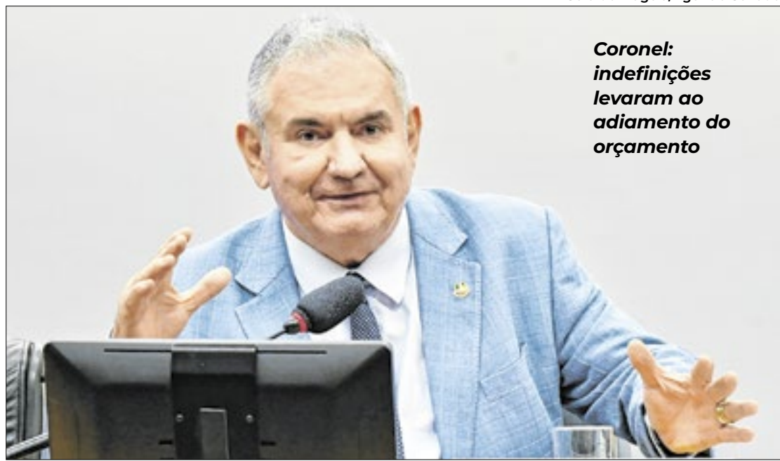
Coronel: indefinições levaram ao adiamento do orçamento

O pacote de corte de gastos foi concluído na última sexta-feira (20), com a promulgação da Emenda Constitucional 135, que busca reduzir as despesas obrigatórias do Poder Executivo. Além disso, foram aprovados os outros dois projetos que compõem a medida fiscal: