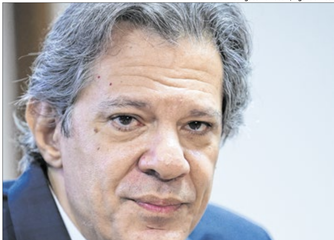
Haddad estimou uma perda de R$ 1 bi com mudanças do Congresso

No mesmo dia, em café da manhã com jornalistas para apresentar o balanço anual da