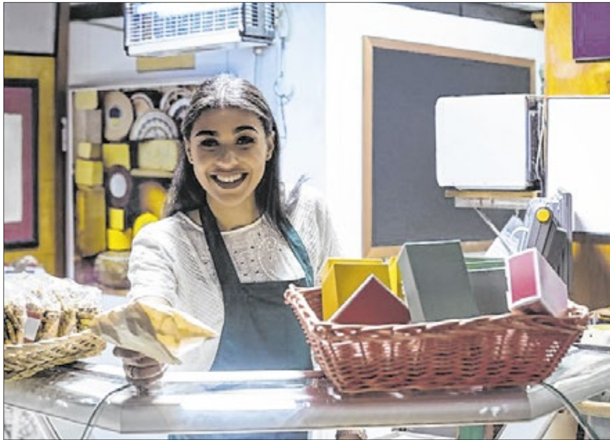
O Nordeste aparece como a terceira região que mais abriu pequenos negócios

de 2024 com os de 2023, a Sudene observou crescimento em todos os estados, com destaque para Sergipe, que registrou a segunda maior variação (12,5%), e Pernambuco, que ficou em sétimo lugar, com uma variação de 9,3%. A análise também revela um desequilíbrio regional, evidenciado pelo fato de que o município de São Paulo, no mês de novembro, abriu mais negócios do que Sergipe e Piauí juntos no acumulado de 11 meses (33.474 contra 25.290