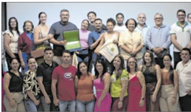
A região se destaca nas políticas de igualdade racial