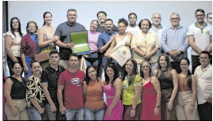
A região se destaca nas políticas de igualdade racial