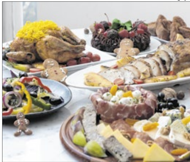
Moderação e equilíbrio são os pilares para as festas

As festas de fim de ano são marcadas por momentos de celebração, fartura à mesa e reuniões com amigos e familiares. Porém, é importante prestar atenção aos excessos alimentares e no consumo de bebidas alcoólicas, que podem causar desconfortos no curto prazo e, a longo prazo, até comprometer a saúde, caso os exageros se transformem em hábitos frequentes.