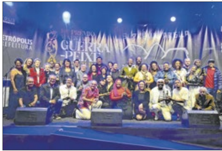
Prêmio é promovido pela Prefeitura desde 2009

A Prefeitura, por meio do Instituto Municipal de Cultura (IMC), premiou os vencedores do 14º Prêmio Guerra-Peixe de Cultura, o mais importante reconhecimento cultural da cidade e da Região Serrana. A cerimônia de entrega aconteceu na terça-feira (17), no Palácio de Cristal, como parte da programação do Natal Imperial.