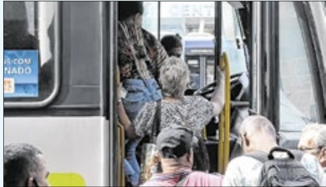
Descumprimento de medida sujeita empresas a multas