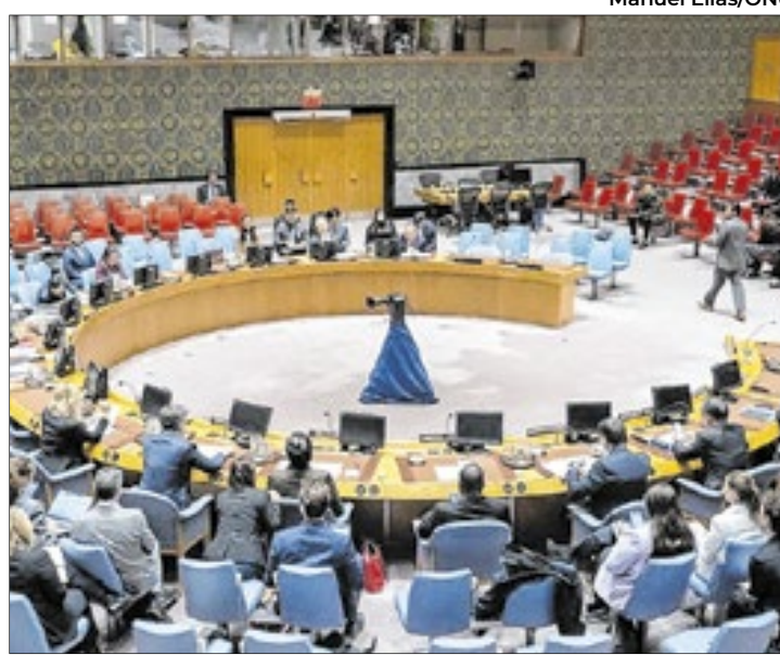
Conselho de Segurança debate a questão na Síria