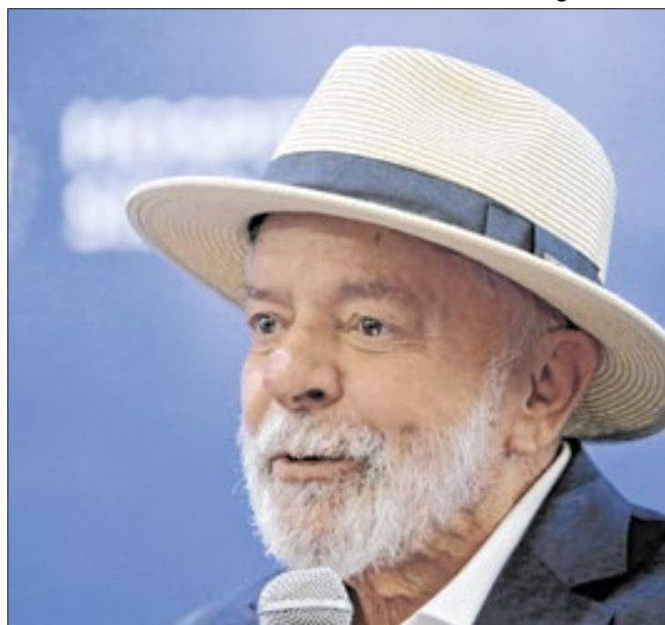
País segue dividido quanto ao apoio a Lula

No mesmo período, a avaliação do governo do ex-presidente Jair Bolsonaro era semelhante, embora levemente superior. Bolsonaro tinha 37% de aprovação e 32% de reprovação.