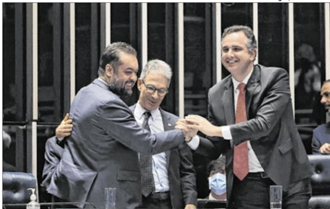
Castro e Zema comemoram aprovação com Pacheco

O projeto aprovado também altera as condições finan-