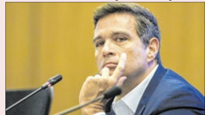
Roberto Campos Neto, presidente do BC