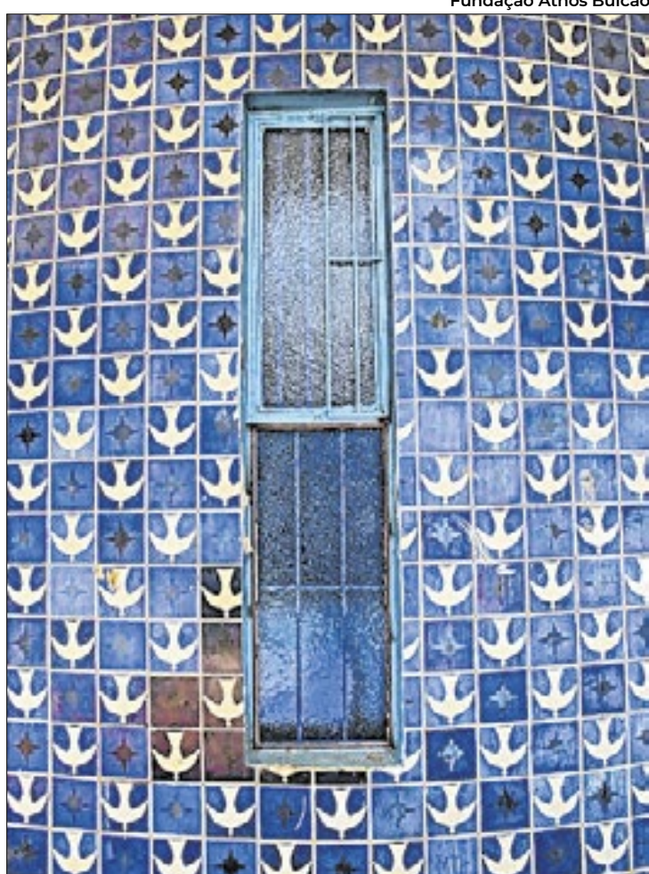
Nas entrequadradas 307 e 308 Sul