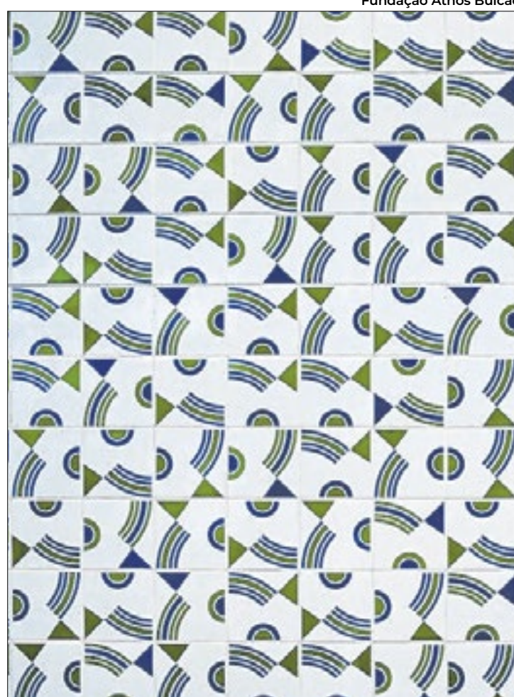
No Instituto de Artes da Universidade de Brasília