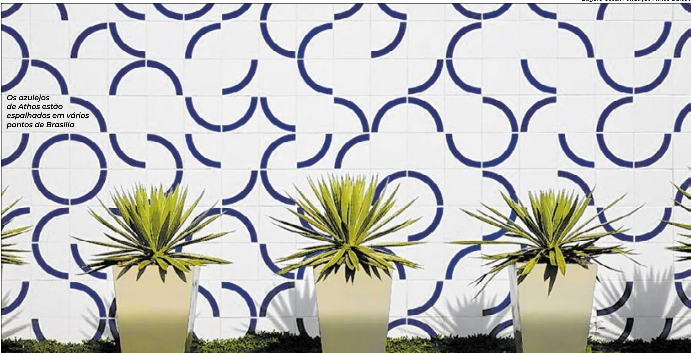
Os azulejos de Athos estão espalhados em vários pontos de Brasília