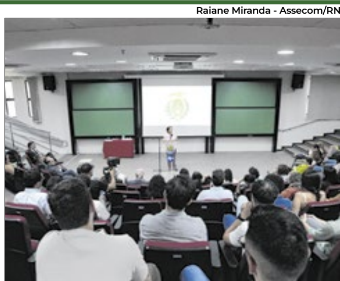
A governadora reivindicou a atenção de investimentos

Lista premia melhores do segmento turístico durante o ano