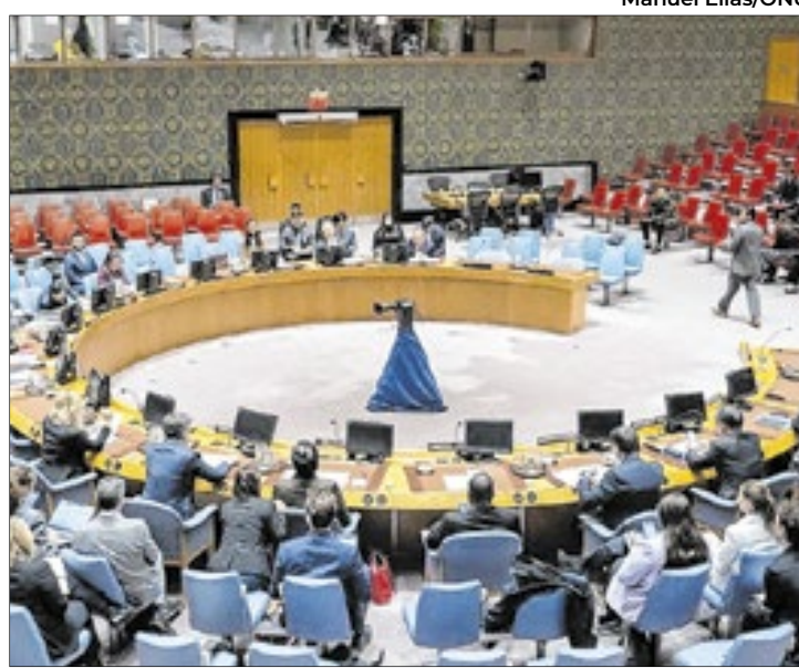
Conselho de Segurança debate a questão na Síria