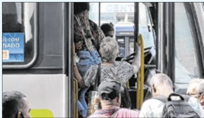
Descumprimento de medida sujeita empresas a multas