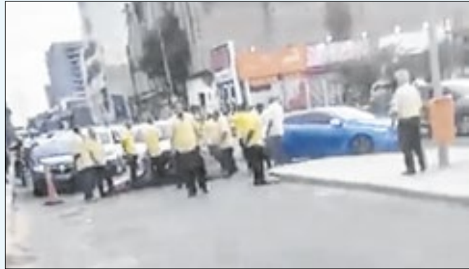
Taxistas protestam na Novo Rio contra concorrentes