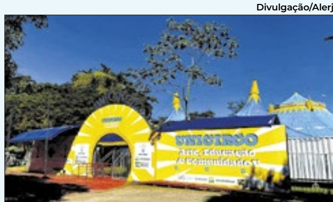
Projeto Unicirco fica localizado na Quinta da Boa Vista

A candidatura conjunta é a segunda do Brasil, já que São Paulo também manifestou interesse. O Rio de Janeiro tem tradição em eventos desse porte, já tendo sido sede dos Jogos Pan Americanos de 2007 e dos jogos Olímpicos de 2016.