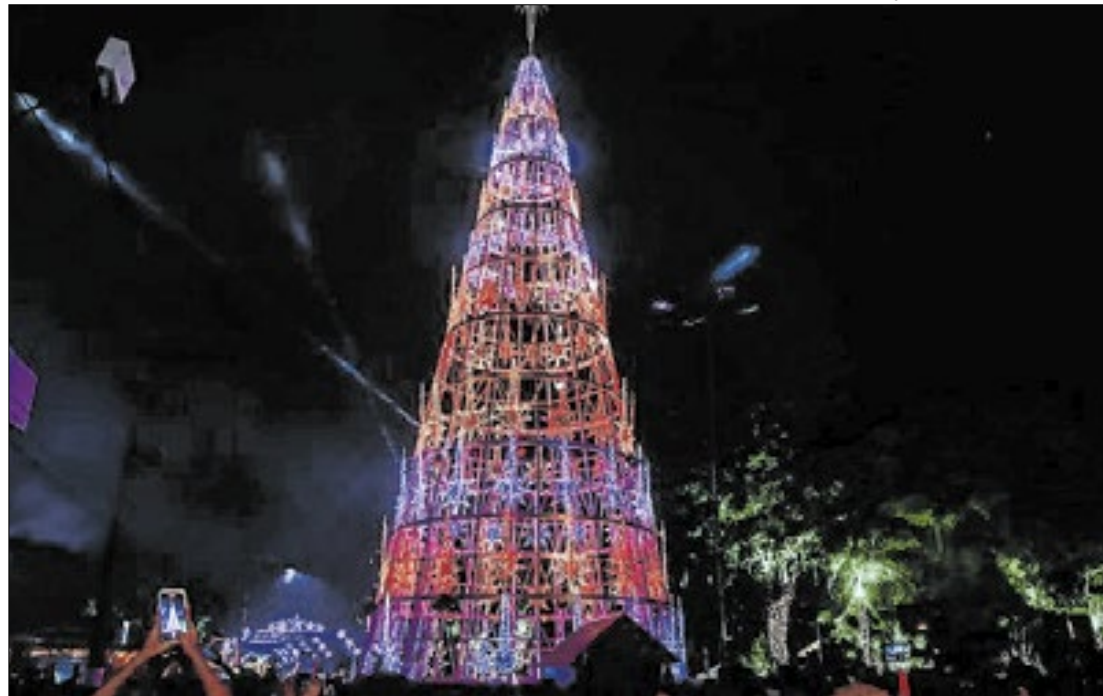
Magé Luz já se tornou tradição no fim de ano do município da Baixada

“Antes, eu viajava para outros municípios para apreciar as decorações. Agora, ver tal evento sendo realizado na cidade onde eu moro com minha família é extremamente gratificante. Estamos prontos para receber milhares de pessoas reunidas para celebrar o Natal, uma ocasião tão significativa que marca o nascimento de Jesus Cristo, é verdadeiramente especial. O Magé Luz estará aqui até 12 de janeiro com uma programação diversificada com apresentações musicais todos os dias, trazendo essa alegria para cada canto da cidade”, convida