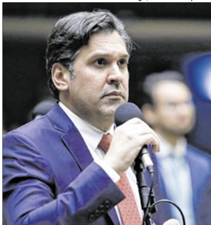
Isnaldo sinalizou que modificará pacote fiscal

O pacote fiscal foi dividido em três medidas: o Projeto de Lei (PL) 4614/2024, o Projeto de Lei Complementar (PLP) 210/2024 e a Proposta de