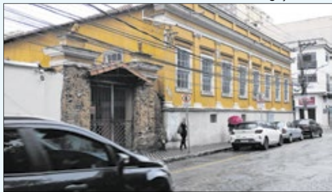
Entrada solidária pode ser adquirida com litro de leite