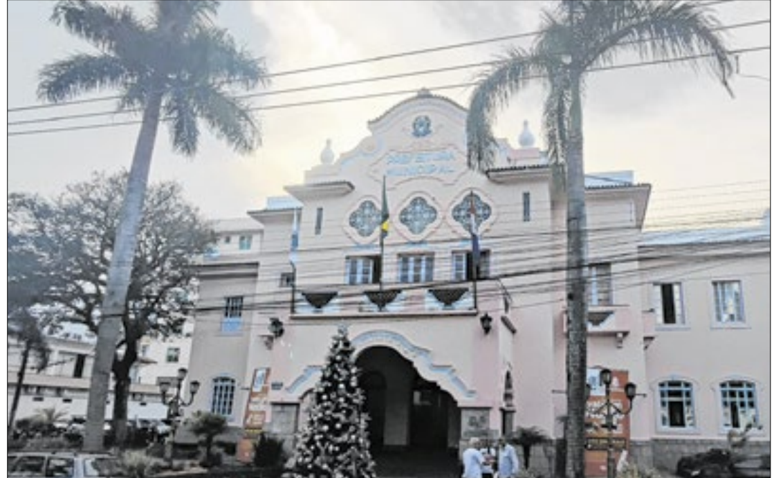
Pesquisa foi realizada pelo TCE no período compreendido entre 15/01/2024 e 15/05/2024

da transformação digital do setor público brasileiro e define regras para a digitalização de serviços públicos, para o estabelecimento das plataformas de governo digital, para a disponibilização de dados abertos e para a instituição do domicílio eletrônico do cidadão.