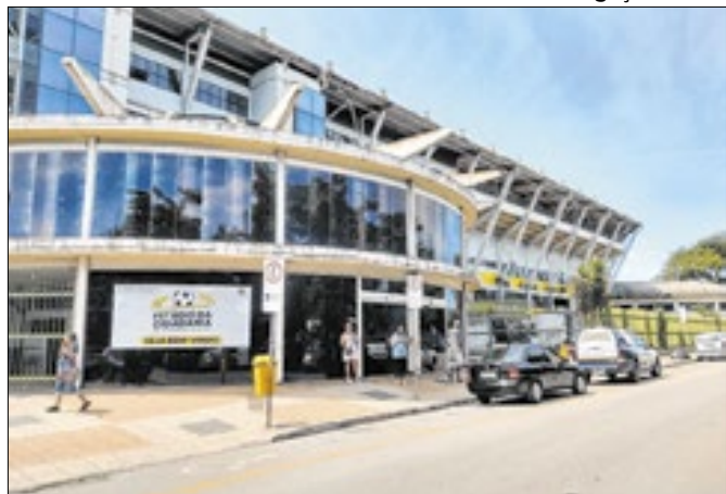
Evento acontecerá no Estádio Raulino de Oliveira