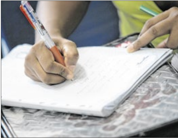
Abertas as inscrições para o curso extensivo da Fundação