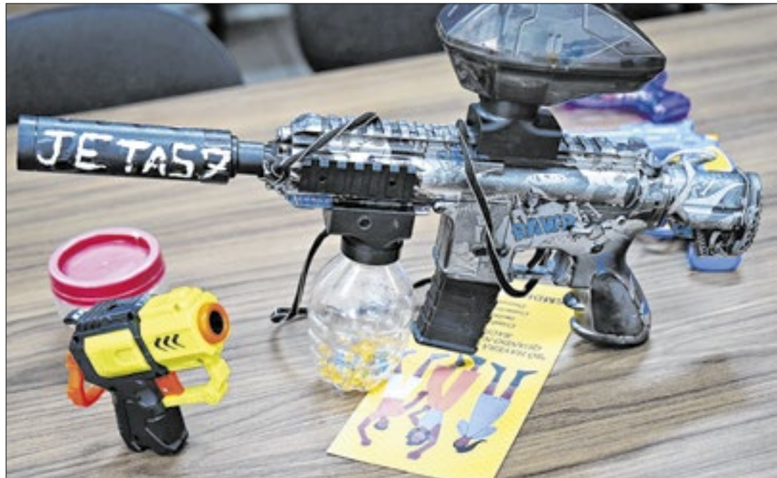
Polícia Militar chegou a ser chamada por moradores que confundiram com criminosos

A brincadeira se popularizou, principalmente nas últimas semanas, e a utilização em espaços públicos tem gerado confusão e riscos. Nesta semana, a Polícia Militar chegou a ser chamada por moradores do bairro Santo Agostinho que acreditavam que a brincadeira se tratava da ação de criminosos armados – alguns participantes estavam vestidos com capuzes.