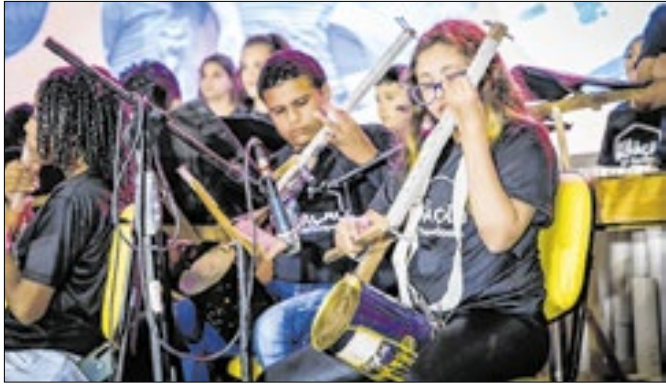
Orquestra utiliza instrumentos produzidos com recicláveis