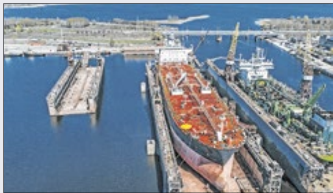
Novas contratações da estatal reforçam setor petróleo