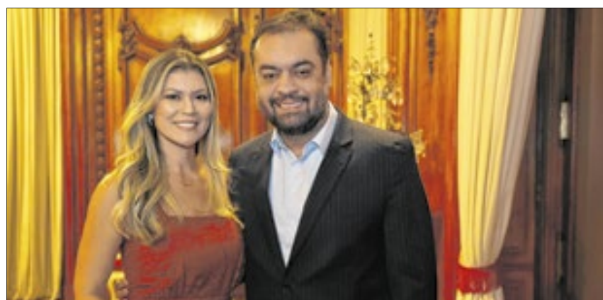
Os anfitriões da festa no Palácio Laranjeiras, o governador Cláudio Castro com a primeira-dama Analine

zação de harmonia com o governador Cláudio Castro e o vice Thiago Pampolha juntos, sem rixas e rivalidades, além de expressiva presença da bancada estadual. Um clima de paz que o Rio tanto precisava no mundo da política.