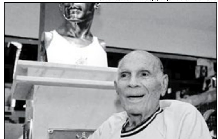
Amaury também foi lenda no basquete do Corinthians

Referência do basquete nacional, o mestre Amaury Pasos morreu nesta quinta-feira (12), em São Paulo, aos 89 anos. Campeão mundial de basquete em 1959 e 1963, e medalhista olímpico (bronze em Roma 1960 e Tóquio 1964), Amaury é até hoje o único atleta eleito duas vezes "o jogador mais valioso" (MVP, na sigla em inglês), em posições diferentes (ala e armador), a integrar o Hall da Fama da Federação Internacional de Basquete (Fiba). A causa