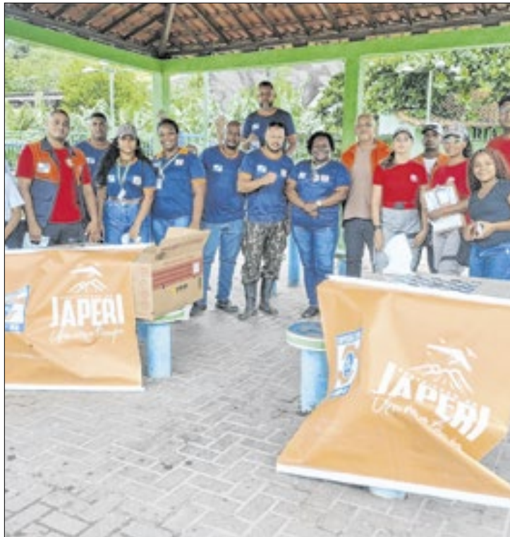
Inauguração do núcleo será no próximo sábado (14)