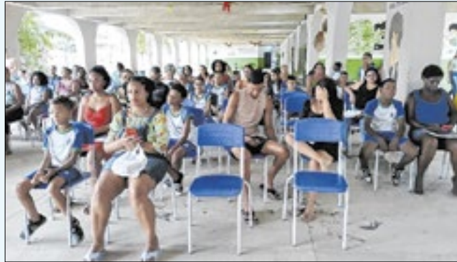
Ação aconteceu na última terça-feira (10)