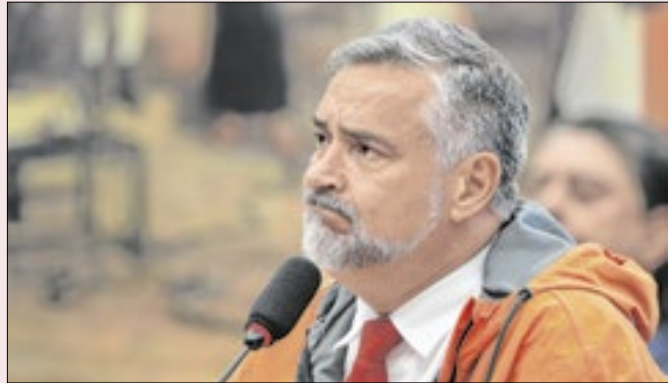
Quem substituirá Paulo Pimenta?