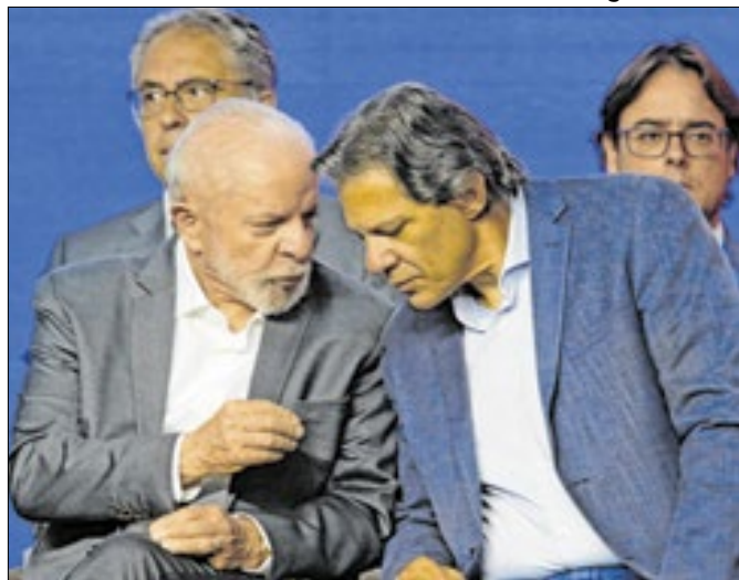
Pesquisa mostra chance da opção Haddad