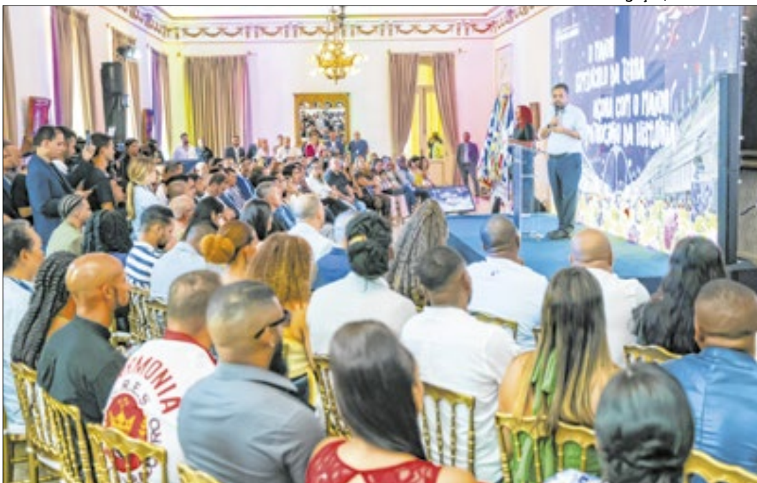
Iniciativa do governo estadual garantirá o sucesso do Maior Espetáculo da Terra

à Secretaria Municipal de Educação, lança seu próprio programa municipal, denominado Programa In-veste Educação Municipal (Piem). Ao todo, a prefeitura estima um investimento de cerca de 250 mil reais a cada ano, impactando em melhorias em cada uma das unidades.