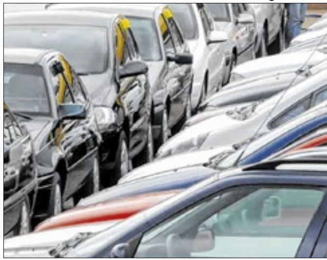
Desempenho automotivo em 2024 é o maior do planeta