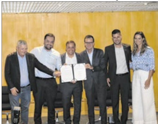
Rio e Niterói podem sediar jogos Pan-Americanos