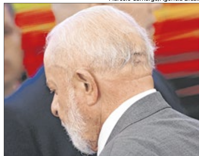
Presidente precisou ser operado às pressas