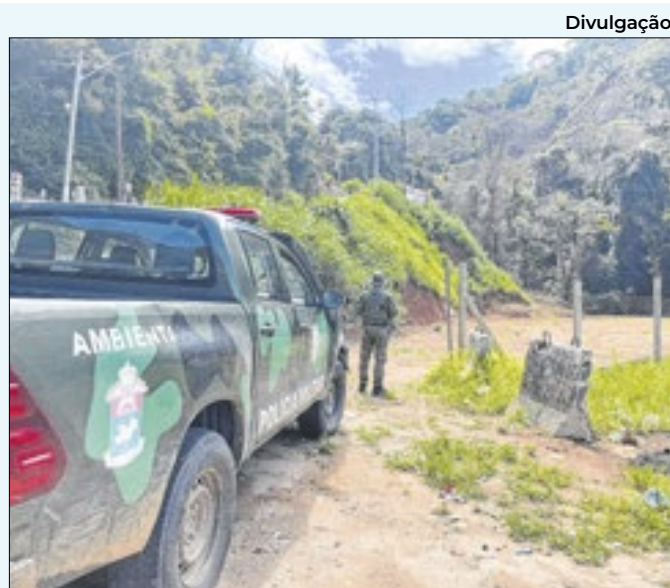
Ocorrência foi realizada no distrito de Pedro do Rio

articulação das políticas públicas que transformam nossa cidade, sempre com o foco em um trabalho eficiente", declarou o prefeito eleito.