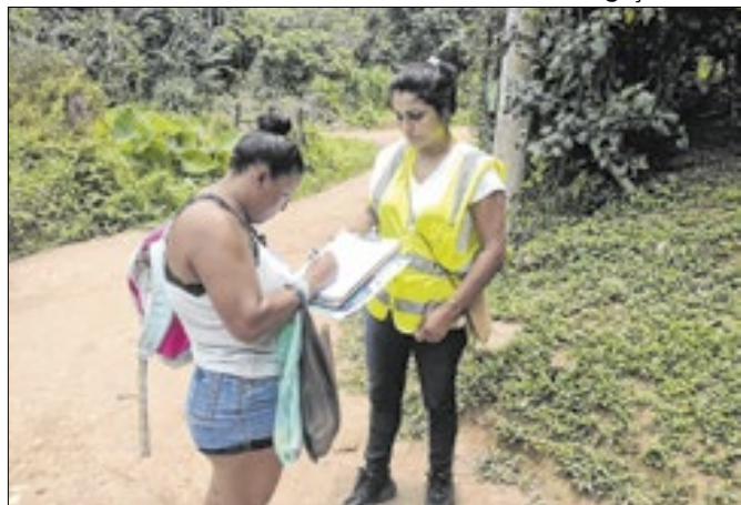
Cadastramento das famílias em área rural