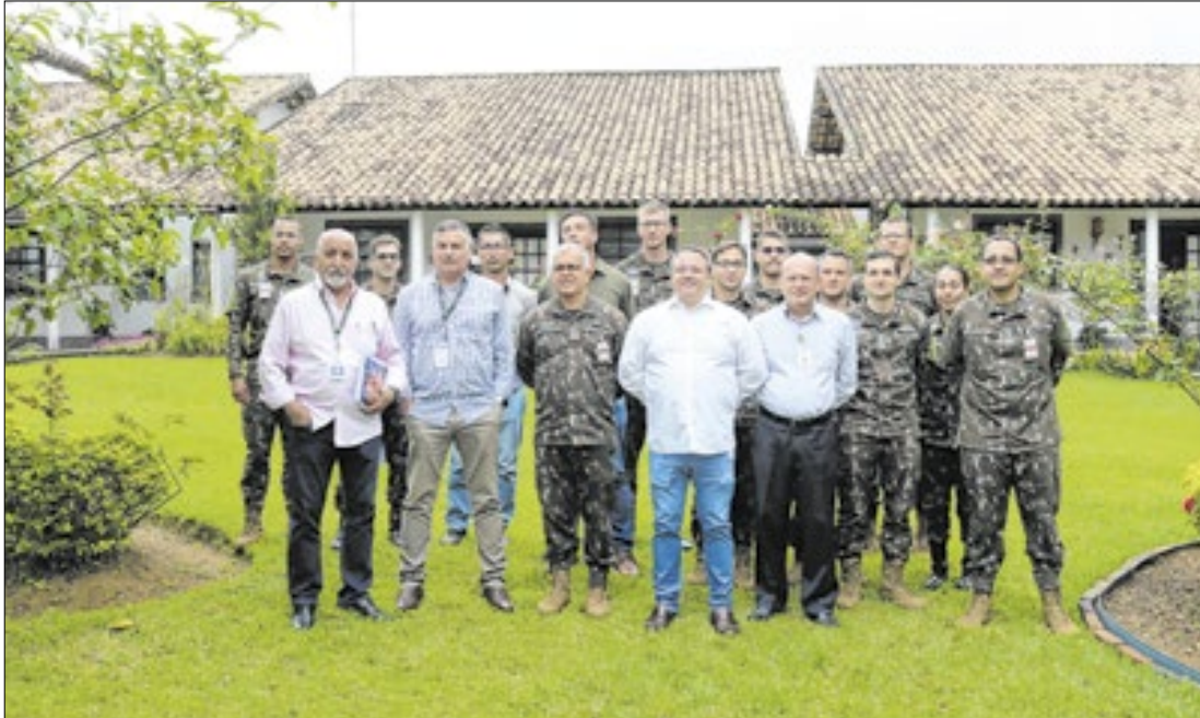
Representantes do Centro de Defesa Cibernética visitam fábrica de combustível de nuclear em Resende-RJ