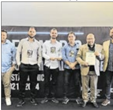
Manual promove acessibilidade

O município de Cordeiro foi premiado durante o Seminário Programa Calçada Acessível 2021-2024, um evento de grande relevância para a promoção da mobilidade urbana no Brasil. A premiação reconhece o trabalho