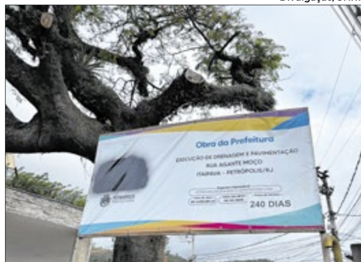
Novo prazo de entrega é no dia 25 de dezembro