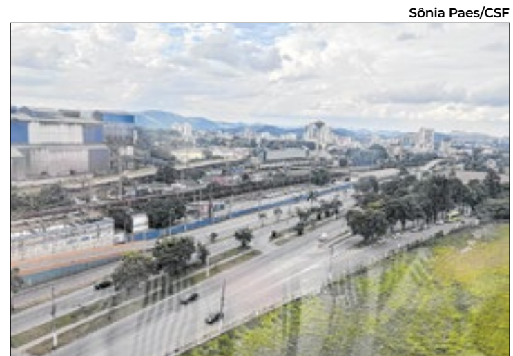
CSN faz alteração em planos de investimentos

No documento, o Grupo informa que R$ 300 milhões serão pagos na conclusão da transação e o restante do preço total será pago em três parcelas anuais, se a compra for efeti-