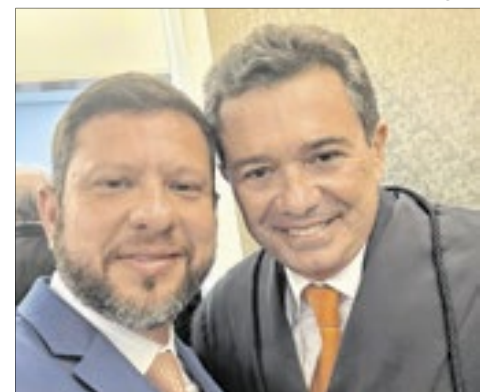
O secretário de Estado da Casa Civil do RJ, Nicola Miccione, com o novo presidente do TCU, Vital do Rêgo