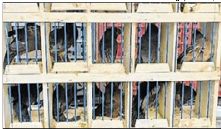
Operação de fiscalização resultou na apreensão