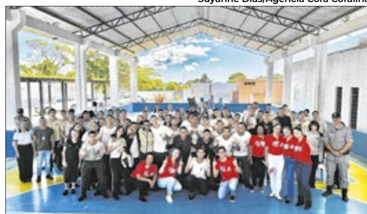
Conscientização sobre HIV/AIDS em escolas e comunidades