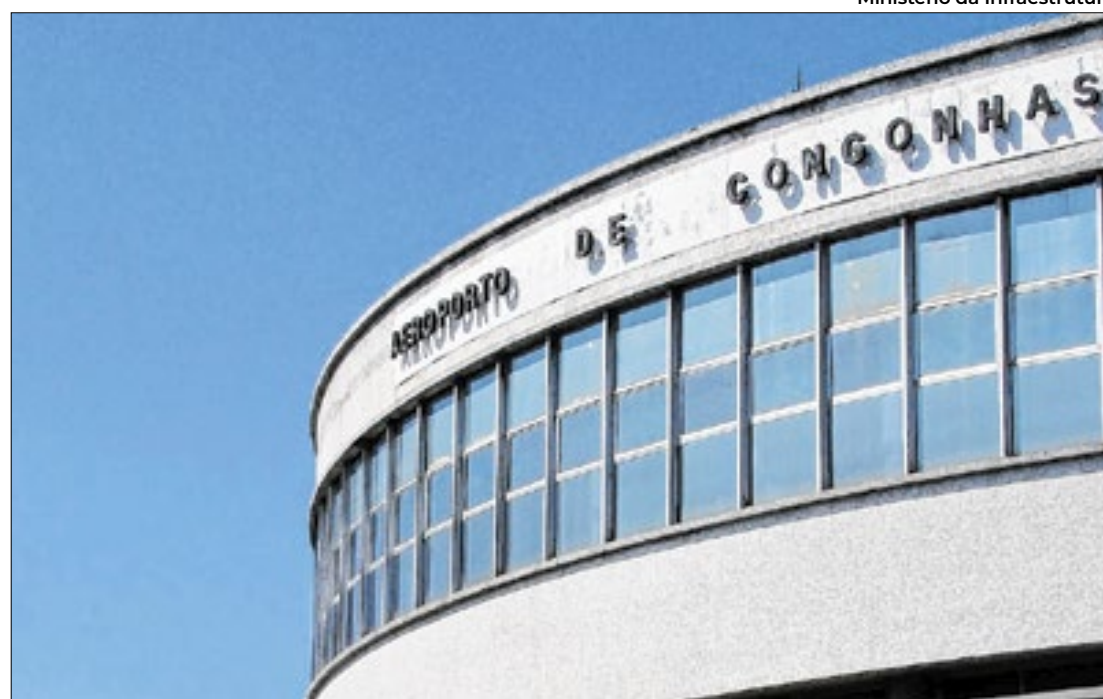
Aeroporto de Congonhas terá o mesmo padrão de terminal internacional

Investimentos em aeroporto são da ordem de R$ 2,4 bilhões