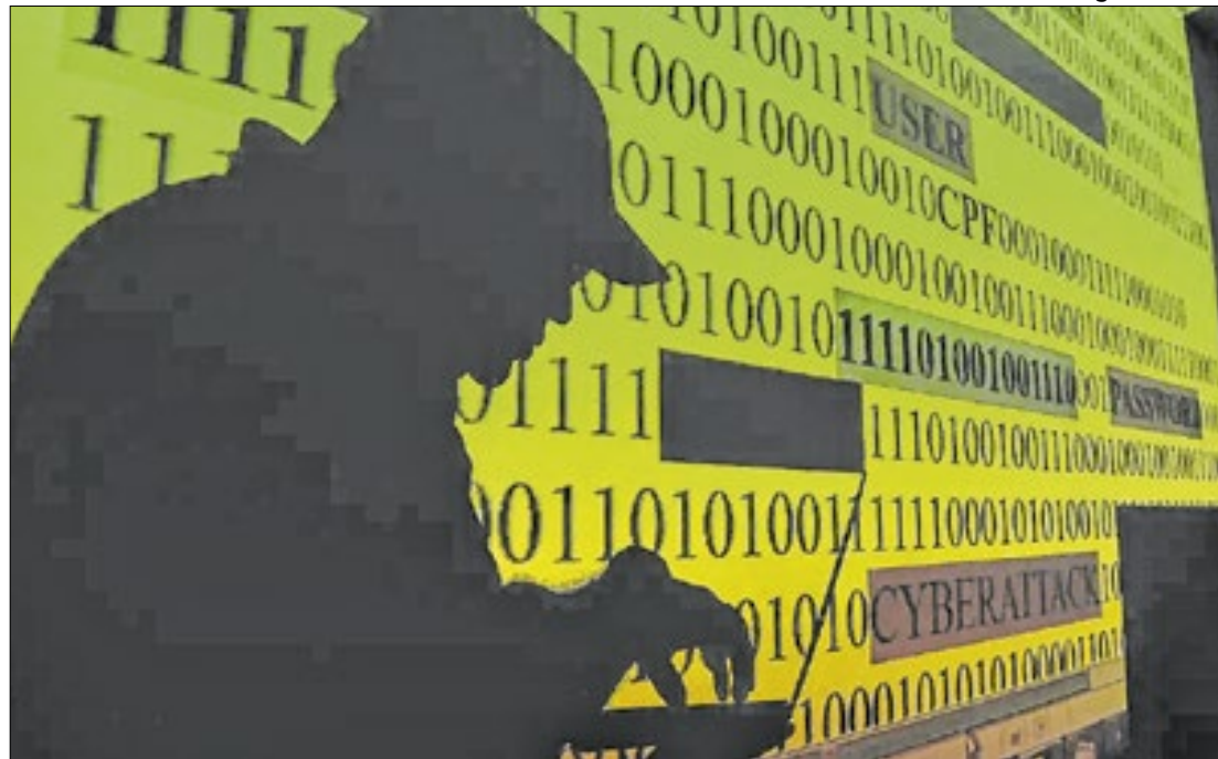
Governador sanciona lei de combate a crimes cibernéticos contra crianças

O governador Rafael Fonteles sancionou a Lei Nº 8.541, de 4 de dezembro de 2024, que institui a Campanha de Conscientização e Prevenção contra Crimes Cibernéticos. A medida visa combater crimes que utilizam indevidamente a inteligência artificial (IA) para ameaçar a segurança de crianças e adolescentes no estado do Piauí. A lei, proposta pelo deputado estadual Marden Menezes, foi oficializada com a