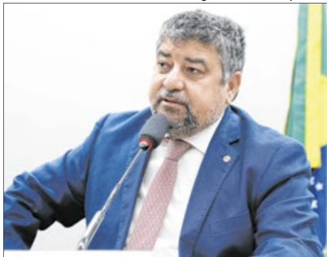
Quaquá: "Lula precisa de amigos, não de puxa-sacos"