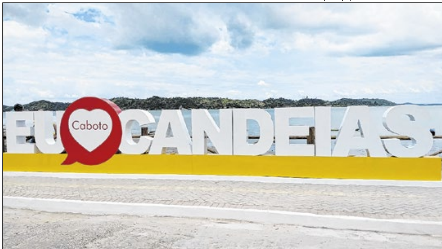
Município de Candeia está localizado na região metropolitana de Salvador

Além disso, Mendonça questiona a forma como a participação privada seria estruturada. De acordo com ele, a sociedade estaria destinada a ser dominada por investidores privados, com o poder político e econômico do município sendo meramente minoritário, o que indicaria um favorecimento de interesses privados em detrimento dos