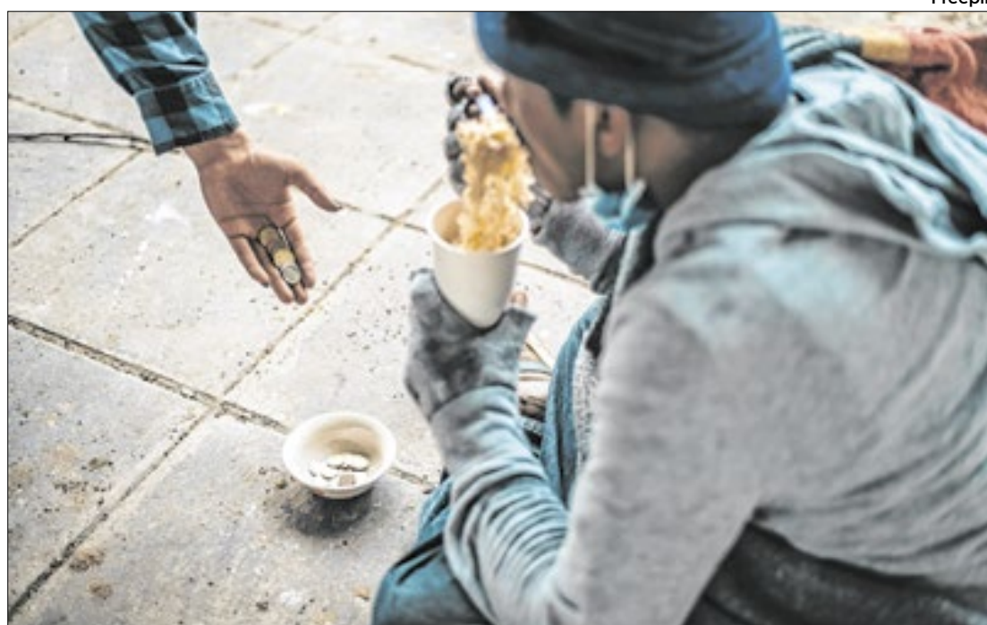
Os dados foram apresentados na quarta-feira pelo governo

De acordo com o ministro do Desenvolvimento e Assistência Social, Família e Combate à Fome, Wellington Dias, o diagnóstico trazido por essa edição da série de estudos busca