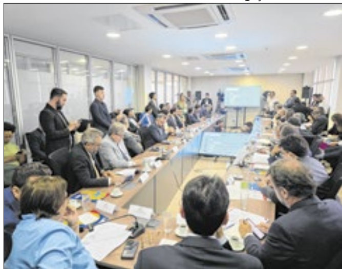
O valor é apenas a primeira etapa do programa no RN