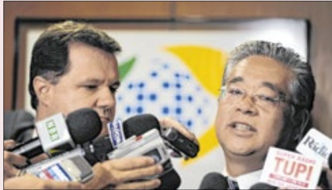
Quaquá defende Okamoto como presidente do PT