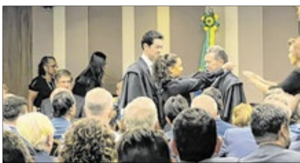
O presidente Vital do Rêgo ao receber o Grande-Colar do Mérito do Tribunal de Contas da União