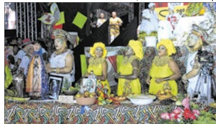
Inscrições para o "Circuito das Artes" abertas até nov/25