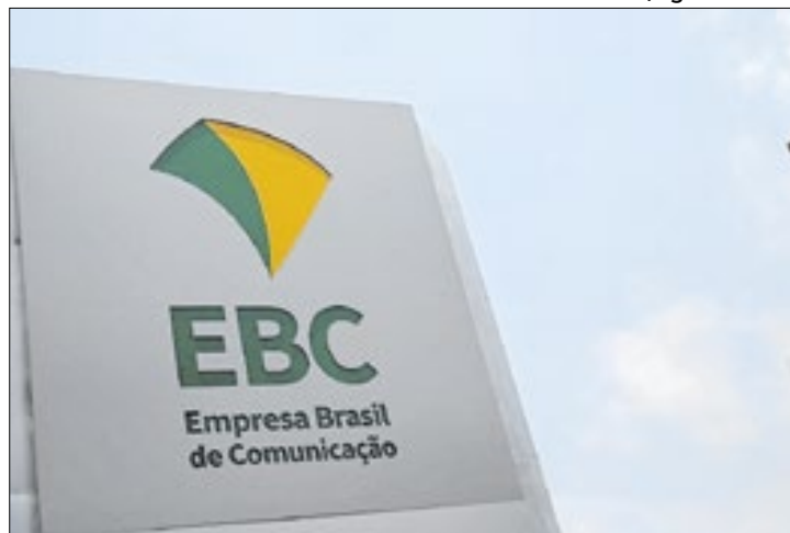
Empresa estava sem instâncias dessa natureza desde 2016

A Empresa Brasil de Comunicação (EBC) divulgou nesta quarta-feira (11) o resultado final das votações para o Comitê Editorial e de Programação (Comep) e Comitê de Participação Social, Diversidade e Inclusão (Cipadi). Os dois fóruns fazem parte do Sistema Nacional de Participação Social na Comunicação Pública (Sinpas). A EBC estava sem instância dessa natureza desde 2016, quando ocorreu a extinção do Conselho Curador.