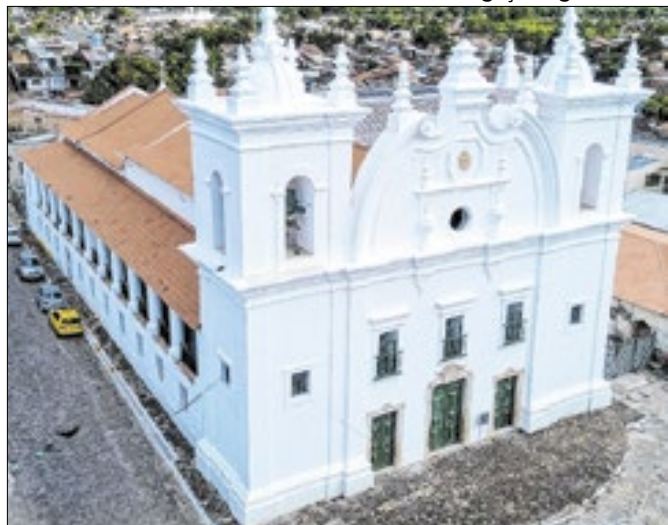
A igreja Barroca abriga o Círio mais antigo do Pará