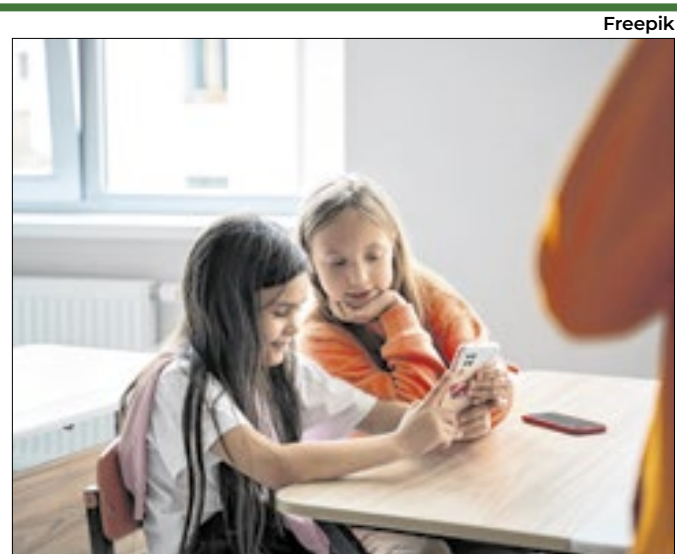
Projeto prevê medida para escolas públicas e privadas