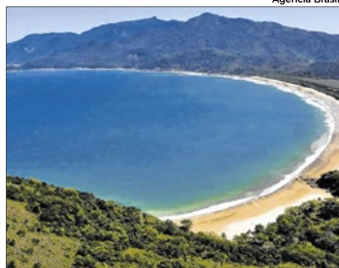
Embarcação está naufragada desde 1852 em Angra dos Reis