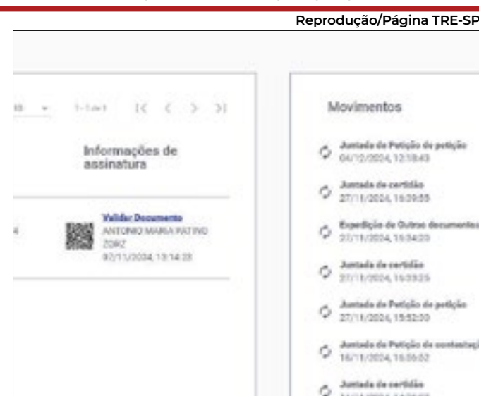
Documentos da ação passaram a ter acesso restrito