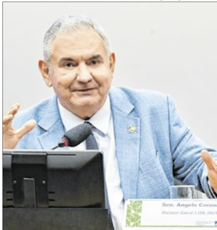
Coronel prevê orçamento com valor total de R$ 6 trilhões

Como foi informando anteriormente pelo Correio Político, caso o Congresso não consiga aprovar a LDO ainda neste ano, isso pode gerar problemas ao poder Executivo. Isso porque, sem a LDO, o governo não tem como utilizar a regra de liberação de 1/12 a cada mês sem aprovação do orçamento. Com isso, seria necessário que o governo adotasse alternativas, como editar mensalmente me-