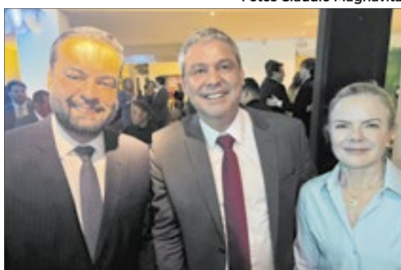
Durante jantar em homenagem a Vital do Rêgo, o governador do Rio, Cláudio Castro, com o casal Gleisi Hoffmann e Lindbergh Farias