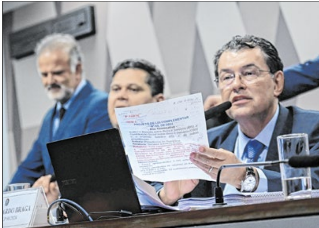
Eduardo Braga recebeu quase duas mil emendas ao texto da tributária

O Congresso corre contra o tempo para aprovar a medida antes do recesso parlamentar, agendado para o dia 23. Antes mesmo da votação na CCJ, Eduardo Braga apresentou seu relatório ao presidente da Câmara dos Deputados, Arthur Lira (PP-AL), e demais líderes entre os deputados para que pudessem avaliar as mudanças e já negociar eventuais alterações. De acordo com Lira, os parlamentares estão trabalhando em