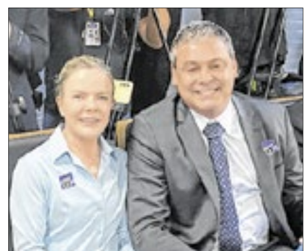
O casal e deputados petistas Gleisi Hoffmann e Lindbergh Farias

Em seu discurso de posse, Vital do Rêgo enfatizou os avanços realizados pelo Tribunal nos últimos anos e reafirmou seu compromisso com a excelência do controle externo. O exercício do mandato dos dois cargos se inicia a partir de 1º de janeiro de 2025, com a possibilidade de reeleição por igual período.