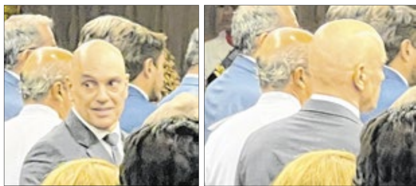
O cerimonial do TCU colocou o ministro Alexandre de Moraes na fileira atrás dos comandantes da Aeronauta, o Tenente-Brigadeiro do Ar Marcelo Kanitz Damasceno; e o da Marinha, almirante de Esquadra Marcos Sampaio Olsen. A cadeira de Moraes ficou exatamente atrás da cadeira do almirante.