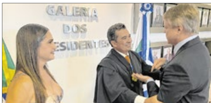
Os cumprimentos de Luiz Antônio Guaraná ao novo presidente do TCE, Vital do Rêgo