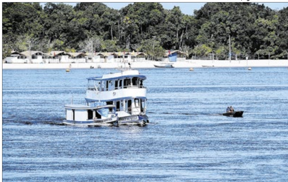
Praia Grande, em Barcelos, a 399 km de Manaus, destaca-se pela pesca e natureza única

Outro ponto abordado foi a sazonalidade da atividade, que atinge seu pico durante o período de estiagem, entre setembro e fevereiro. Nesse intervalo, há uma maior movimentação econômica, envolvendo guias, barcos, pousadas e serviços re-