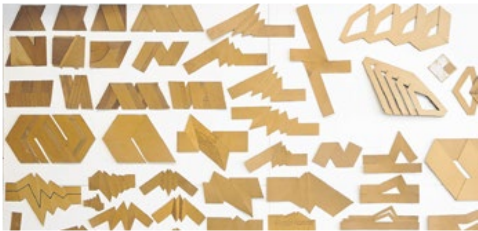
A obra de Ascânio MMM reúne várias influências e questões centrais na arte brasileira e latino-americana dos últimos 60 anos