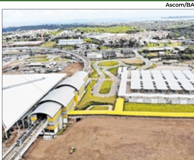
No 3º trimestre, o PIB baiano totalizou R$ 114,4 bilhões