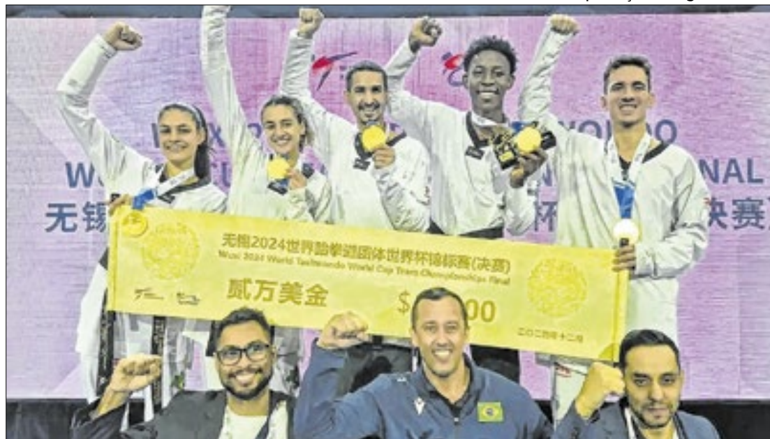
Equipe superou as donas da casa e o Uzbequistão

O formato da competição previa série de três lutas para cada uma das sete seleções (Austrália, Brasil, China, Coreia do Sul, Jordânia, Rússia e Turquia). O Brasil levou a melhor na estreia contra a Austrália, nas quartas de final, por 2 combates a 0. Na sequência venceu de virada a Coreia do Sul por 2 a 1. Na disputa final,