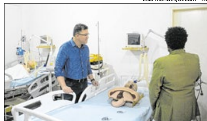
Governador Marcos Rocha (União) na simulação de UTI