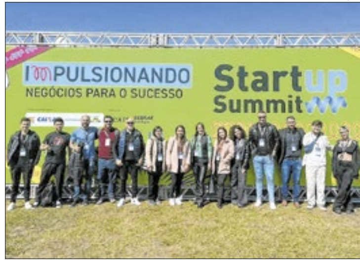
BrevenLaw, Peplus e Virtwell foram contempladas

As startups BrevenLaw, Peplus e Virtwell, incubadas pela Agência de Inovação e Propriedade Intelectual da Universidade Estadual de Ponta Grossa (Agipi-UEPG), foram contempladas no Programa Paraná Anjo Inovador, da Secretaria da Inovação, Modernização e Transformação Digital.