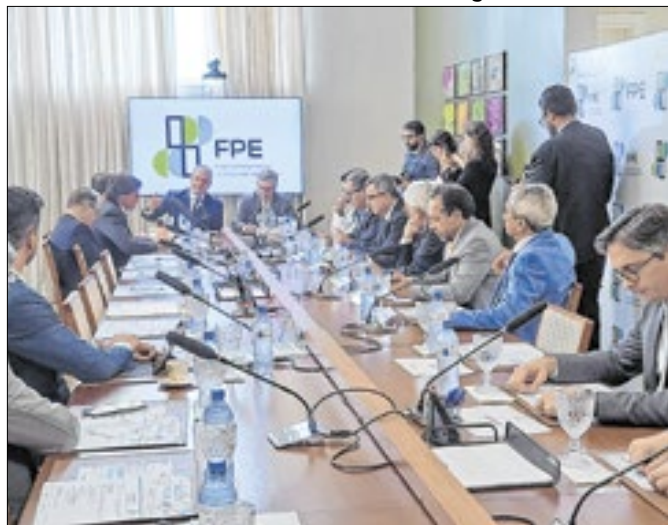
Farpas trocadas durante o almoço