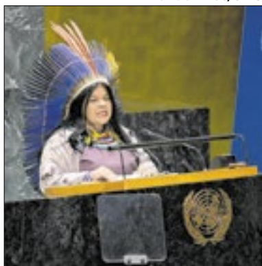
Sonia Guajajara recebe prêmio