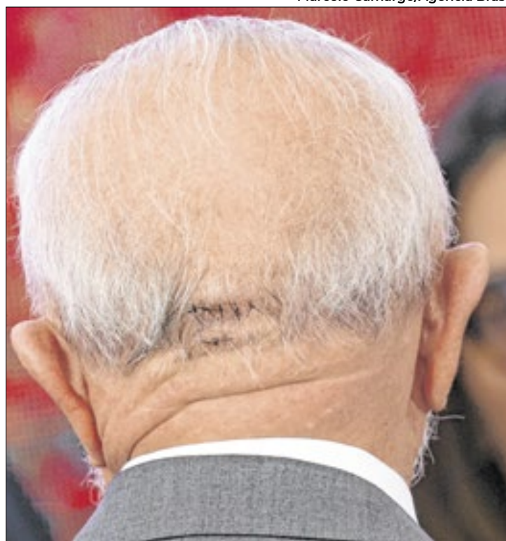
Lula levou cinco pontos na nuca após a queda que sofreu