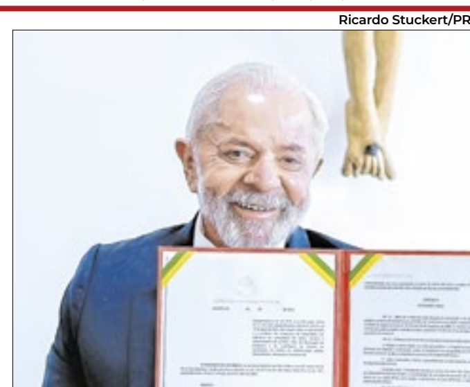
Lula em solenidade, horas antes de ser internado