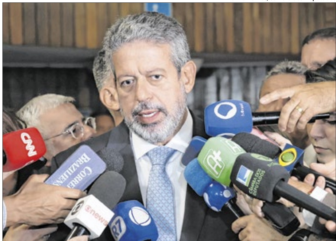
Lira repete que governo não tem votos para aprovar pacote

Antes, havia alguma expectativa de que recados poderiam ser dados na sabatina e na votação. E, se não aconteceram, avalia-se que já passa ser sinal do empenho do governo em resolver o impasse orçamentário. As relações entre os poderes seguem conturbadas após o ministro do Supremo Tribunal Federal (STF) Flávio Dino manter as exigências do STF