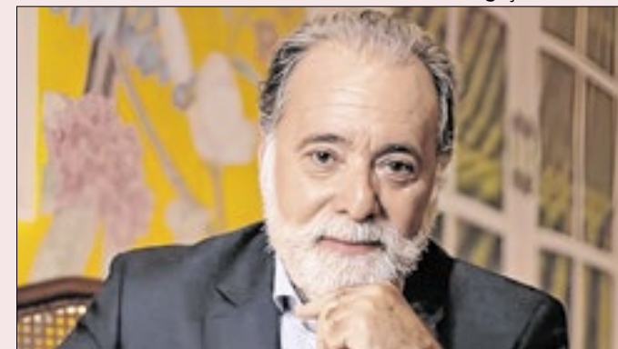
Ator precisou ser submetido a duas cirurgias