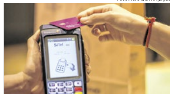
O uso abusivo do cartão de crédito é o que mais traz dívidas às famílias

Em novembro de 2024, o índice de endividamento das famílias no DF registrou uma redução de 2,1 pontos percentuais em