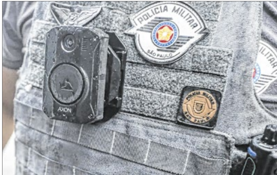
Problemas foram apontados em nota técnica do Núcleo de Estudos da Violência, da USP

Uma nota técnica do Núcleo de Estudos da Violência (NEV), da Universidade de São Paulo (USP), apontou problemas no edital de compra de câmeras corporais do governo de São Paulo. O principal problema, de acordo com o estudo, estava na especificação das câmeras corporais (COPs) que não previam o acionamento automático das gravações.