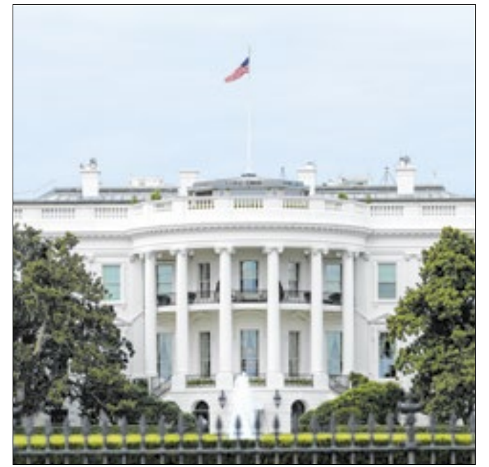
A China não terá vida fácil na administração Trump