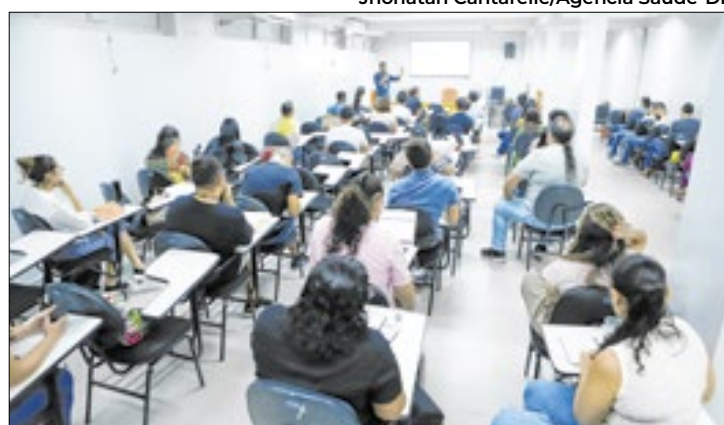
Jhonatan Cantarelle/Agência Saúde-DF

Curso aborda doenças comuns no período chuvoso