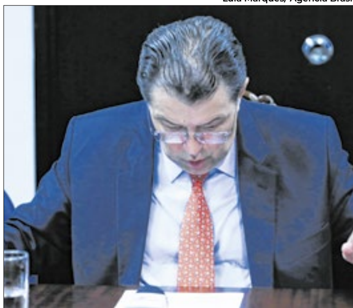
Projeto relatado por Braga deve ser votado hoje

O senador Izalci Lucas (PL-DF), por sua vez, criticou o tempo estabelecido para analisar o projeto. Segundo ele, o documento também deveria ser submetido à Comissão de Assuntos Econômicos (CAE), que realizou um grupo de trabalho, cujo relator foi ele, sobre o tema. “Como é que vamos analisar em 24 horas uma matéria com duas mil emendas, sendo 600 emendas acatadas, e um relatório de