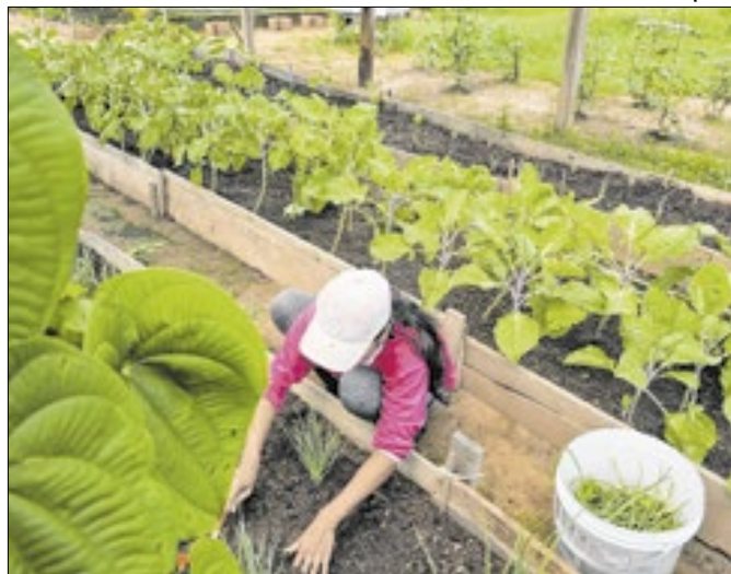
Iniciativa de essocialização por meio da horticultura