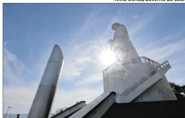
Destino tem o segundo maior crescimento