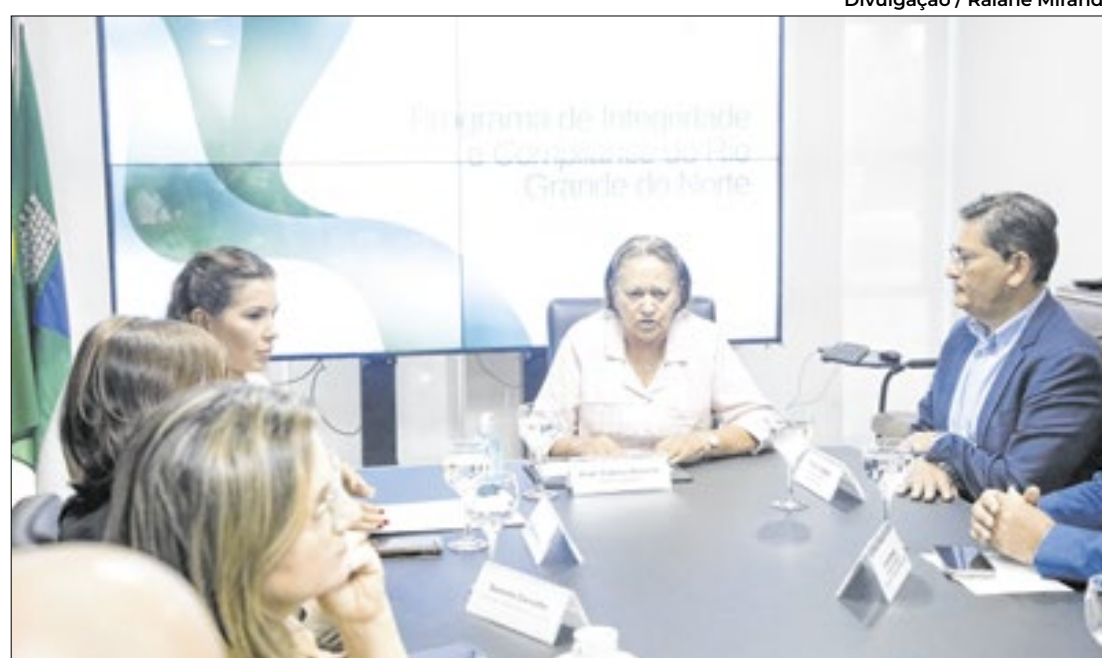
Os decretos inserem mudanças na renomeação do Conselho Estadual de Ética

Medidas definem atos para garantir eficiência à gestão pública