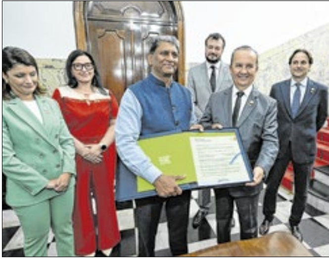
Encontro visa fortalecer relações comerciais