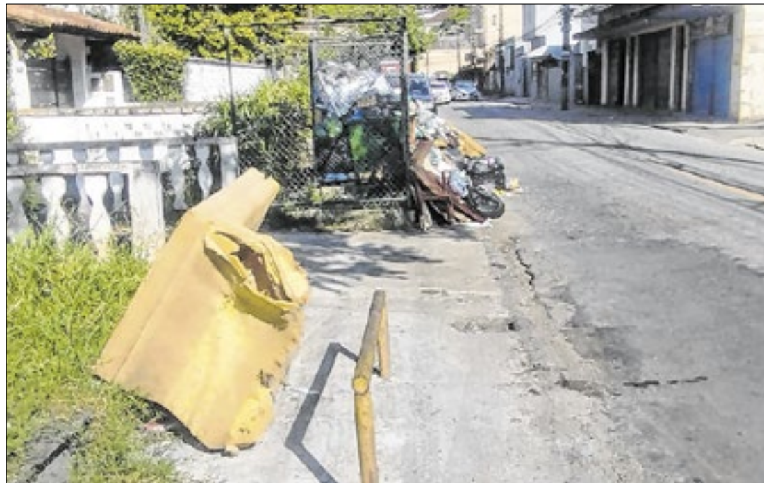
Entretanto, a Força-tarefa realizada pela Prefeitura não tem dado retorno positivo