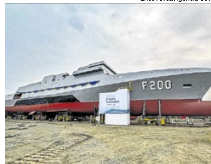
Primeira fragata da classe Tamandaré