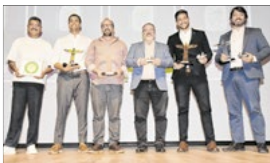
Os ganhadores do Prêmio Top Hotel RJ 2024. Cerimônia aconteceu no Copacabana Palace