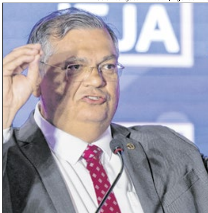
Dino insiste: tudo com total transparência

A Lei de Diretrizes Orçamentárias determina as metas e prioridades para o destino dos recursos públicos. Já a Lei Orçamentária Anual, mais detalhada, aponta como esses recursos serão utilizados e distribuídos. Ambas os relatórios somente foram definidos após o presidente Luiz Inácio Lula da Silva (PT) sancionar a Lei Complementar nº 210/2024, que “dispõe a proposição e a