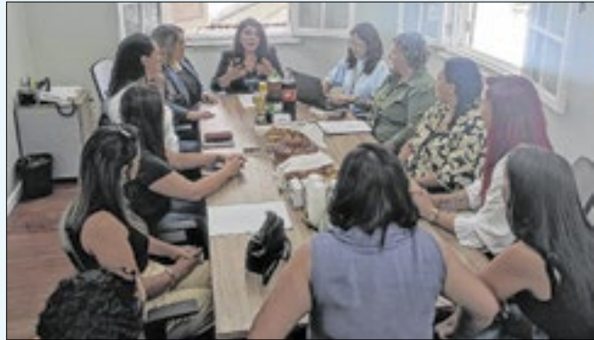
Participantes tomaram posse na última sexta-feira (06)