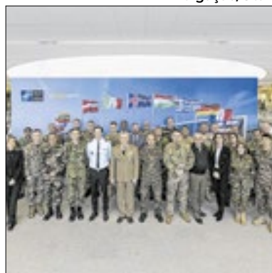
Programa da Otan é mostrado

De 5 a 13 de dezembro de 2024, 30 representantes de 20 nações parceiras visitaram a sede da OTAN e o SHAPE para o Programa de Familiarização de Oficiais do Estado-Maior Parceiro da OTAN. O evento de oito dias, organizado em conjunto pela Cooperative Security da OTAN e pela Partnership Directorate Military Cooperation Division da SHAPE, apresenta aos participantes a estrutura da OTAN e as oportunidades de cooperação.