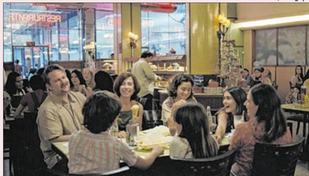
Em cartaz há um mês, o filme já foi visto por mais de 2,5 milhões de pessoas no país