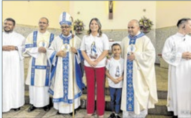
Festa foi realizada pela Paróquia em parceria com a prefeitura