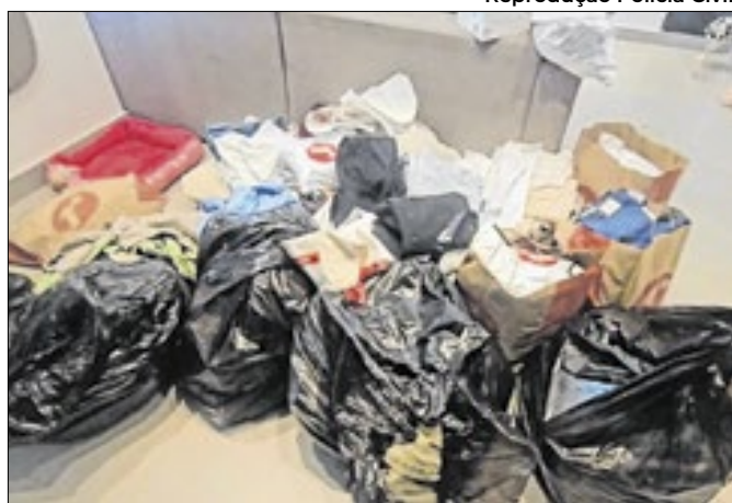
Grupo de ladrões de roupas atuava em três estados