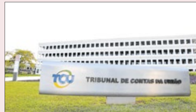
TCU quer evitar irregularidades futuras