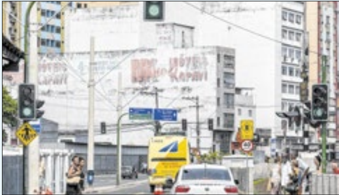
Trecho ficará fechado em horários especiais para lazer