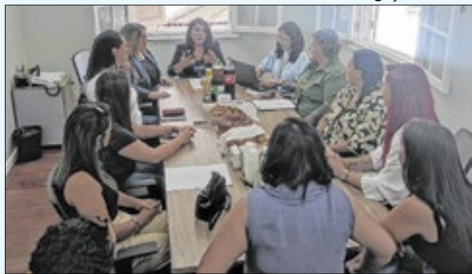
Participantes tomaram posse na última sexta-feira (06)