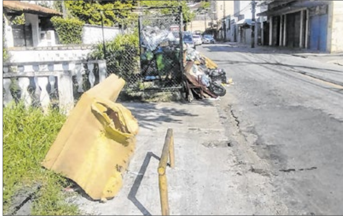
Entretanto, a Força-tarefa realizada pela Prefeitura não tem dado retorno positivo