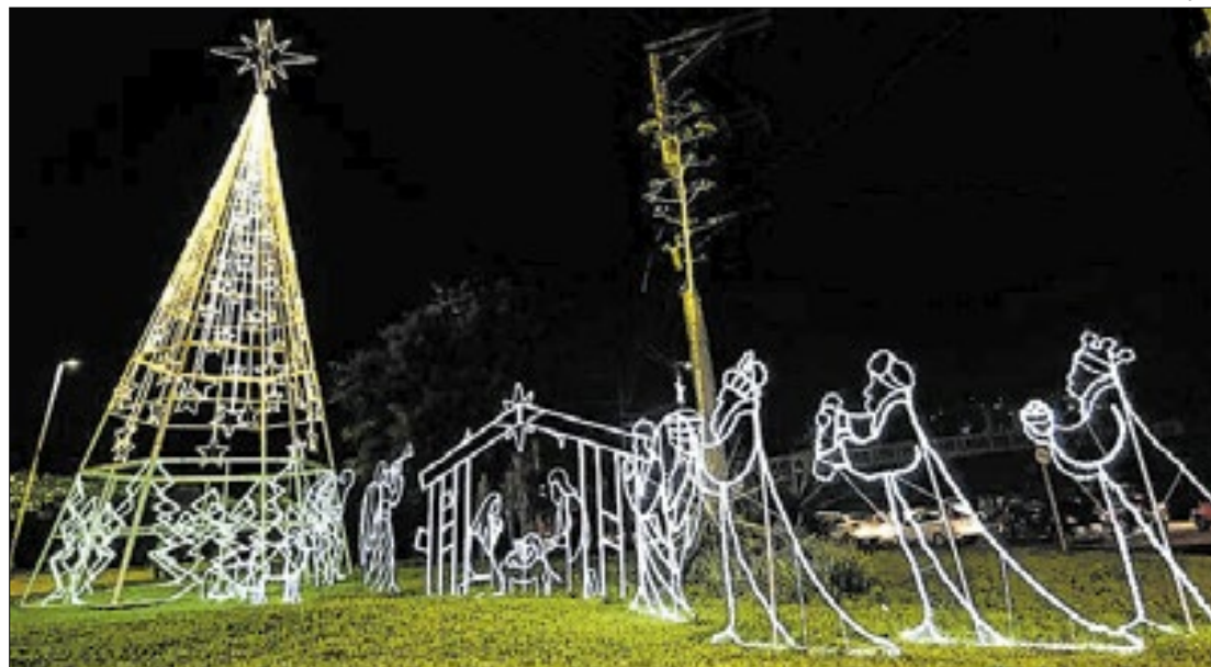
Decoração natalina encanta moradores de Nova Iguaçu e visitantes

A decoração de Natal já está pronta em Nova Iguaçu. Árvores de Natal, caixas de presente, letras luminosas, viadutos, postes e pórticos decorados estão criando uma experiência mágica e acolhedora. O serviço foi executado pela Subsecretaria de Serviços Especiais, ligada à Secretaria Municipal de Infraestrutura (SEMIF).