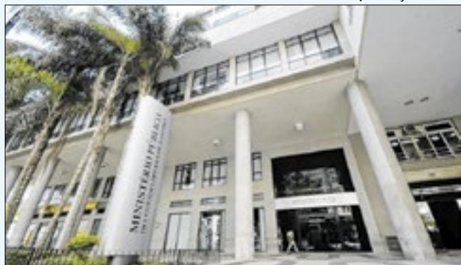
PMs foram denunciados por ocupação ilegal e especulação