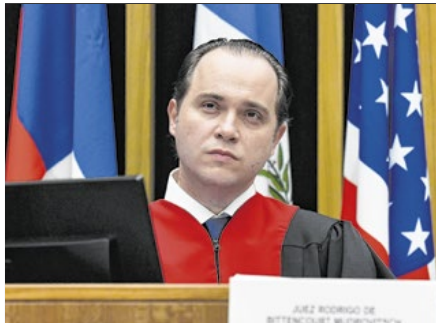
O vice-presidente brasileiro, Rodrigo Mudrovitch

Na sentença, a Corte determina que o Brasil dê continuidade às investigações sobre o caso, uma busca rigorosa pelos desaparecidos, além de um ato público de reconhecimento da responsabilidade internacional. Também foi ordenada a criação de um espaço de memória no Bairro de