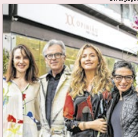
Empreendedores de Ipanema se unem a produtor cultural para agitar o mês de dezembro no charmoso bairro com desfiles na rua, talk shows e ações beneficentes