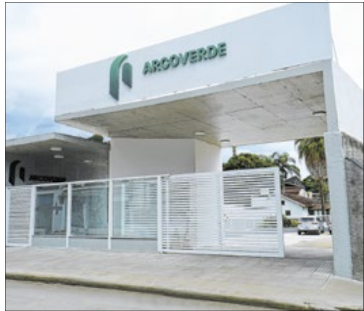
Edital com informações estão disponíveis no site da rede

A Rede de Educação Arcoverde abriu inscrições para o processo seletivo de concessão de 115 bolsas de estudo, com oportunidades integrais e parciais, disponíveis para estudantes do Ensino Fundamental I ao Ensino Médio. As bolsas contemplam três unidades escolares: o Colégio Arcoverde de Valença, o Colégio Arcoverde de Barra do Piraí e o Colégio Arcoverde - Unidade Macedo Soares, em Volta Redonda. Em Valença, estão disponíveis 16 bolsas integrais e 12 parciais. Já em Barra do Piraí, são 32 bolsas integrais e 29 parciais, enquanto em Volta Redonda, há sete bolsas integrais e 19 parciais. A oferta das bolsas é viabilizada pela Fundação Educacional Dom André Arcoverde, mantenedora da Rede de Educação Arcoverde, que possui o Certificado