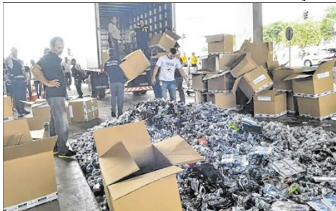
Combate ao mercado ilegal ainda não conta com 'antídoto' eficaz de autoridades

Interessante notar que, no estudo, a maioria dos consumidores (67,9%) reconhece que o impacto negativo da compra de produtos ilegais sobre a economia fluminense. Também relevante é o dado de que 64% entendem que o mercado ilegal