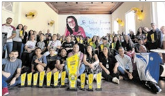
Escola Monsenhor João de Deus conquistou o topo do pódio