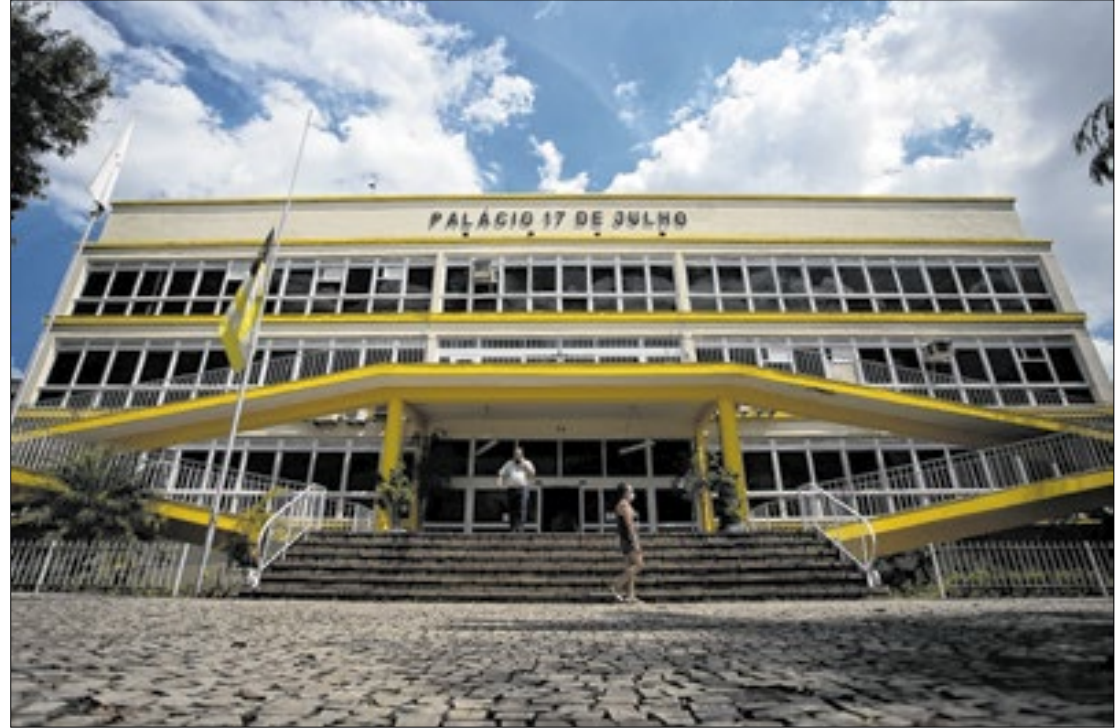
Esta é a segunda antecipação do benefício; a primeira parcela foi adiantada em junho