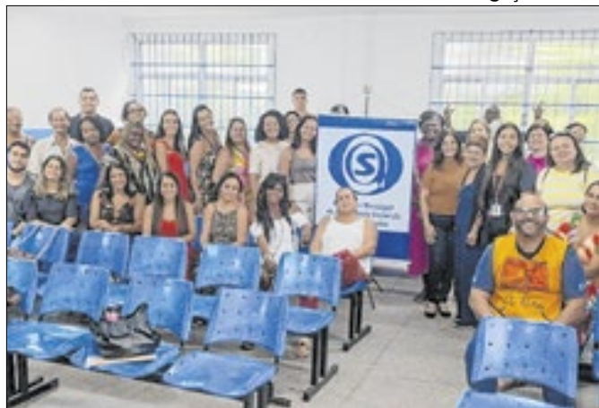
Conselho fez última reunião do ano