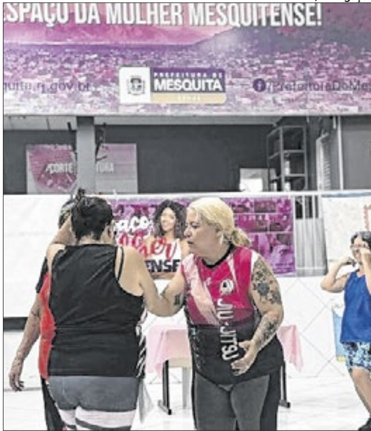
Ação foi parte de campanha de enfrentamento à violência