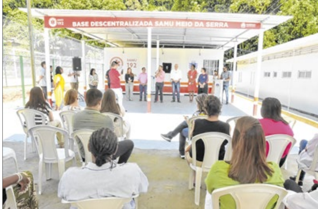
Inaugurações dos dois equipamentos de saúde aconteceram na manhã desta sexta-feira (06)

A nova base do Samu conta com uma ambulância que vai funcionar 24 horas