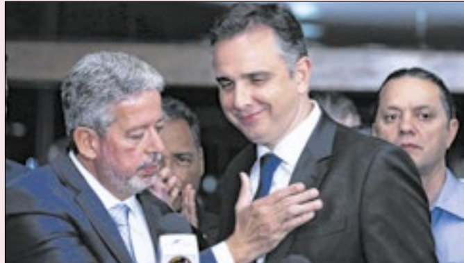
Lira e Pacheco querem deixar reforma como legado