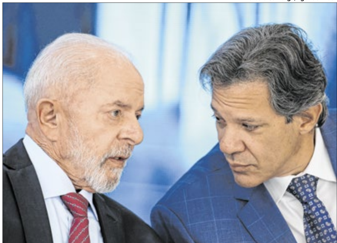
Lula e Haddad precisam aprovar pacote até o final do ano

Com a repercussão negativa, o governo teme que o Congresso trave as discussões e votações acerca do pacote fiscal de corte de gastos. Os projetos de Lei (PL) 4614/2024, de Lei Complementar (PLP) 210/2024 e a