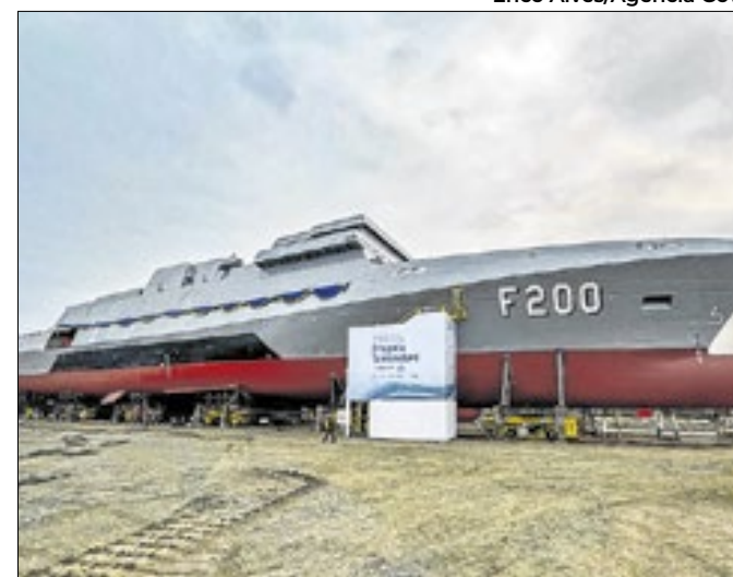
Primeira fragata da classe Tamandaré