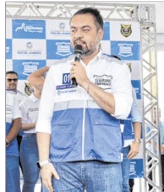
Castro inaugura base em Guapimirim