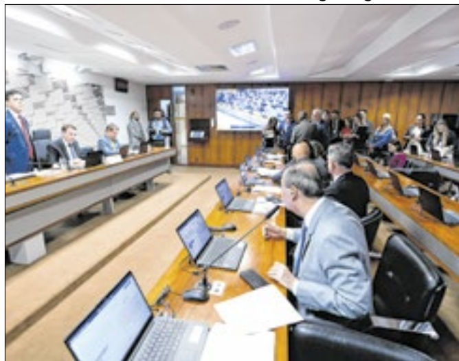
CAE pode virar o cenário da insatisfação do Congresso