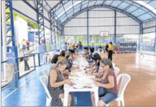
Distribuição será feita entre os dias 11 e 13 de dezembro