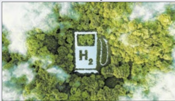
Autarquia anuncia 13 projetos de combustível sustentável