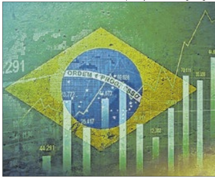
Medidas fiscais chinesas beneficiaram bolsa brasileira

O Ibovespa teve um início de semana descolado de certa cautela em Nova York e, no plano doméstico, do prosseguimento da alta do dólar frente ao real, bem como da curva dos contratos de Depósito Interfinanceiro (DI), em meio a revisões nas projeções de instituições financeiras sobre a decisão do Copom, no dia 11.