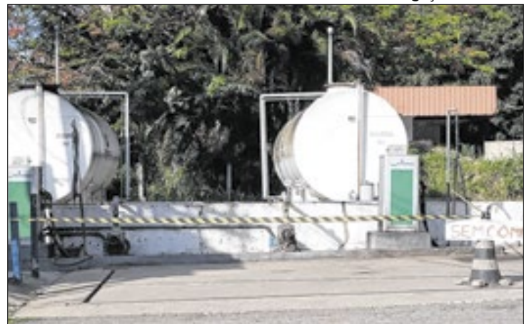
Prefeitura já realizou uma nova licitação para suprir falta