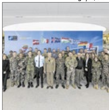
Programa da Otan é mostrado

De 5 a 13 de dezembro de 2024, 30 representantes de 20 nações parceiras visitaram a sede da OTAN e o SHAPE para o Programa de Familiarização de Oficiais do Estado-Maior Parceiro da OTAN. O evento de oito dias, organizado em conjunto pela Cooperative Security da OTAN e pela Partnership Directorate Military Cooperation Division da SHAPE, apresenta aos participantes a estrutura da OTAN e as oportunidades de cooperação.