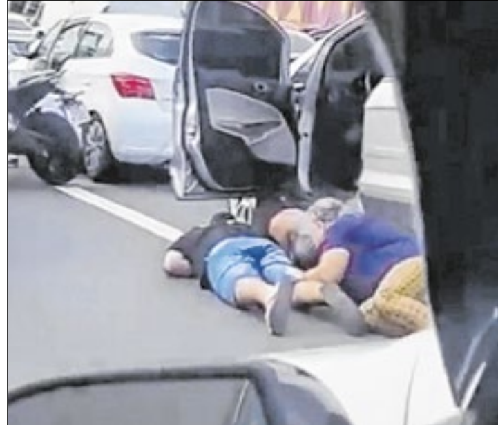
Início de semana é marcado por novas cenas de terror