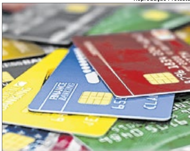
Setor quer facilitar pagamento de dívidas do cartão