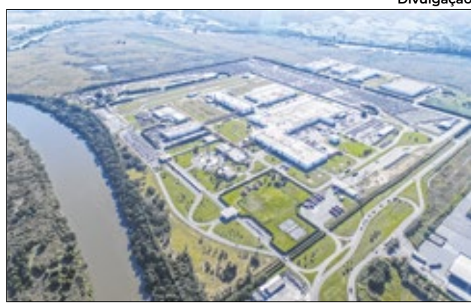
Cerca de 250 alunos participantes foram contratados