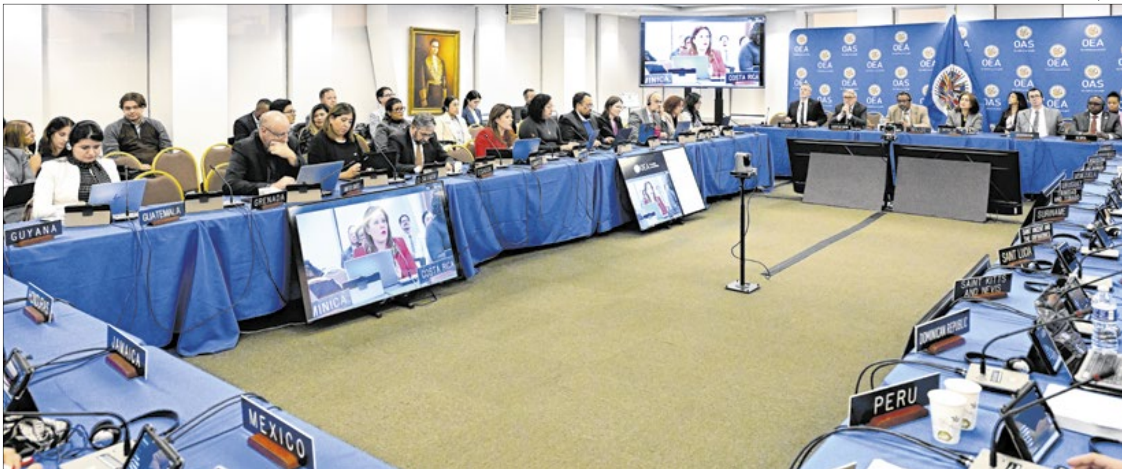
Reunião da Corte Interamericana de Direitos Humanos já julgou Brasil por violações, como casos de violência policial