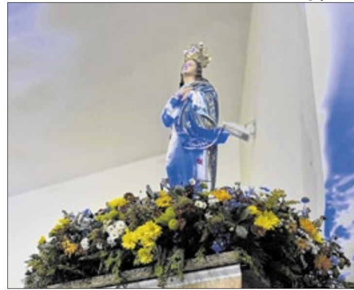
N.S da Conceição é celebrada anualmente no dia 8/12

Durante a missa, o sermão do padre falou da cegueira da indiferença, da necessidade do despertar para a caridade e do chamado de Deus para uma vida nova. "Maria nos confronta a sair do comodismo. E Cristo, nos chama para que possamos tocar na sua vida e deixar Ele tocar na nossa vida e na nossa cegueira. Acreditais que hoje você pode levar a graça