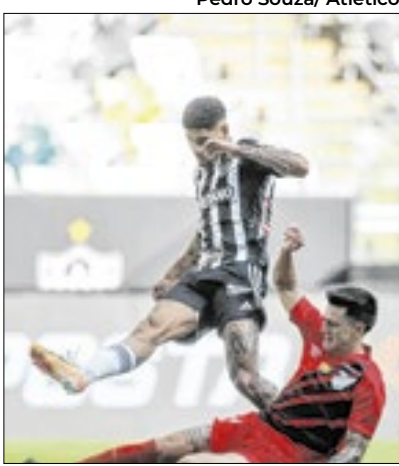
Furação foi rebaixado

Outra equipe que se livrou da degola na derradeira rodada do Brasileiro foi o Fluminense, que, mesmo jogando no Allianz Parque, bateu o Palmeiras por 1 a 0 graças a um gol do atacante Serna. Com este triunfo a equipe das Laranjeiras fechou o Brasileiro com o total de 46 pontos, na 13ª colocação.