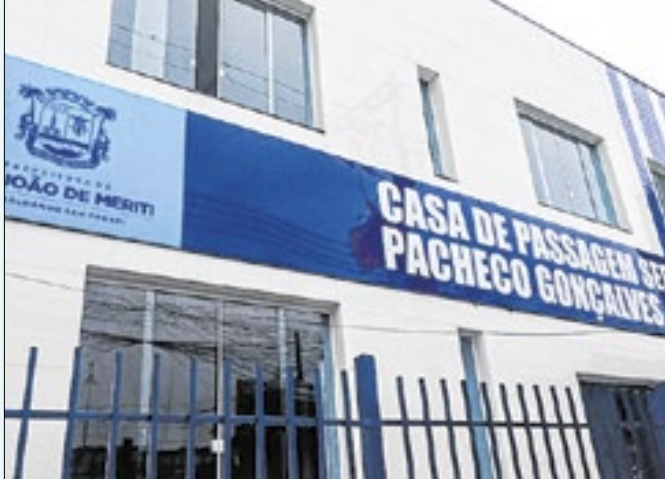
Casa de Passagem foi aberta na cidade