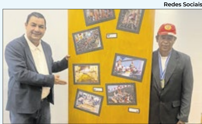
Prefeito Luciano Vidal confere mostra sobre Paraty

resultado oficial foi divulgado nesta quinta-feira, 5 de dezembro, pelo Ministério da Educação, confirmando o reconhecimento do trabalho de excelência desenvolvido na rede municipal de ensino.