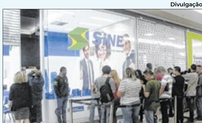
Inscrição pode ser feita na sede do Sine de V. Redonda

viar seus currículos para o e-mail: talentos@hospitalasantacecilia.org.br até o fim desta segunda-feira (9). O nome da vaga de interesse deve ser sinalizado no título do e-mail.