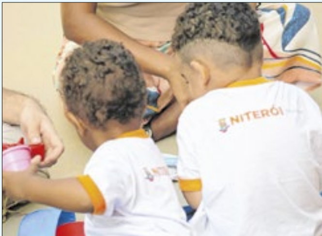
Resultado foi divulgado na última sexta-feira (06)