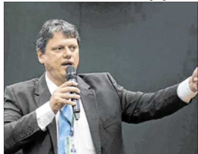
Governador tem sido poupado por aliados