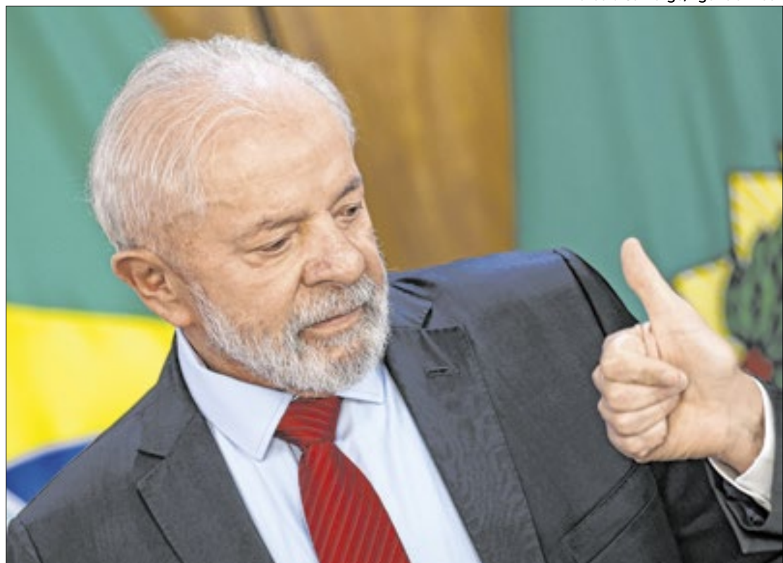
Lula tenta azeitar os acordos com o Congresso para concluir bem o ano

O relatório preliminar de Angelo Coronel fixa as receitas e despesas de 2025 em R$ 5,8 trilhões. Desse valor, R$ 1,6 trilhão vai para o refinanciamento da dívida pública federal. O montante ainda separa uma reserva de R$ 24,6 bilhões para o atendimento de emendas im-