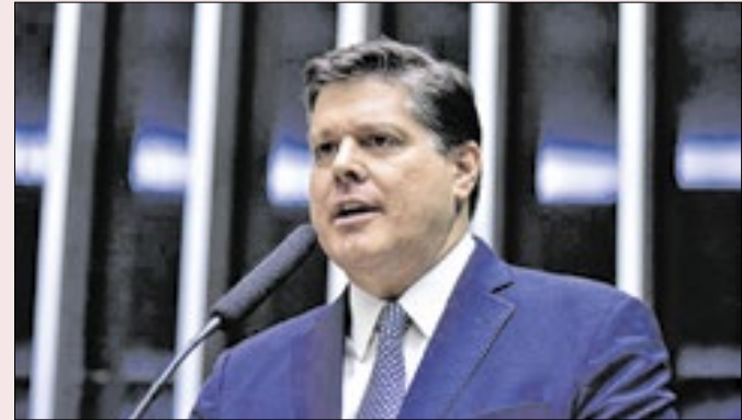
Presidente do MDB prefere reeleição de Tarcísio