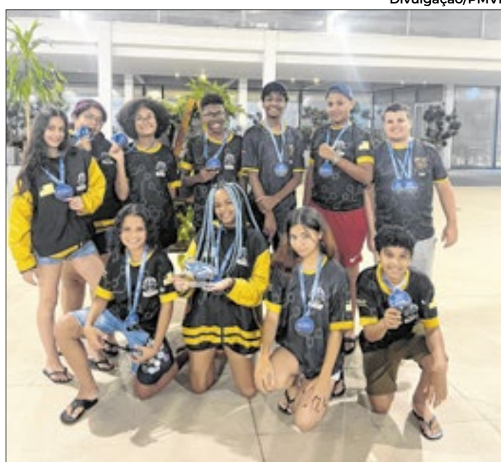
Alunos brilharam no First Lego League Challenge

"Essa conquista reforça o impacto transformador da robótica educacional na formação dos estudantes, promovendo habilidades técnicas, inovação e trabalho em equipe. A jornada da RVR Tecnobots