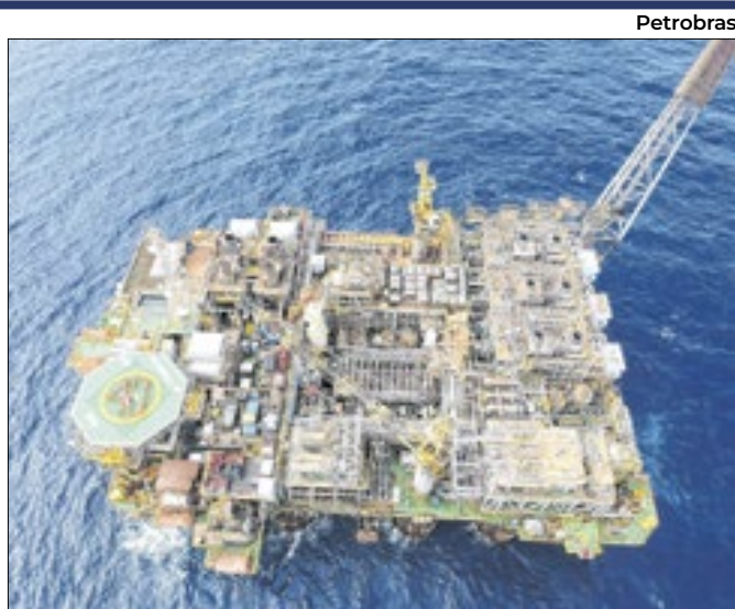
Demora na operação de plataformas causa adiamento