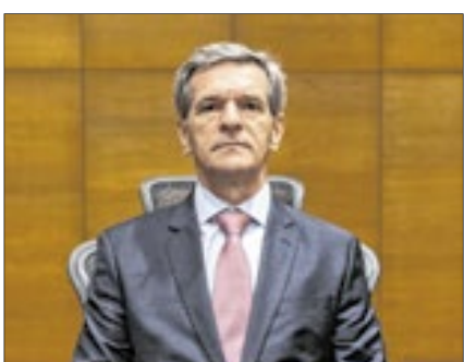
O ministro do STJ Marco Aurélio Bellizze Oliveira compôs a mesa da solenidade