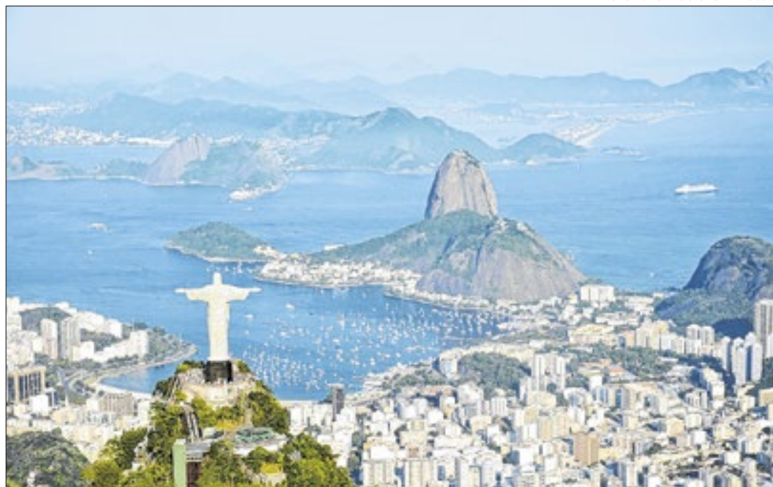
Cartão postal do Brasil para o mundo, 'Cidade Maravilhosa' reafirma sua importância turística

quim no cenário global, o turismo internacional no país, que apresentou crescimento expressivo este ano, em que os turistas estrangeiros foram responsáveis por uma injeção de US$ 3,7 bilhões na economia brasileira, somente no primeiro semestre do ano (1S24), o supera o recorde anterior, de 2014.