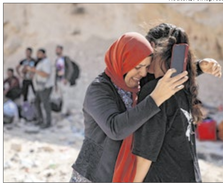
Síria vive guerra civil desde 2011 e agora rebeldes avançam

Vídeos publicados na agência de notícias Rádio e Televisão de Portugal mostram grupos invadindo o palácio presidencial sírio, onde Bashar