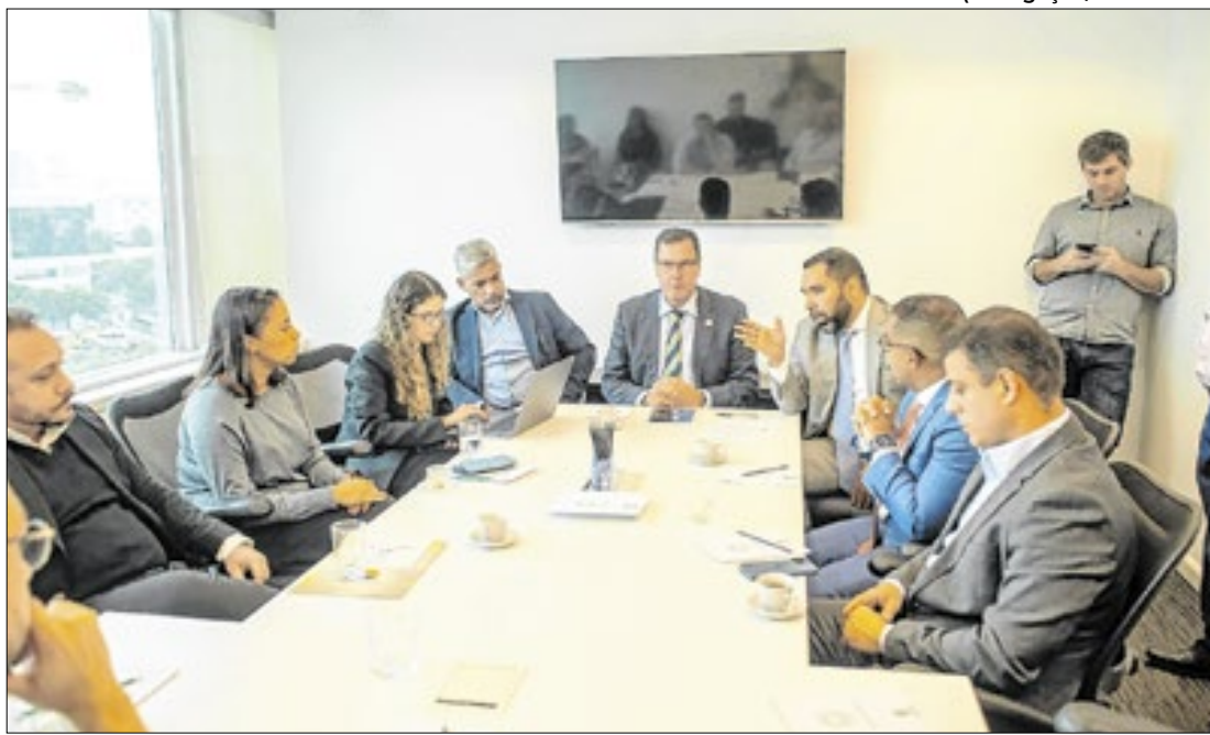
Representantes das concessionárias se reuniram com a SEDCON e o PROCON-RJ

São Gonçalo teve saldo positivo de 681 vagas de emprego segundo o último levantamento do Novo Caged, um aumento de 102,07% se comparado com outubro de 2023.