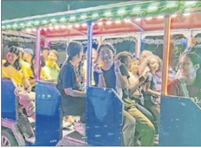
Clima natalino já contagia Queimados