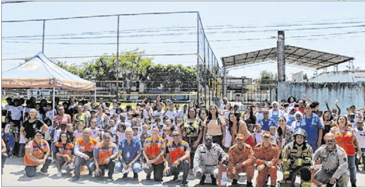
A ação, coordenada Secretaria Municipal de Defesa Civil, envolveu 6.039 participantes

treinamento possibilitou criar um ambiente mais seguro e uma comunidade escolar familiarizada com os procedimentos, garantindo que o local esteja preparado em caso de um incêndio real", pontua. O exercício busca orientar, treinar e capacitar alunos, funcionários e professores