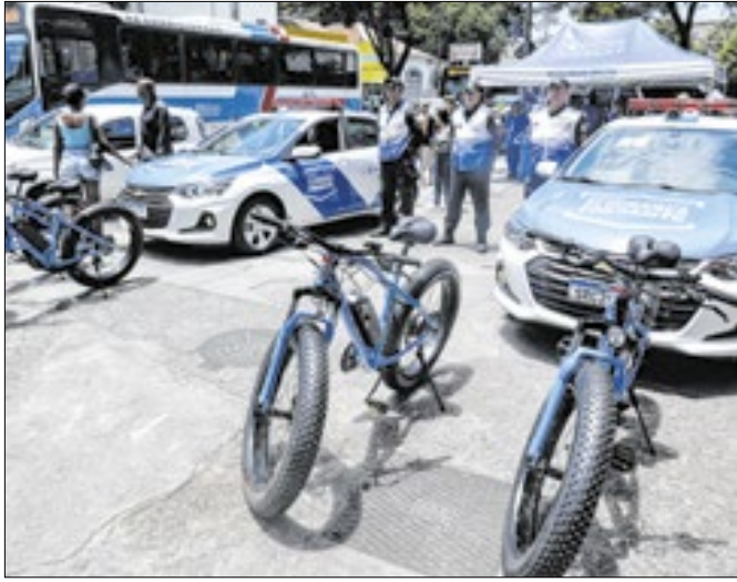
Nova base do Segurança Presente em Campo Grande