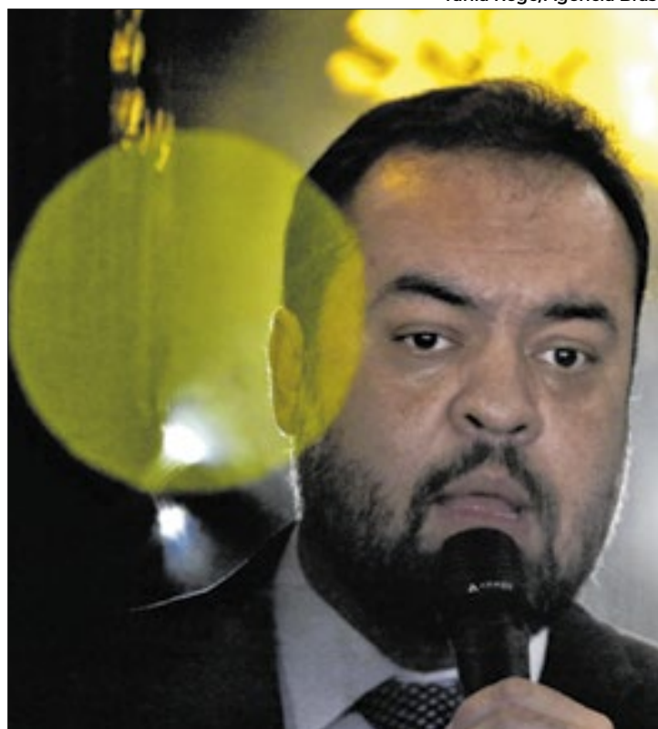
Claudio Castro deverá pressionar Câmara

O projeto já foi aprovado no Senado Federal e é de autoria do presidente da Casa, Rodrigo Pacheco (PSD-MG). Caso Luizinho faça alterações na matéria, o texto precisará