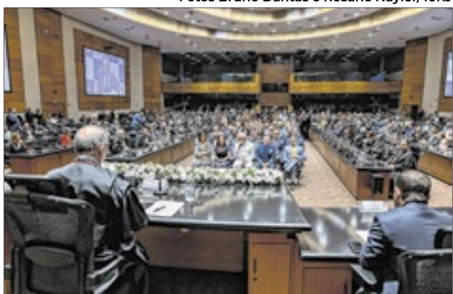
Plenário Ministro Waldemar Zveiter lida para celebração do Dia da Justiça