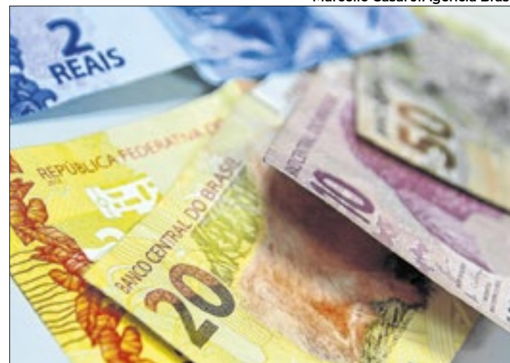
Objetivo é facilitar a regularização de dívidas tributárias

A Secretaria Municipal de Finanças, Planejamento, Desenvolvimento Econômico e Gestão foi designada para coordenar o programa, com poderes para ce-