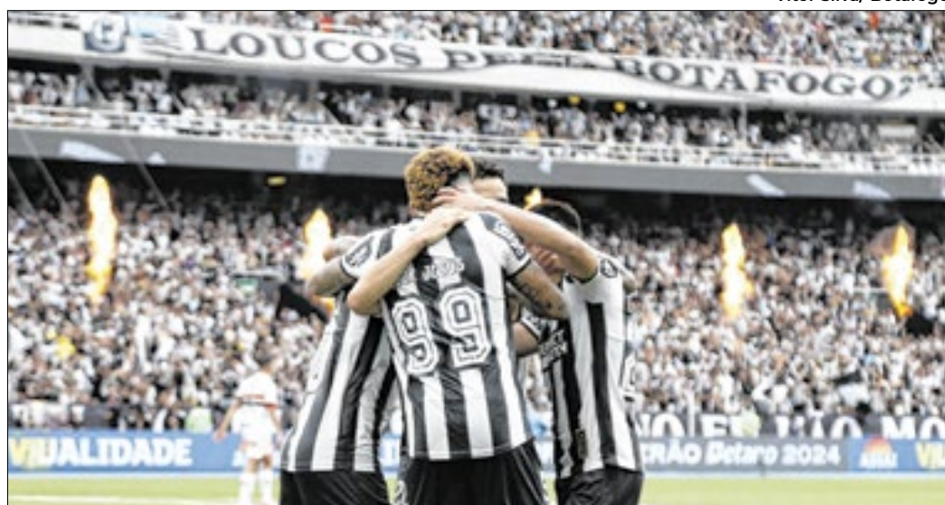
Vitor Silva/ Botafogo