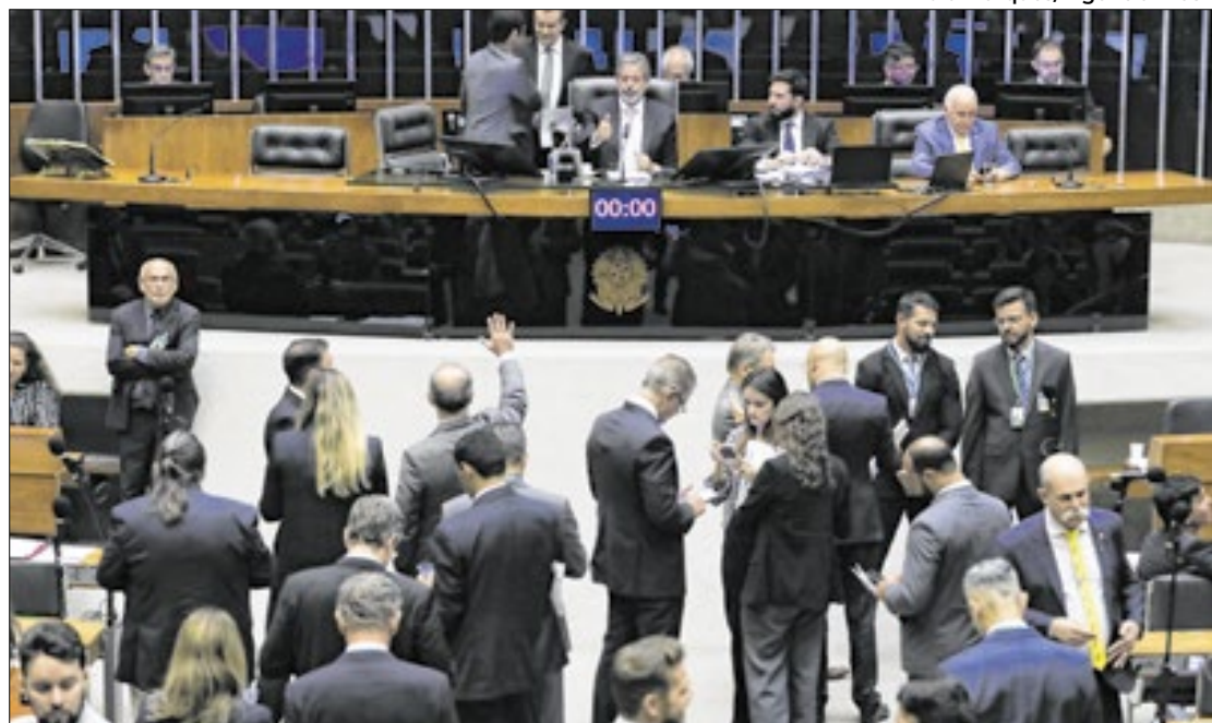
Urgência passou. Já o pacote exigirá novo empenho do governo

“A grande dificuldade vai ser a maneira que esse texto vai ser aprovado. O governo vai ter o trabalho de articular sua base. De certa forma [Lira] também vai estar interagindo com as bancadas para trazer à tona porque o tema não interessa somente ao