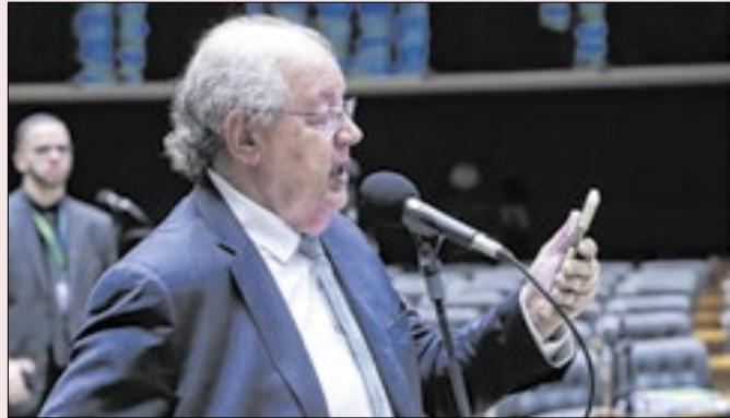
Haully: o que faz o mercado é “lesa-pátria”