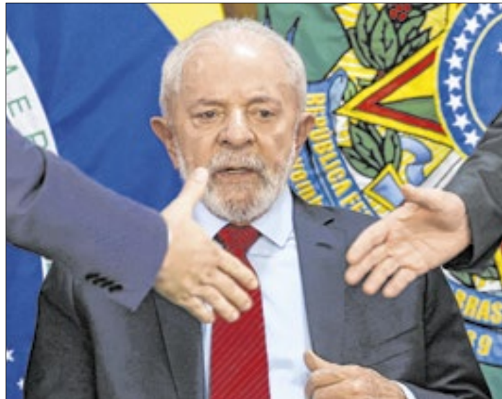
Falta de acordo sobre emendas dificulta vida de Lula

Dentre as exigências de Dino para liberar as emendas, que estavam suspensas de agosto, ele determina que as emendas só podem ser executadas após o solicitante ser identificado no Portal da Transparência. Os demais ministros da Corte aprovaram as medidas. Além disso, o magistrado determinou que as emendas