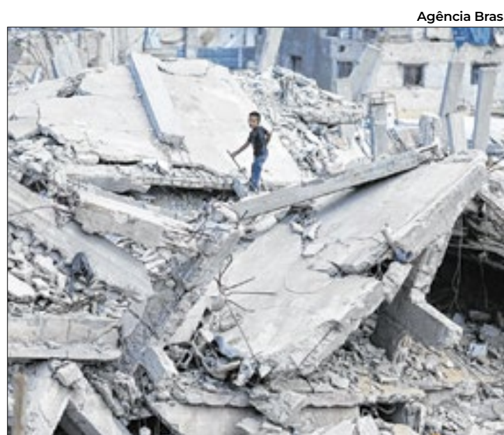
Por outro lado, Israel diz estar apenas se defendendo