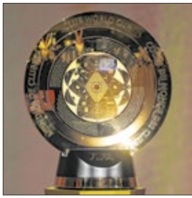
Torneio será o mais acessível

“Através deste acordo de transmissão, bilhões de fãs de futebol em todo o mundo agora podem assistir ao que será o torneio de clubes mais acessível de todos os tempos. E gratuitamente”, afirmou o presidente da Fifa, Gianni Infantino.