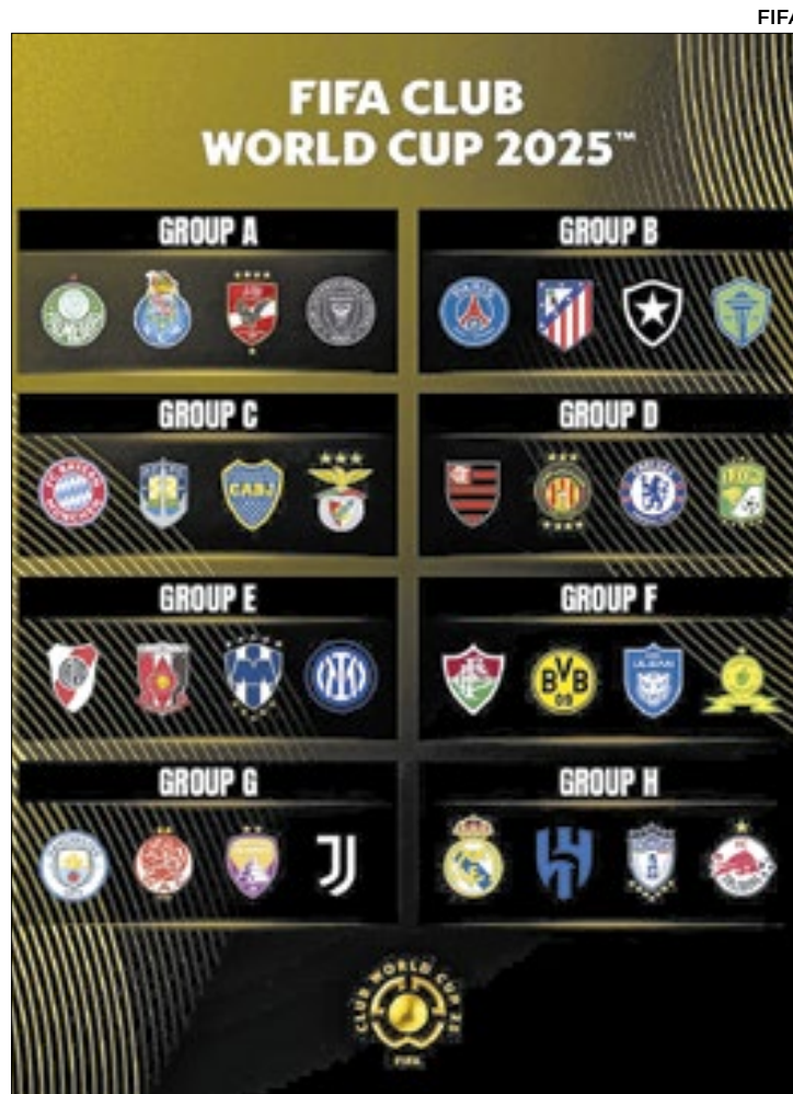
Brasileiros caíram em grupos possíveis de classificação

Atual campeão da Libertadores e único dos quatro brasileiros que não entrou como cabeça de chave no torneio, o Botafogo está no grupo B, considerado o da morte pela presença de dois grandes europeus —Paris Saint-Germain (França) e Atlético de Madrid (Espanha)—, além do Seattle Sounders (Estados Unidos). O Flamengo, vencedor da