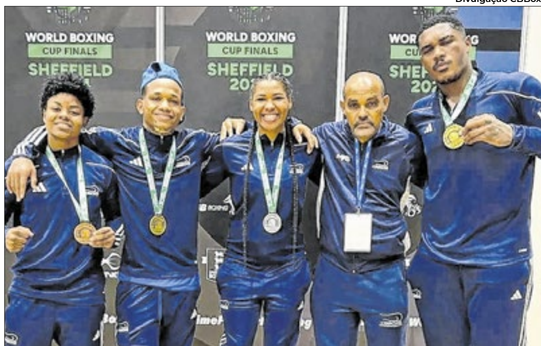
Bahia conquista quatro das nove medalhas que levaram o Brasil ao título

Brasil fatura nove medalhas no torneio na Inglaterra