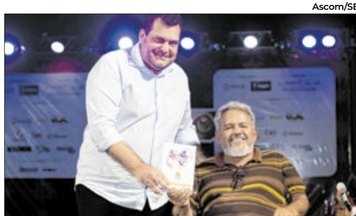
Secretaria da Saúde recebe prêmio 'Espírito da Atitude'

A Fábrica 01, destinada à montagem de veículos, já tem 80% das fundações concluídas, enquanto a pista de testes avança nas etapas de drenagem e terraplenagem. Com investimento inicial de R$ 5,5 bilhões, podendo chegar a R$ 6,5 bilhões, o projeto reaproveitará estruturas existentes e terá expansão sustentável, com estudos ambientais em andamento. "O complexo será um marco fora da China, refletindo nosso compromisso com tecnologias limpas e sustentáveis", destacou Stella Li.