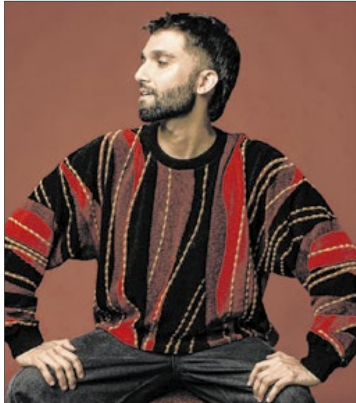
O cantor, compositor, produtor e multi-instrumentista Silva

Com uma carreira marcada por seis álbuns autorais e turnês nacionais e internacionais, Silva é conhecido por suas composições que transitam entre diferentes estilos musicais,