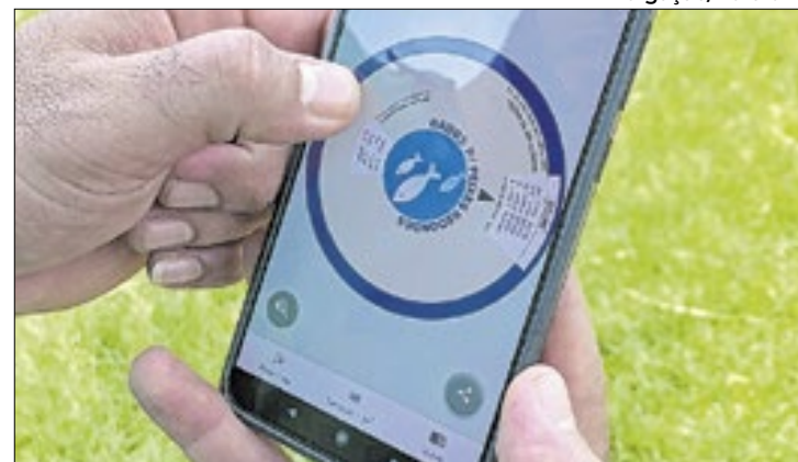
Ferramenta oferece dados para aumentar produção