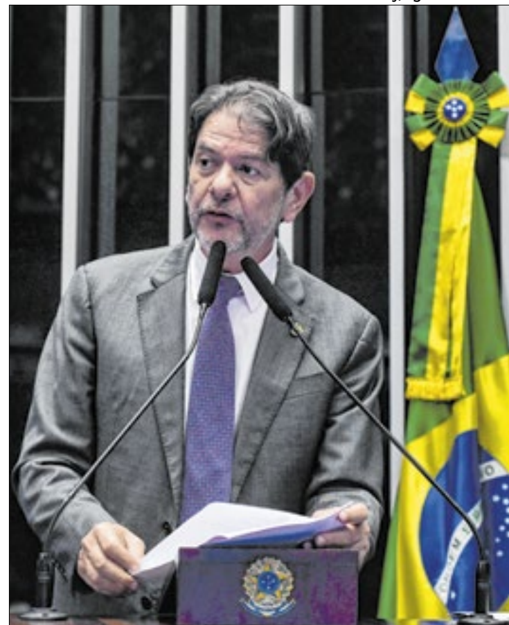
Cid Gomes manteve o texto para que fosse à sanção presidencial