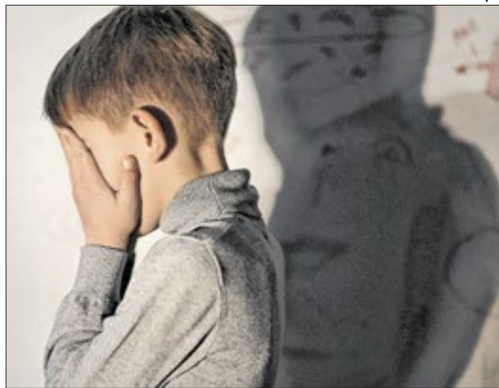
Estudantes de 4º e 8º ano responderam à questionários

Estão incluídos nesse tipo de violência apelidos pejorativos, expressões preconceituosas, isolamento social, insultos e até mesmo ataques físicos. Pode ocorrer tanto nas escolas