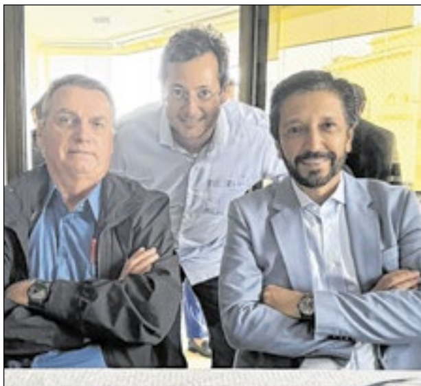
O ex-presidente Jair Bolsonaro almoçou com o prefeito de São Paulo, Ricardo Nunes, nesta quarta (4) na casa de Fábio Wajngarten. Na foto, o anfitrião ladeado pelos dois políticos

“Além disso, uma saída massiva de magistrados ameaça agravar profundamente o congestionamento de processos no país, que, atualmente, soma um alarmante número de 84 milhões de processos em tramitação. Sem um quadro funcional adequado, o Judiciário enfrentará dificul-