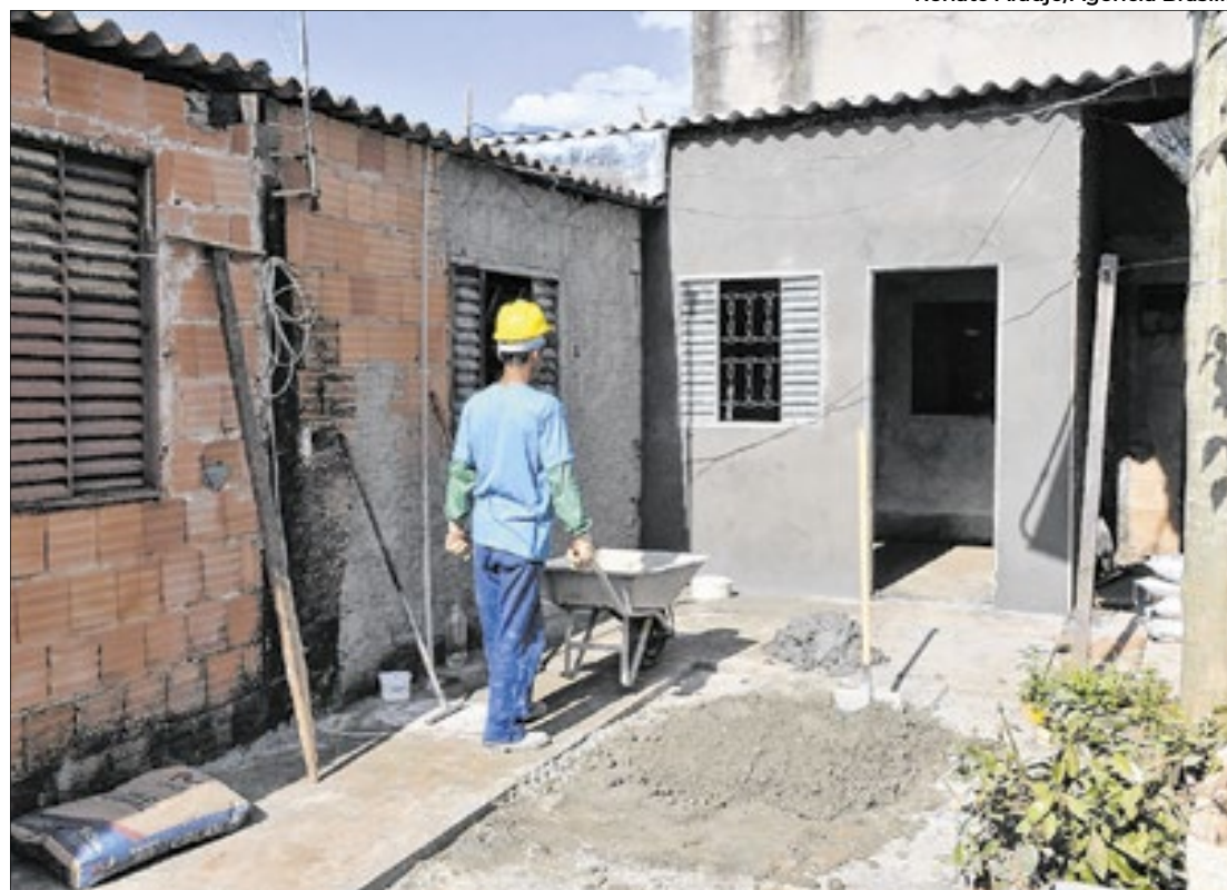
Imposto para imóvel novo fica reduzido para 1% do valor total

A Bancada do Partido do Trabalhadores (PT) criticou a diferenciação. Os distritais argumentaram que não é justo para quem não pode comprar imóvel novo, na planta, e apresentou emenda propondo unificar tudo em 1%. Mas a proposta não foi aprovada.