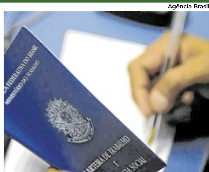
O setor de Serviços retomou a liderança em vagas