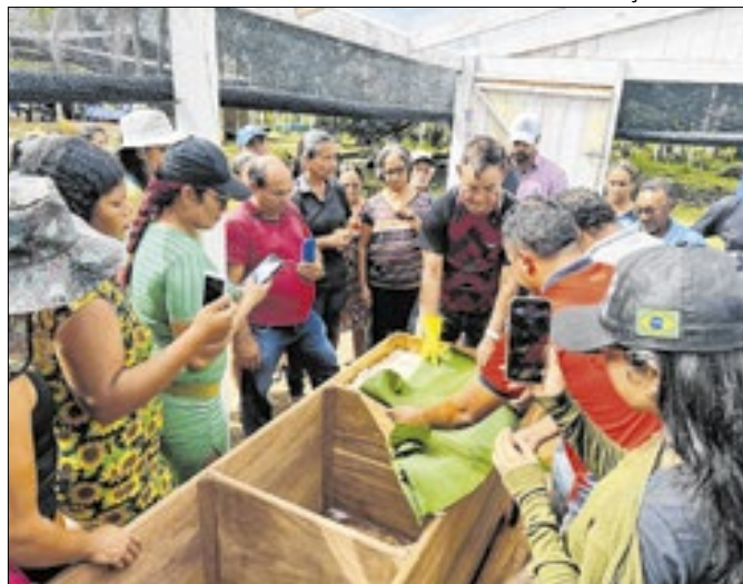
Produtores recebem insumos e apoio técnico