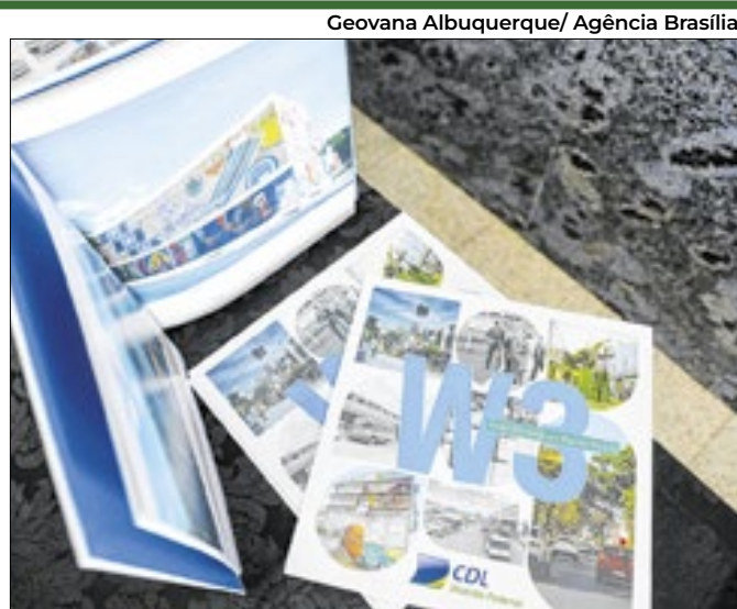
Publicação reúne mudanças da avenida símbolo do DF