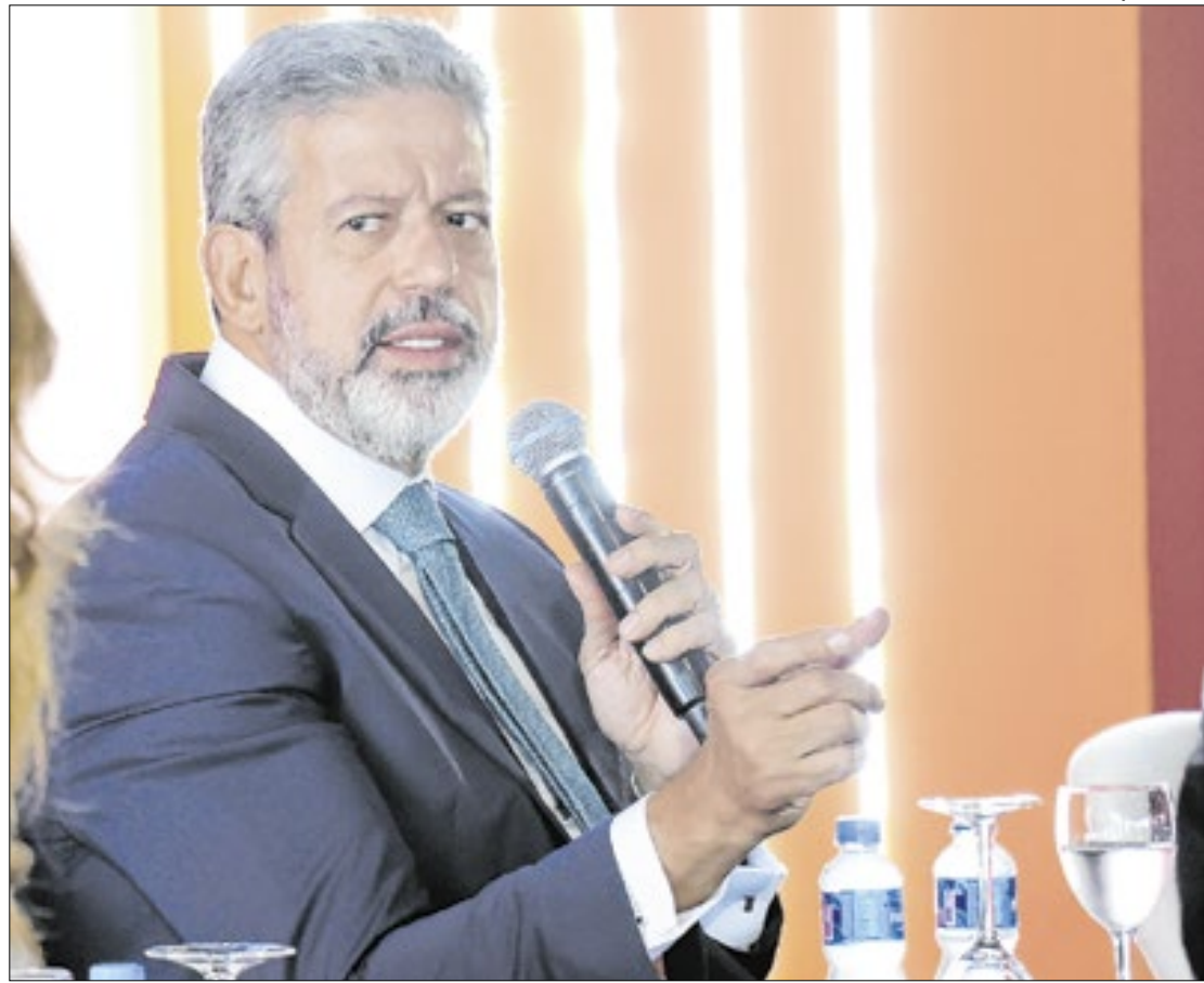
Lira: sozinho, o governo não tem força para aprovar a PEC

Se aprovado da forma como se encontram os proje-