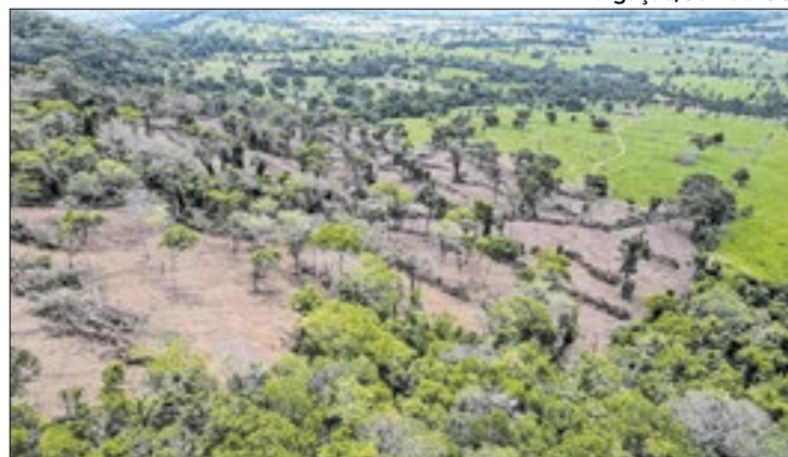
Tecnologias de monitoramento remoto têm sido essenciais