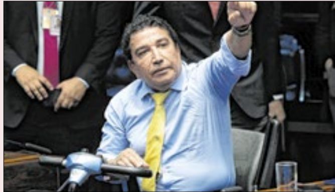
Malta reclama: falta de compromisso nas sabatinas