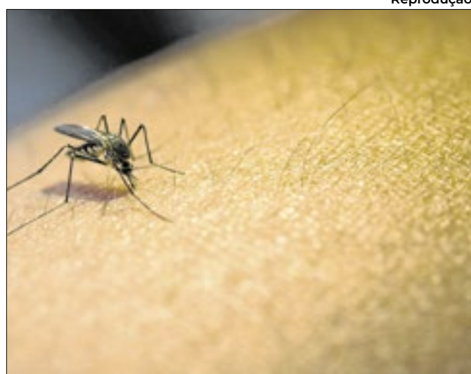
Pelo menos 5.872 mortes causadas pela doença