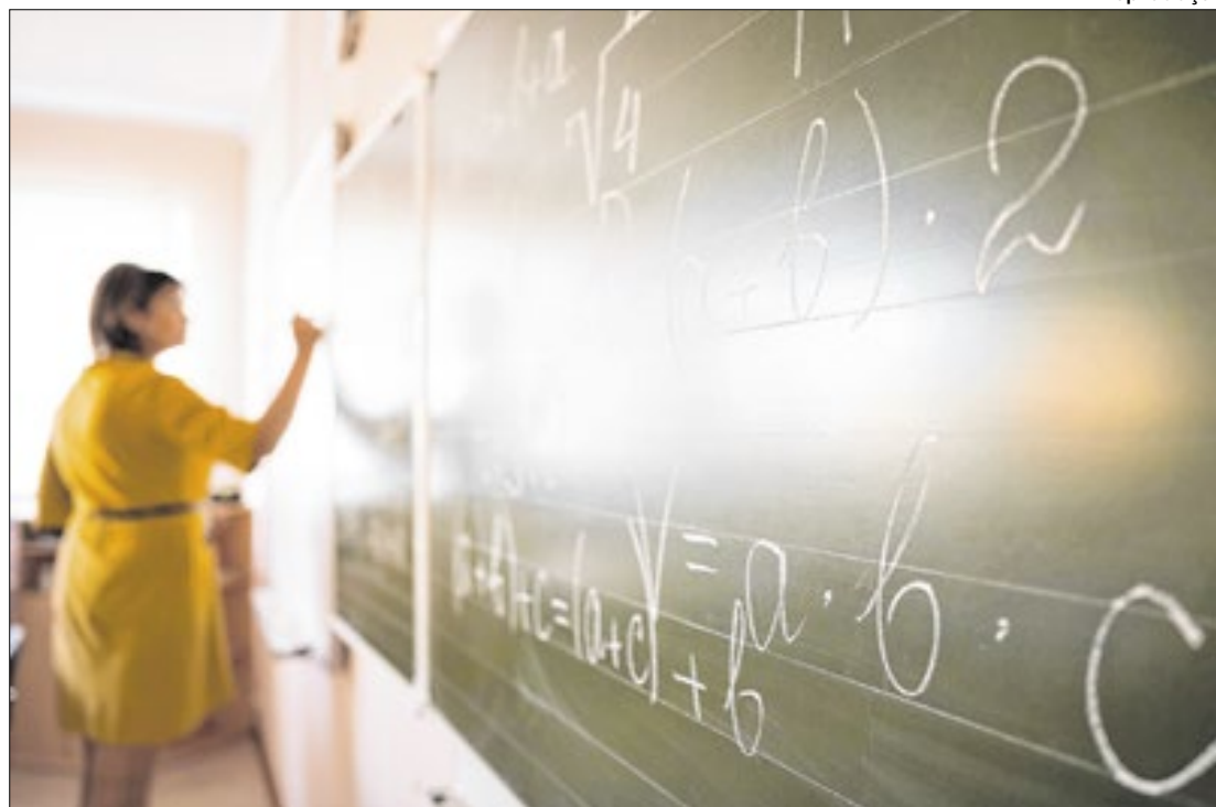
Esses estudantes estão abaixo do nível considerado baixo

O estudo avalia o desempenho de estudantes em ciências