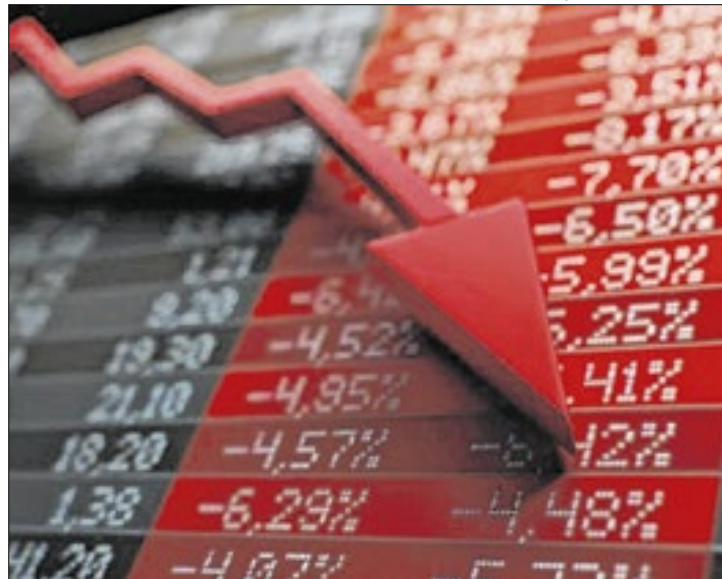
Votação mais 'célere' de pacote fiscal não 'segura' bolsa

A piora pontual em Petrobras a partir do meio da tarde foi decisiva para a falta de fôlego do Ibovespa em direção ao fechamento, em dia já bem negativo para a ação de maior peso no índice, Vale ON. Além da queda de 1,8% a 2% para o petróleo em Londres e Nova