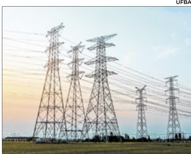
Subestação São José, na Baixada, receberá R$ 170 mi