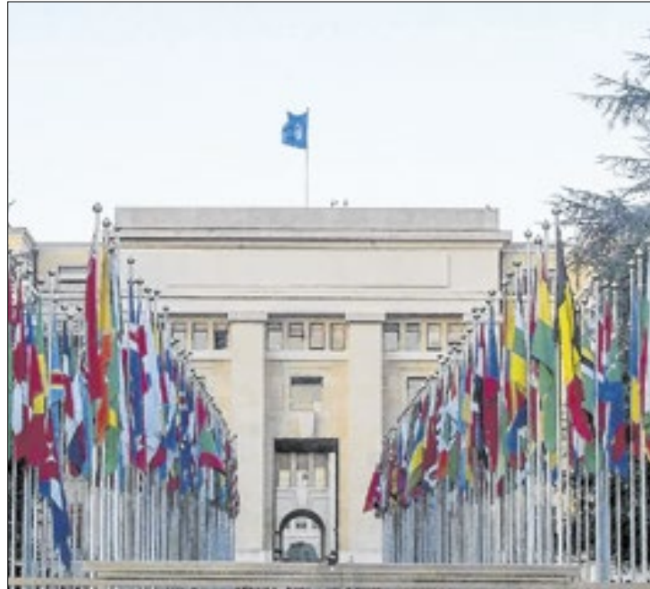
ONU aprova debate com votos contrários de Israel e dos EUA

“A Conferência adotará um documento final orientado para a ação intitulado ‘Re-