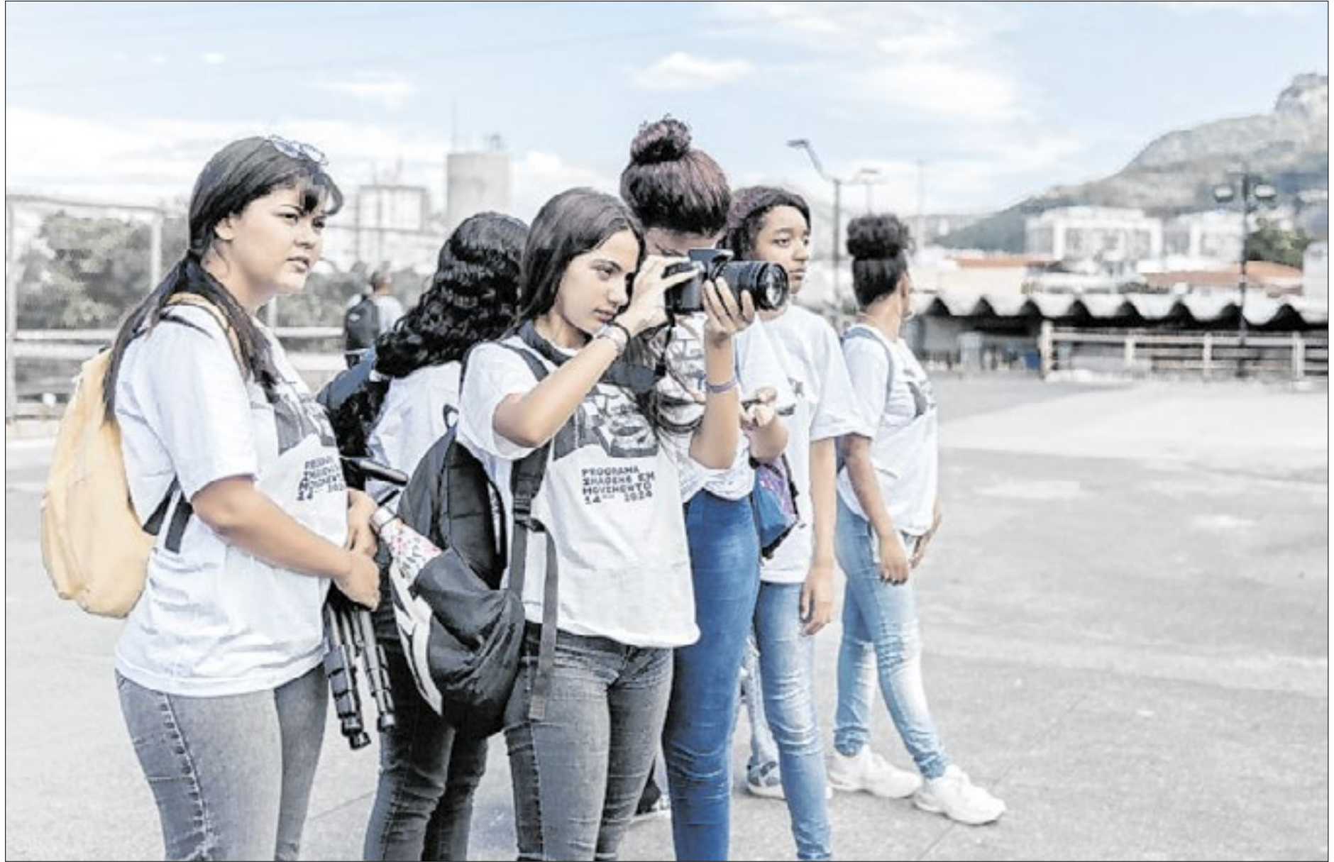
Jovens da C.E.Profa. Maria Nazareth Cavalcanti Silva fazendo as filmagens

Em junho de 2024, duas estudantes das oficinas de cinema do PIM participaram do encontro internacional 'À nous le cinéma!' em Lisboa,