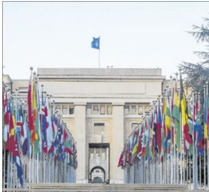
ONU aprova debate com votos contrários de Israel e dos EUA

“A Conferência adotará um documento final orientado para a ação intitulado ‘Re-