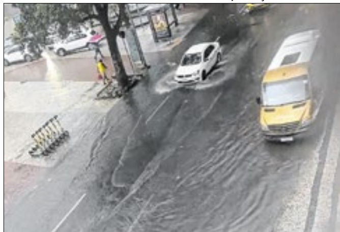
Pontos de alagamento das vias exigem maior atenção