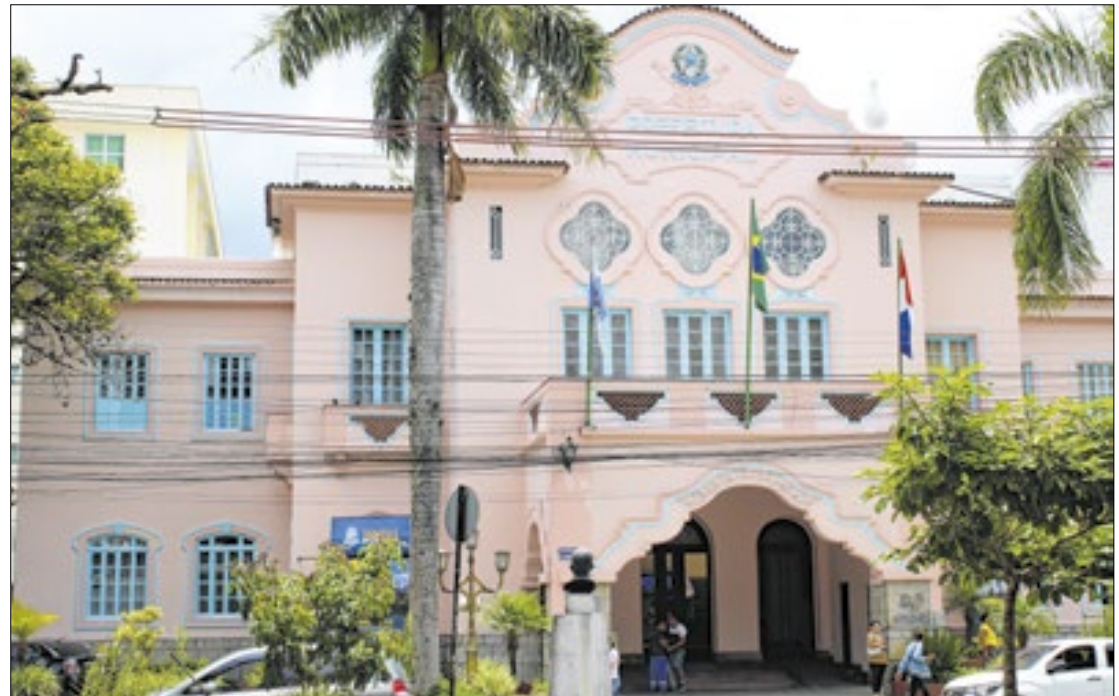
Documento estabelece os procedimentos a serem cumpridos pelos órgãos municipais

"Assumimos a Prefeitura em julho de 2018 e, investindo em novas práticas e ferramentas de gestão, em setembro de 2019 lançamos o Sistema de Integridade Pública Responsável e Transparente do Poder Executivo Municipal. Com 11 eixos estratégicos, o Sistema de Compliance tem um código de conduta para nortear o comportamento de todos os integrantes da administração pública. Ao longo de seis anos de gestão seguimos com iniciativas para colocar efetivamente em prática a legislação de Acesso à Informação, de Transparência, de Dados Abertos e da