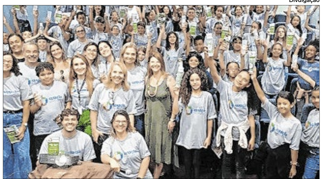
Projeto integra o Programa Municipal de Educação

Durante o evento, foram apresentados os resultados expressivos alcançados ao longo do ano, com destaque para as premiações: