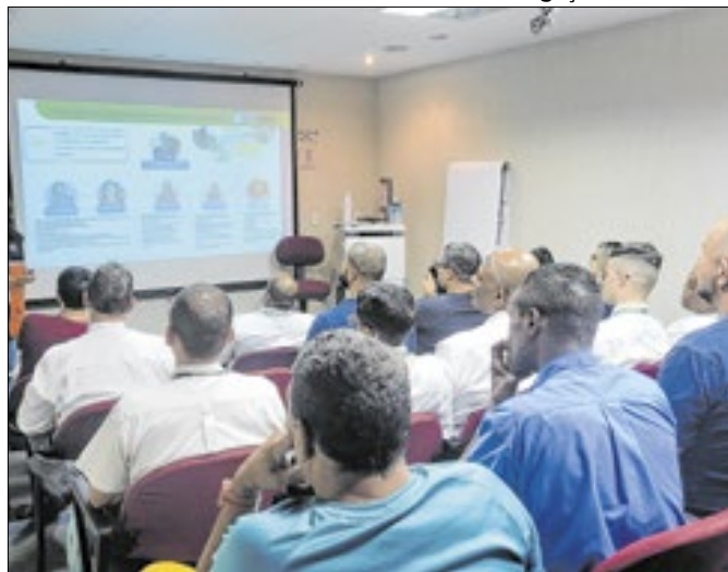
Ação visa preparar rodoviários para o verão 2024-2025