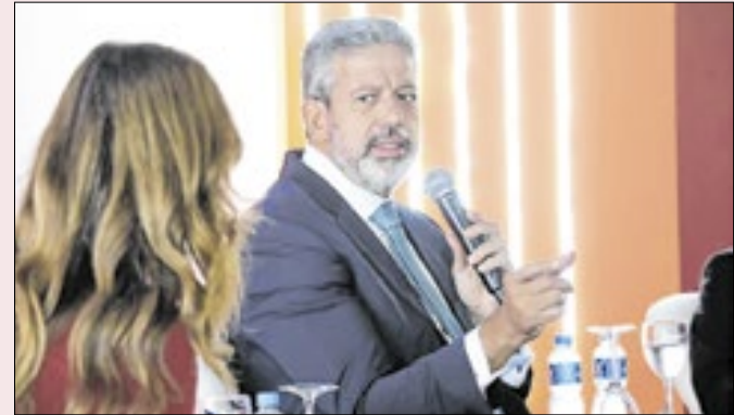
Arthur Lira voltou a criticar o Supremo