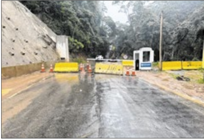
Equipes vão monitorar as condições da rodovia