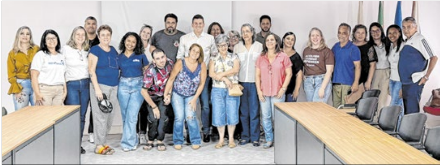
Atenção ao idoso foi um dos pontos destacados na reunião desta terça-feira (03), que foi realizada na sede da Firjan

diovisual, comunicação, produção cultural, artes periféricas, inovações tecnológicas e novos talentos. Os vencedores do prêmio de 2024 serão conhecidos no dia 17, durante a programação do Natal Imperial. A solenidade acontece às 19h, no Palácio de Cristal, com entrada franca.