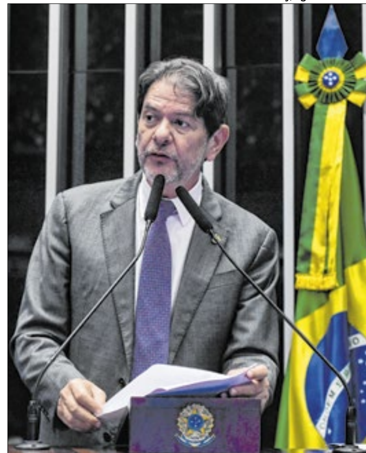
Cid Gomes manteve o texto para que fosse à sanção presidencial