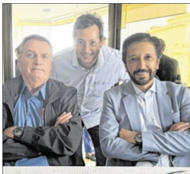
O ex-presidente Jair Bolsonaro almoçou com o prefeito de São Paulo, Ricardo Nunes, nesta quarta (4) na casa de Fábio Wajngarten. Na foto, o anfitrião ladeado pelos dois políticos

"Além disso, uma saída massiva de magistrados ameaça agravar profundamente o congestionamento de processos no país, que, atualmente, soma um alarmante número de 84 milhões de processos em tramitação. Sem um quadro funcional adequado, o Judiciário enfrentará dificul-