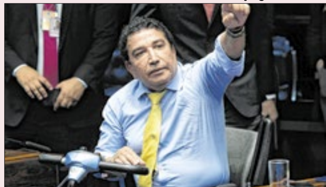
Malta reclama: falta de compromisso nas sabatinas