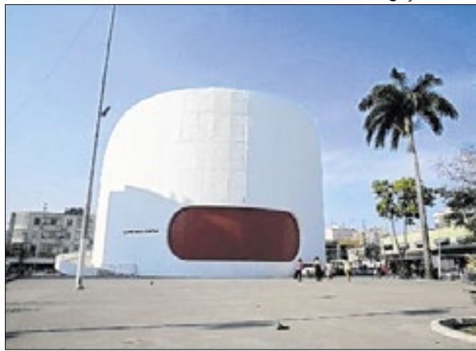
Teatro Raul Cortez, localizado na Praça do Pacificador