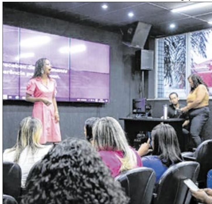
Estratégias contra a violência de gênero foram debatidas