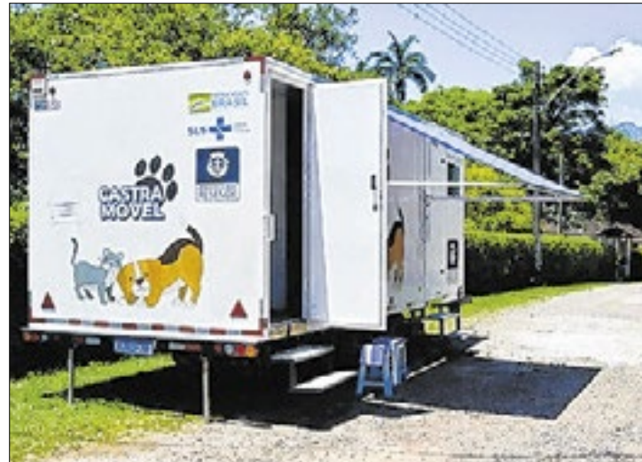
O Centro de Controle de Zoonoses segue fazendo cirurgias