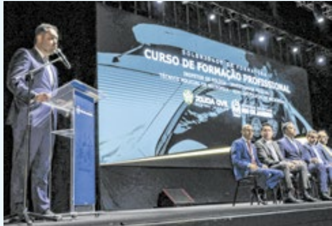
Governador participou de formatura da Polícia Civil