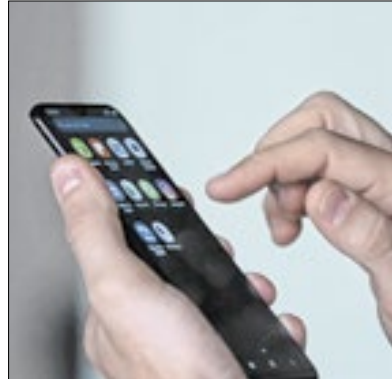
Cadastramento dos aposentados

A partir desde mês de dezembro de 2024, a Prefeitura de Nova Friburgo promove o recadastramento anual obrigatório dos seus servidores aposentados e pensionistas vinculados ao regime próprio de previdência social.