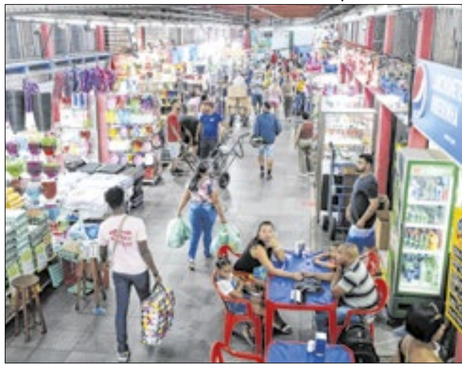
Movimento de consumidores no Mercado de Madureira