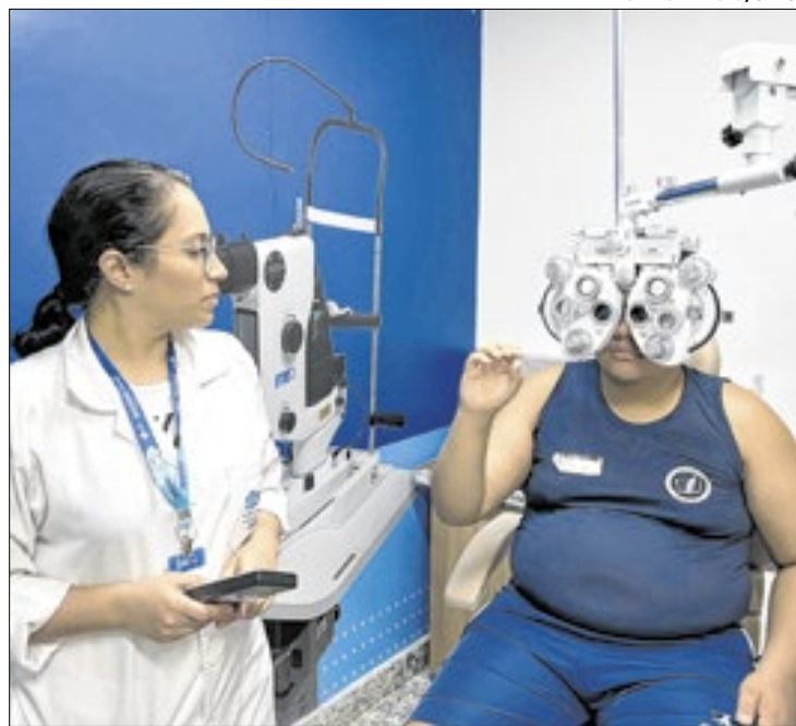
Atendimentos foram em parceria com o INES

tância da necessidade de acessibilidade a serviços de oftalmologia. Muitos membros da comunidade surda não estão cientes da importância de exames regulares e da necessidade de receber o diagnóstico precoce. Os atendimentos, ocorridos desde agosto, têm sido fundamentais para apoiar o INES em sua missão inclusiva e enriquecer o aprendizado do CCO no atendimento a pacientes surdos. Neste sábado, 30 de novembro, foi realizado o último dia de atendimento.