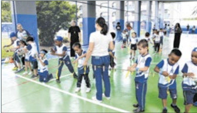
Município conquistou selo ouro ao cumprir critérios do edital