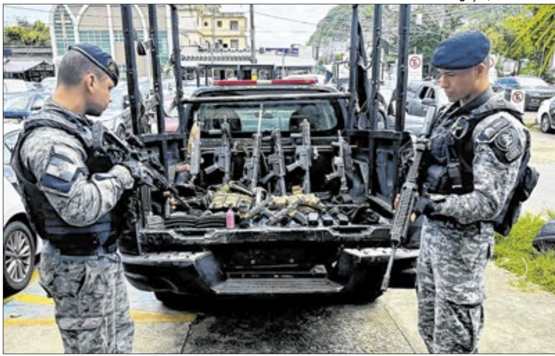
600 fuzis foram retirados de criminosos e bate recorde de apreensões de armas de guerra

16h, na Sala do Empreendedor, no Partage Shopping, Centro. O programa disponibiliza regularização de débitos para MEI, inscrição municipal e cadastro para MEI e também vagas emprego. Nesta edição, o Oportunidades terá 56 vagas em diversos cargos.