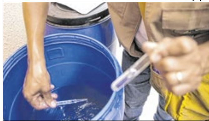
Monitoramento da água é feito por equipe da Vigiágua