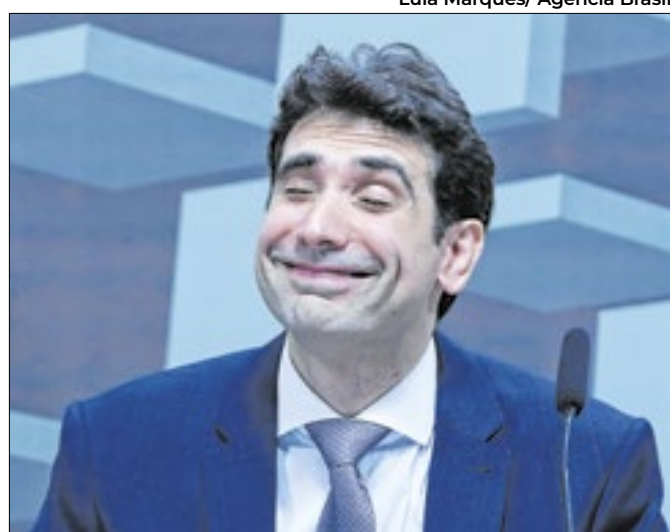
Diretores sem tempo para o ritual feito por Galípolo