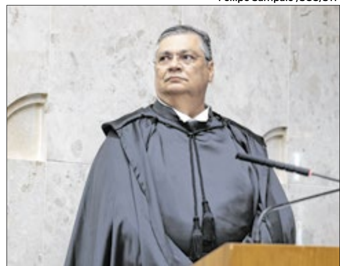
Dino fez novas exigências para liberar emendas