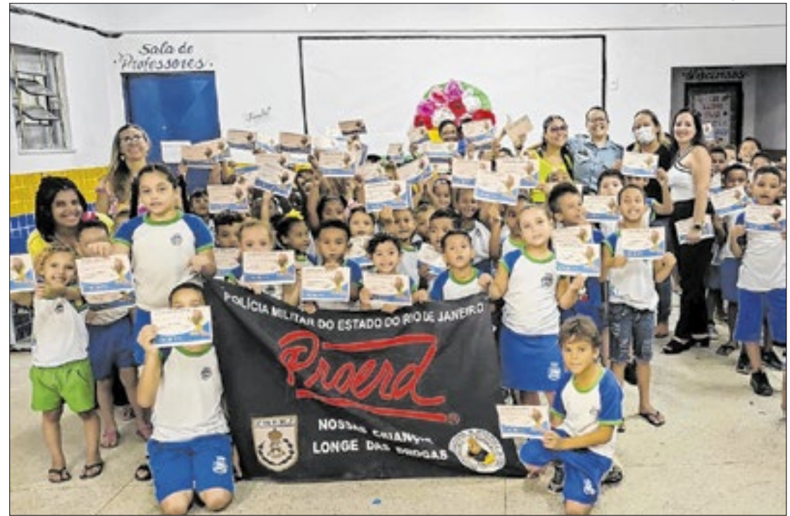
350 estudantes concluíram o curso que tem como objetivo prevenir o uso de drogas

"A importância maior do projeto é o pensamento de fu-