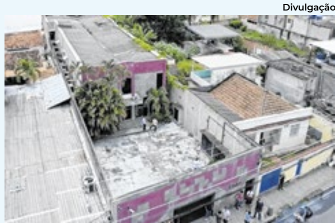
Clínica deverá ser construída na Rua Elizeu de Alvarenga

funcionais, ampliando, por exemplo, a oferta de banheiros no local. O teatro foi reaberto com segurança aprimorada. Portas corta-fogo foram instaladas nas saídas da plateia para facilitar a evacuação em caso de incidente.