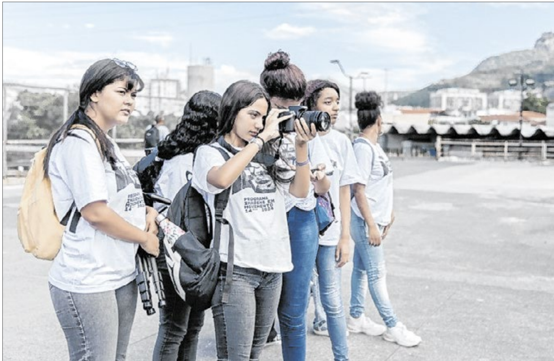
Jovens da C.E.Profa. Maria Nazareth Cavalcanti Silva fazendo as filmagens

Em junho de 2024, duas estudantes das oficinas de cinema do PIM participaram do encontro internacional 'À nous le cinéma!' em Lisboa,