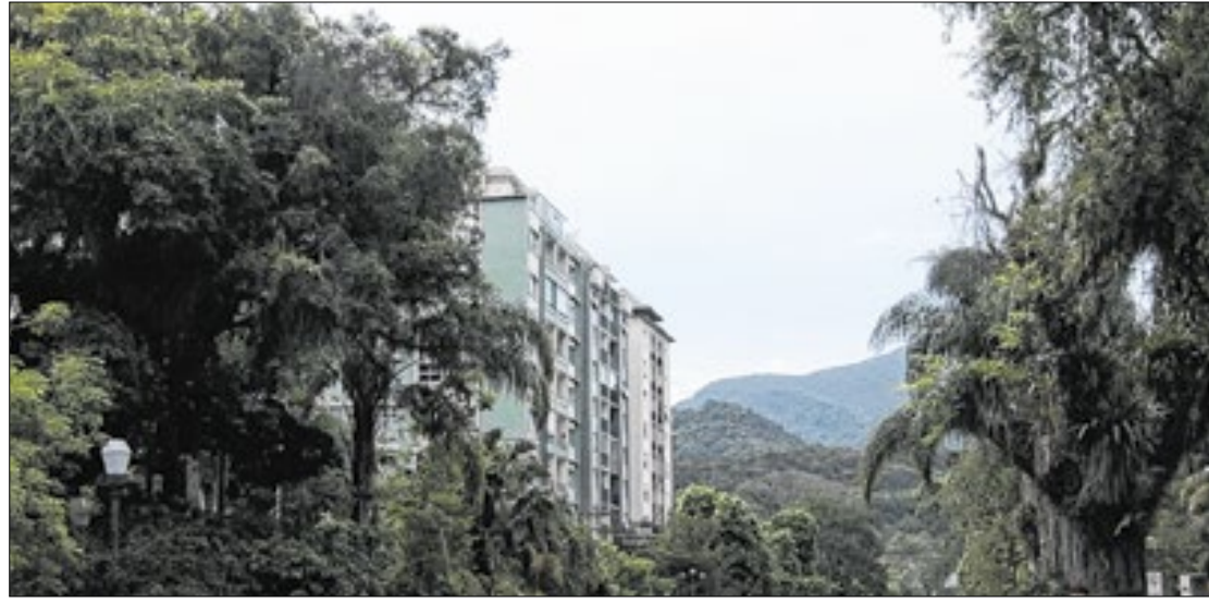
Expectativa é de chuva dentro da média histórica na Região Sudeste

A previsão é de que a chuva diminua na quinta-feira (5) e que o tempo comece a melhorar, com o sol aparecendo