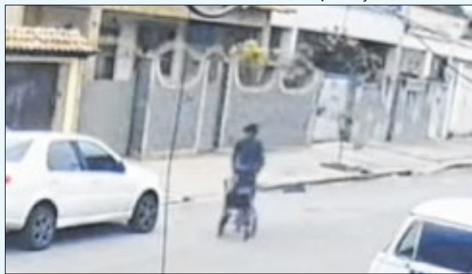
Cúmulo da desumanidade foi flagrado por câmeras