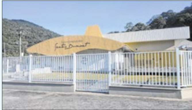
Laboratório Nacional de Computação Científica (LNCC)