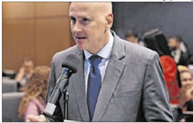
Tande mantém uma parte de equipe de Balleiro