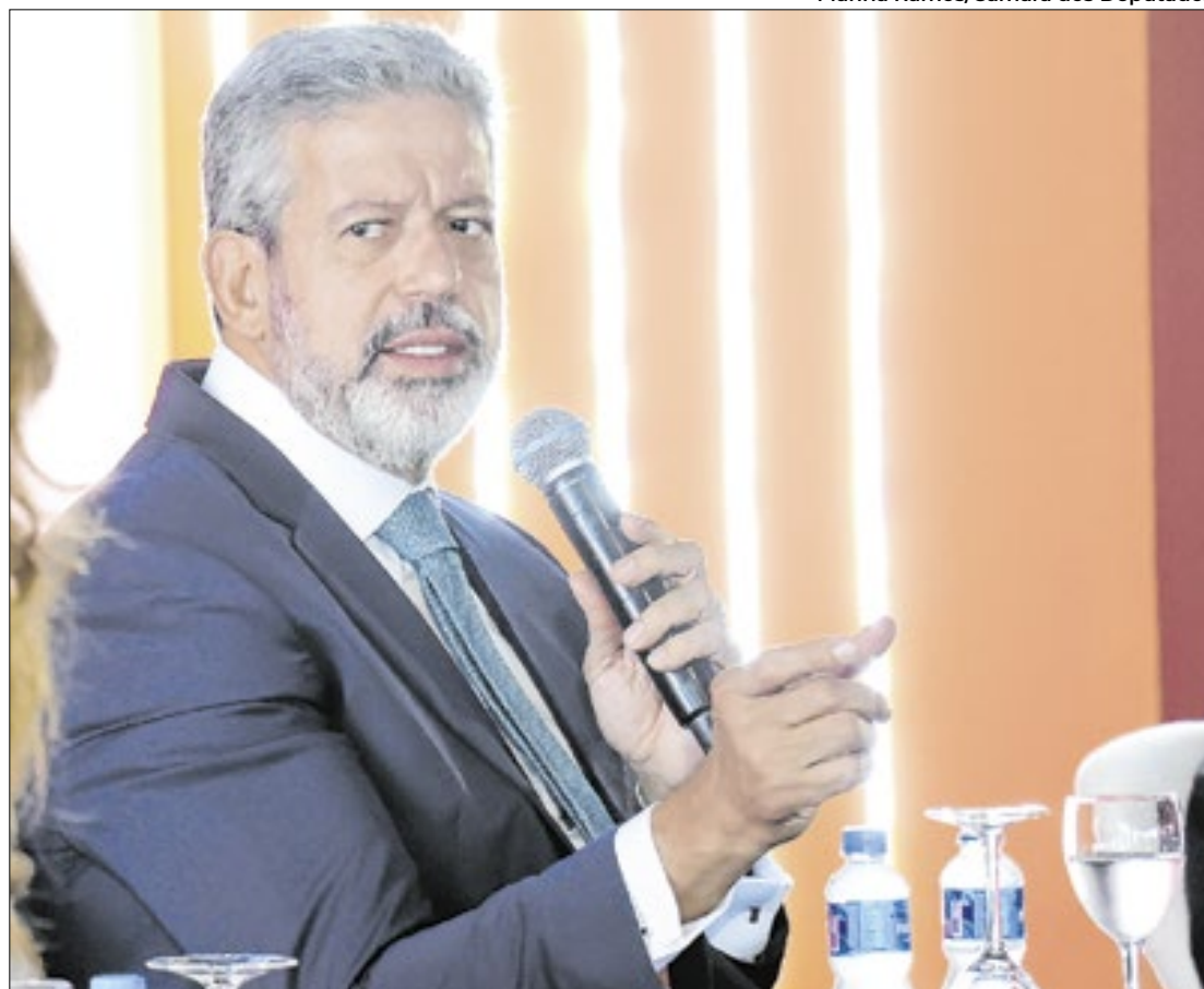
Lira: sozinho, o governo não tem força para aprovar a PEC

Se aprovado da forma como se encontram os proje-