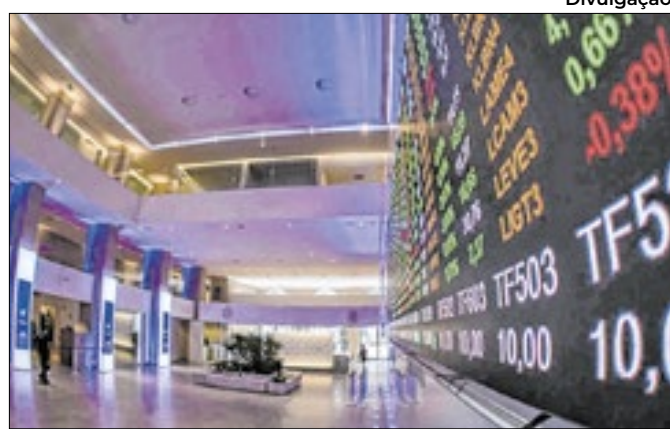
Decisão favorável elevam ações na Bolsa