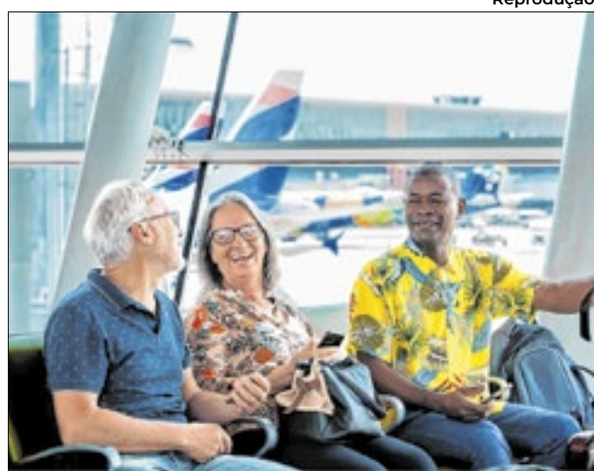
Iniciativa permite a compra de bilhetes por até R$ 200