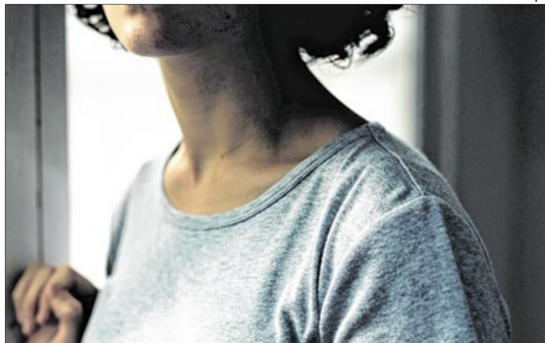
Em cada dez brasileiras negras, oito conhecem pouco sobre a lei

As mulheres negras são as principais vítimas da violência de gênero, conforme destacam pesquisas complementares, como as do Fórum Brasileiro de Segurança Pública (FBSP).