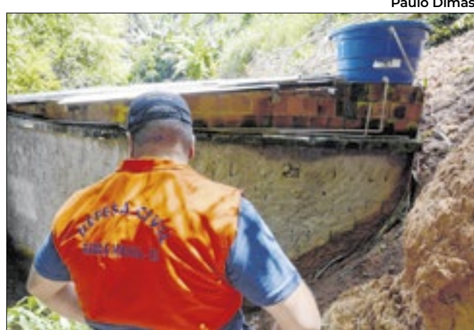
Os dias 3 e 4 de dezembro podem ter grandes chuvas