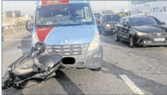
Colisão múltipla no Gasômetro deixou seis feridos