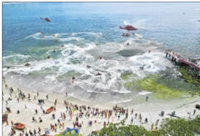
Operação organizou ações interativas com o público