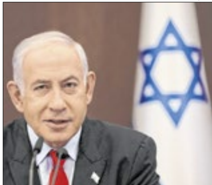
Netanyahu acusado de crimes

O ex-ministro da Defesa de Israel, Moshe Yaalon, acusou o governo do primeiro-ministro Benjamin Netanyahu de promover uma limpeza étnica no norte da Faixa de