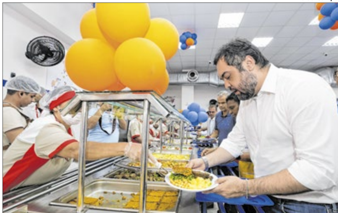
Reabertura do Restaurante do Povo Madre Teresa de Calcutá, em Nova Iguaçu

Localizado na Av. Gov. Amaral Peixoto, S/N, o Restaurante oferecerá mil cafés da manhã e 2 mil almoços. O espaço tem capacidade de 180 lugares, climatizado com ar condicionado central, e oferecerá refeições preparadas de forma balanceada e nutritiva por nutricionistas.