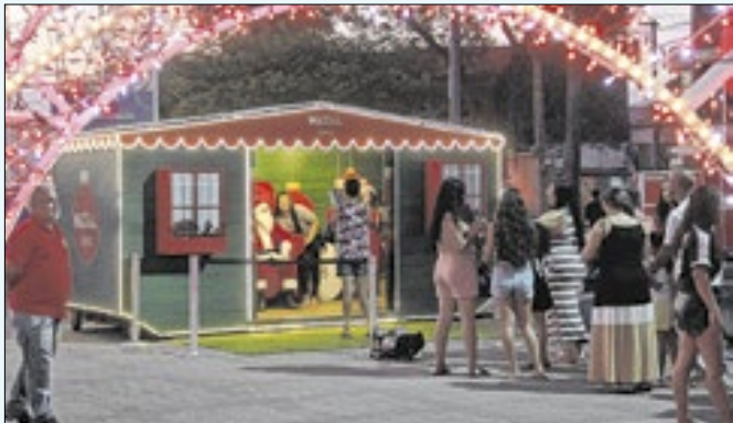
Casinha do Papai Noel permaneceu no local no domingo