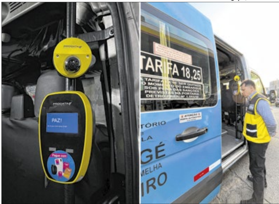
Vans intermunicipais que circulam no Estado vão contar com validador biométrico facial

Zona Norte da cidade. Eles foram agradecer ao chefe do Executivo a oportunidade de poderem participar de todas as atividades esportivas. O prefeito leu a carta de agradecimento dos pequenos desportistas que comemoraram o fato do projeto ter mudado a vida de muitos no bairro.