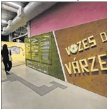
Exposição no Museu do Futebol