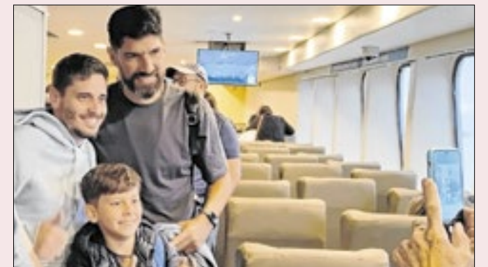
O ex-jogador atendeu pedidos de fotos no barco