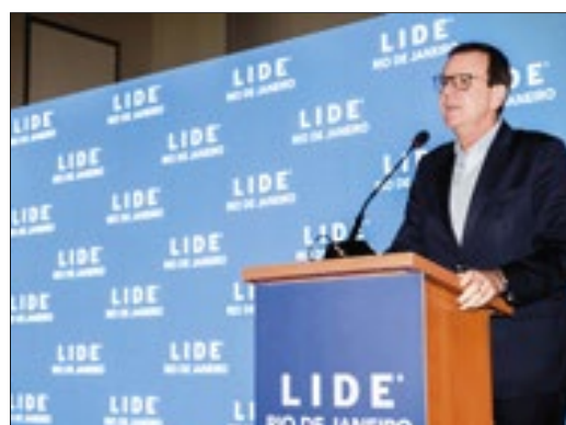
Durante o encontro, o prefeito reeleito da cidade do Rio de Janeiro, Eduardo Paes, falou sobre os planos para o novo mandato