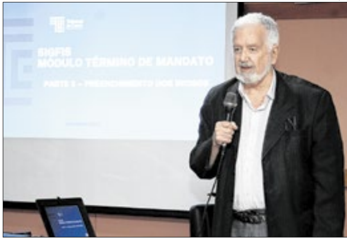
Objetivo é trabalhar o novo sistema da Deliberação