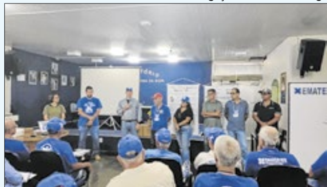
Evento marcou o Dia Especial da Agroecologia