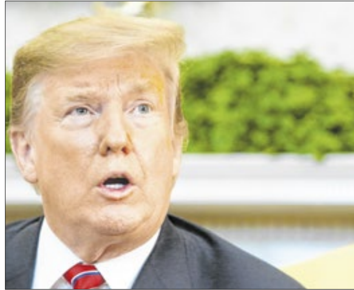
Trump: “Não há chance de que o Brics substitua o dólar”

“A perda do poder do dólar implica uma perda do poder dos Estados Unidos, do poder imperial sobre o mundo. Se a gente pensar que os Estados