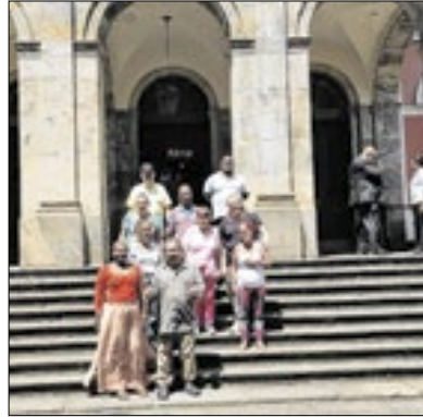
Visita ao Museu Imperial