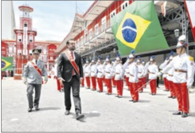
Castro participou de Solenidade no Quartel Central