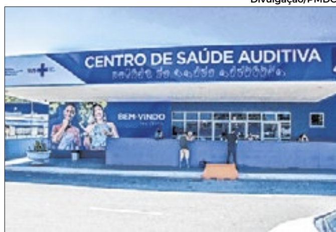
Unidade foi inaugurada em agosto de 2018