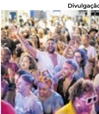
Samba da Jurema

dos anos como um evento que transcende o simples entretenimento. Para a comunidade local, ele se tornou um símbolo de resistência cultural e de luta pela preservação das tradições afro-brasileiras. Além disso, o evento simboliza a luta contínua contra o racismo e a marginalização das culturas afro-brasileiras.