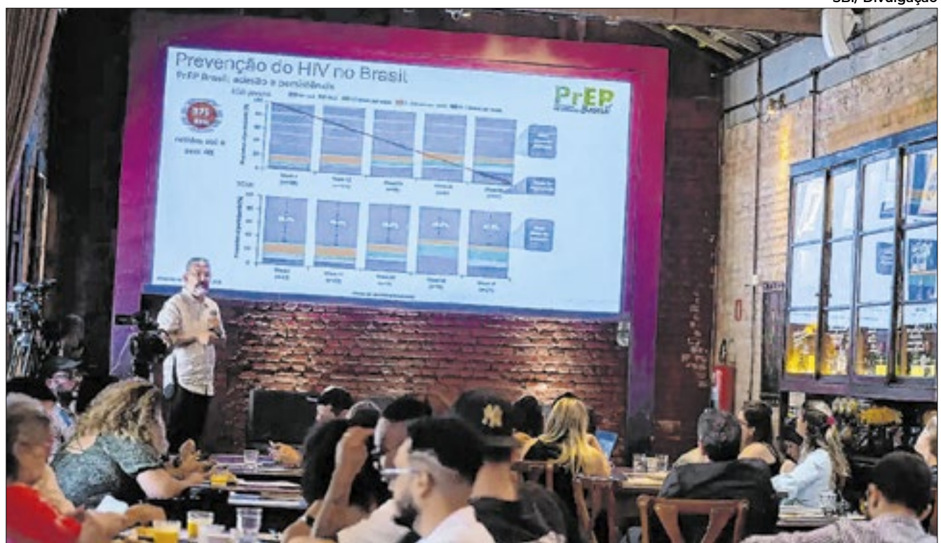
Material é da Sociedade Brasileira de Infectologia

registrados 1.124.063 casos de aids no Brasil. O boletim destaca que, em média, houve 35,9 mil novos casos de aids nos últimos cinco anos.