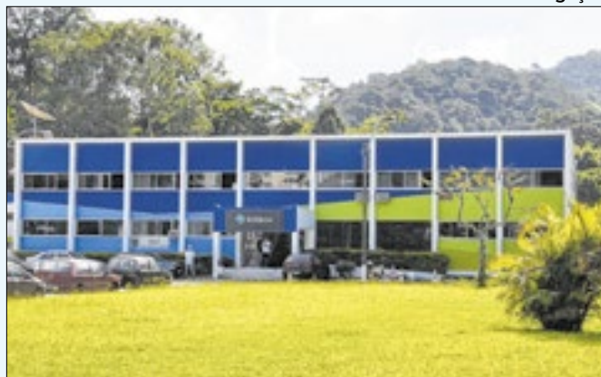
Mais de 650 opções de cursos em diversas áreas