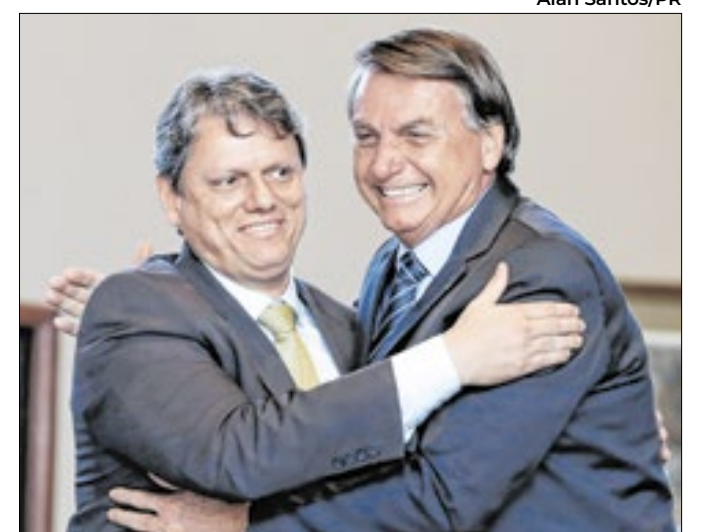
Governador teme perder apoio dos mais radicais