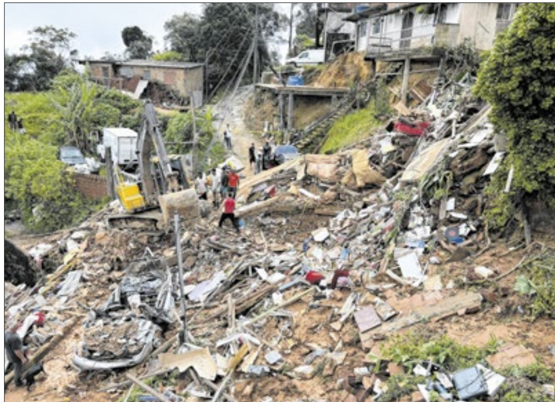
Deslizamento de março deste ano no bairro Independência matou cinco pessoas

De acordo com o ANPC, elaborado pela Assessoria de Atribuição Originária Cível e Institucional (AOCÍVEL/