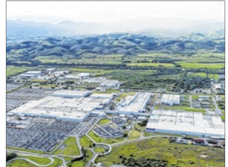
Fábrica da supermontadora fica em Porto Real, no RJ