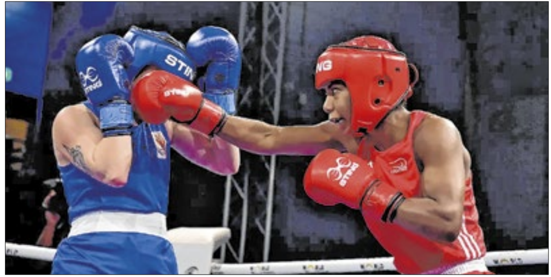
Foram quatro ouros, duas pratas e três bronzes na Inglaterra

A Copa do Mundo faz parte do calendário da World Boxing, nova federação internacional da modalidade, fundada em abril do ano passado para manter o esporte na Olimpíada, após o Comitê Olímpico Internacional (COI) desfiliar a Associação Internacional de Boxe (IBA) por corrupção