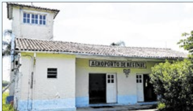
Aeroporto de Resende será completamente reformado