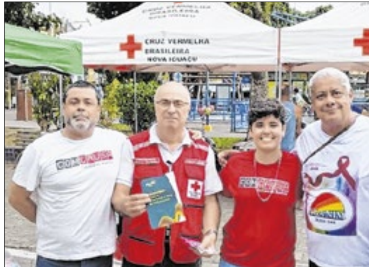
Conscientização ocorreu na Praça Elizabeth Paixão

A ação na praça foi marcada por conversas com a comunidade, distribuição de materiais informativos e orientações de saúde, destacando que o enfrentamento ao HIV/AIDS é um compromisso de toda a sociedade. A atividade integrou a 17ª Jornada de Direitos da ComCausa, que promove debates e mobilizações voltados para inclusão social, saúde e cidadania e acontece há vários anos no mês de dezembro.