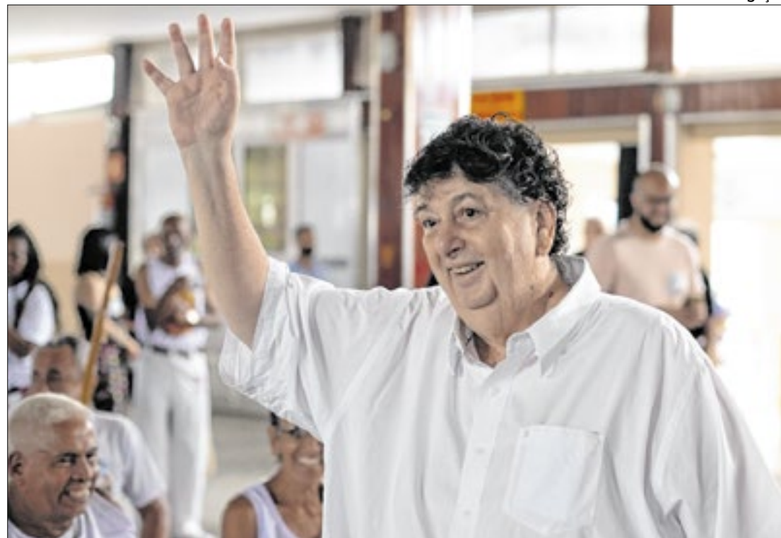
Neto diz que emendas indicam a confiança dos parlamentares na administração municipal

Outras emendas a serem destacadas são os R$ 380 mil para aquisição de aparelho de anestesia com monitor multiparâmetros para o Hospital São João Batista (HSJB), além de R$ 92 mil para a compra de desfibriladores para o Hospital Municipal Doutor Munir Rafful (Hospital do Retiro) e R$ 100 mil para aquisição e manutenção de equipamentos musicais destina-