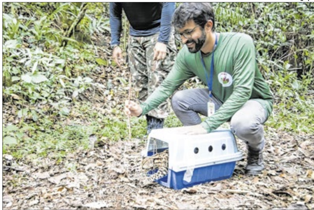
Soltura foi realizada na Reserva Biológica Estadual de Araras, em Petrópolis - RJ