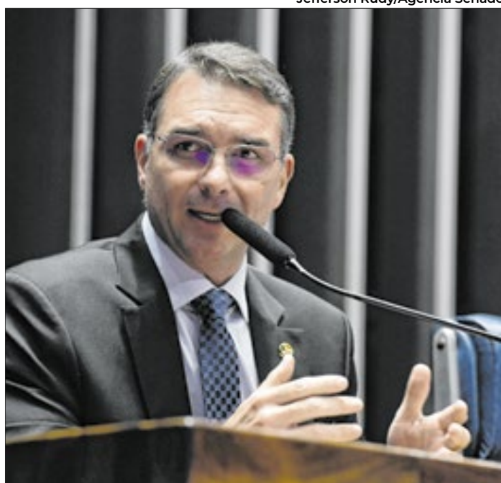
Flávio Bolsonaro: governo está sendo “burro”

O relatório destaca que muitos cidadãos adquiriram imóveis, com registros válidos, e, após anos, têm suas propriedades contestadas pela