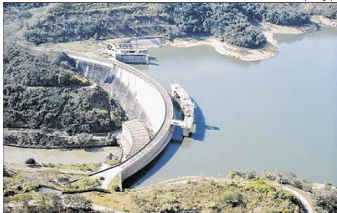
Simulado será perto da barragem da Usina Hidrelétrica de Funil, em Resende-RJ

A Eletrobras realizará, no dia 5 de dezembro, em conjunto com os órgãos de proteção e defesa civil, um treinamento simulado de evacuação de emergência em localidades de Resende próximas à barragem da Usina Hidrelétrica de Funil.